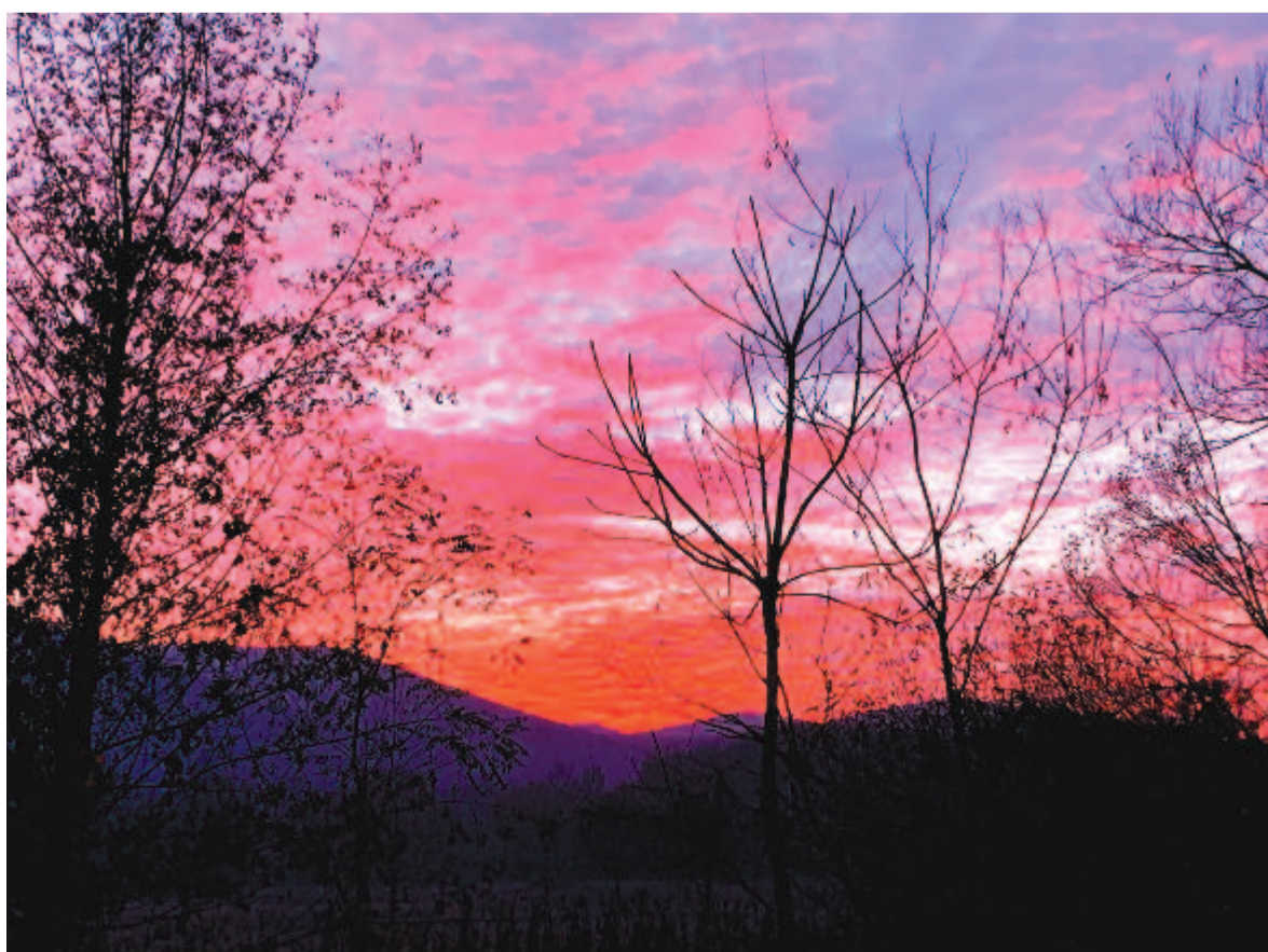
A lebukó nap az erdőtaréjos dombhát felett galambvér rubinját ontja a felhők alá

Maradok kiváló tisztelettel. Kelt 2020-ban, 319 évvel Anders Celsius születése után.