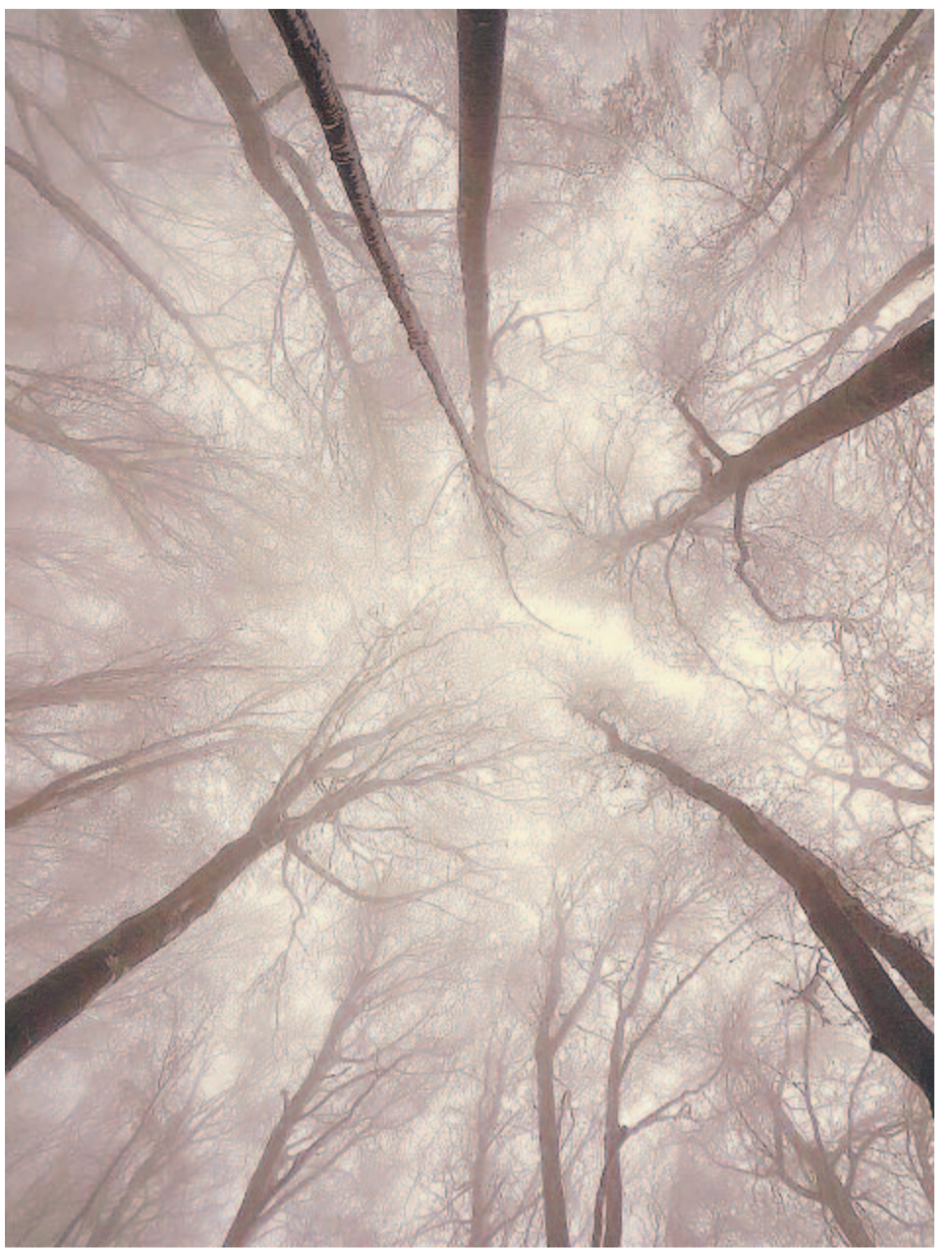
Advent langyos ködébe balsamozva

Advent a „nehézkés Mária” időszak. A liturgia az adventet a hajnalhoz hasonlíti. Miként a hajnali derengés előre jelzi a naptámadatot, a régi magyar mondavilágban a