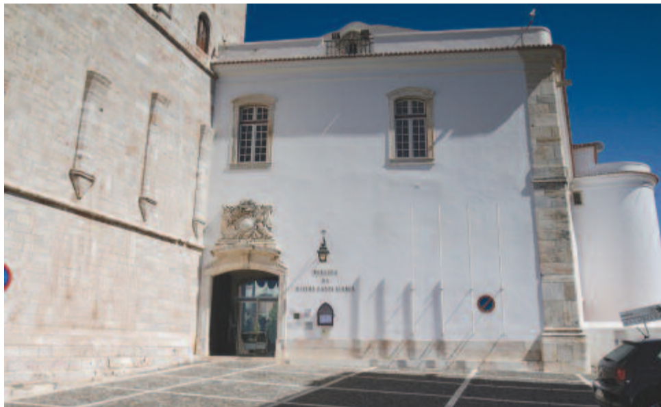
A Rainha Santa-kápolna

Kirámoljuk csomagjainkat, s indulunk is a kikötőbe, egy kétórás hajóútra, hogy megnézzük a sokat reklámozott sziklákat. Bizony, a kikötő már inkább forgalmas, mint a szálloda környéke, a vízen csónak csónak mellett, de a szárazföld sem sokkal különb. Hajónk már a kikötőben van, éppen