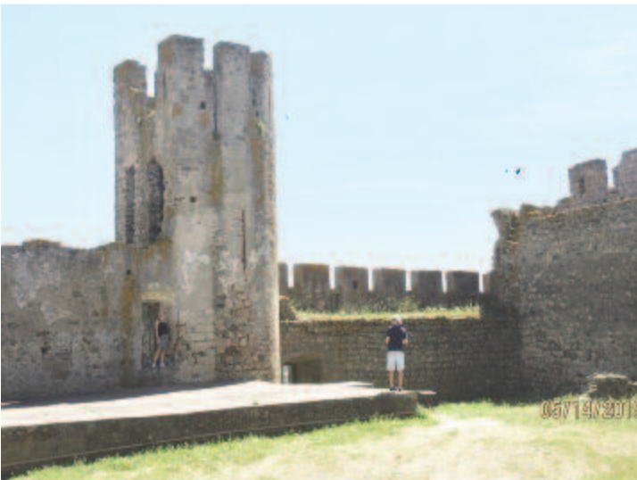
Az arraiolosi vár egyik maradványa

Arraiolos települést a kelta törzsek alapították 300 körül, jelenleg mintegy 3.300 lakosa van, ismert bortermelő település. Az itt készült gypjűszőnyegek is nevezetesek. Kör alakú várfala 1306–1310 között, vártemploma pedig (Igreia do Salvador) a XVI. sz.-ban épült. Mindkettő érdekes hely, de úgy néz ki, távol esik a megszokott turistaútvonalról, mert kevés látogatóval találkoztunk.