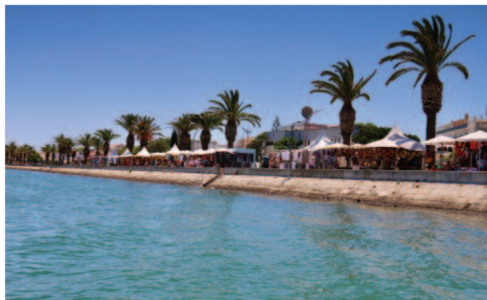
Az óceán felé