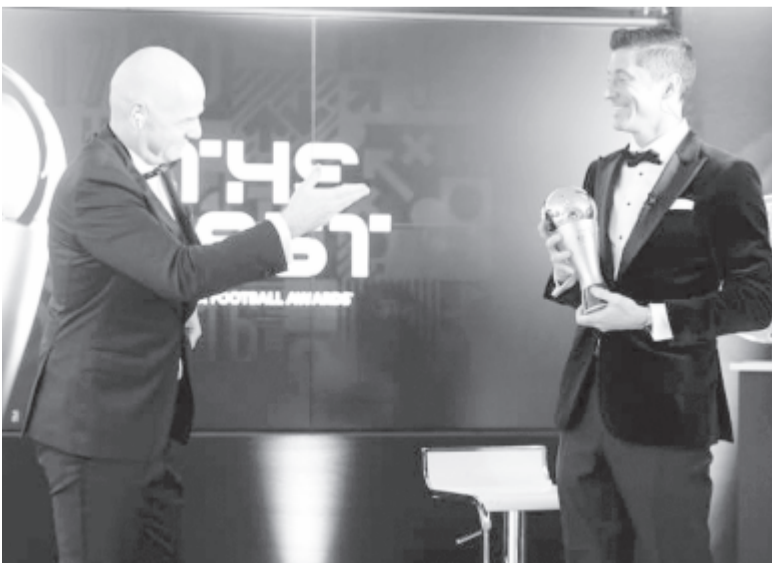
A Nemzetközi Labdarúgó-szövetség elnöke, Gianni Infantino gratulál az év legjobbjának választott Robert Lewandowskinak

* az év női csapata: Christiane Endler (chilei, Paris Saint-Germain) – Lucy Bronze (angol, Olympique Lyon), Wendie Renard (francia, Olympique Lyon), Millie Bright (angol Chelsea) – Tobin Heath (amerikai, Manchester United), Veronica Boquete (spanyol, AC Milan), Barbara Bonansea (olasz, Juventus), Megan Rapinoe (amerikai, OL Reign) – Delphine Cascarino (francia, Olympique Lyon), Vivianne Miedema (holland, Arsenal), Pernille Harder (dán, Chelsea)