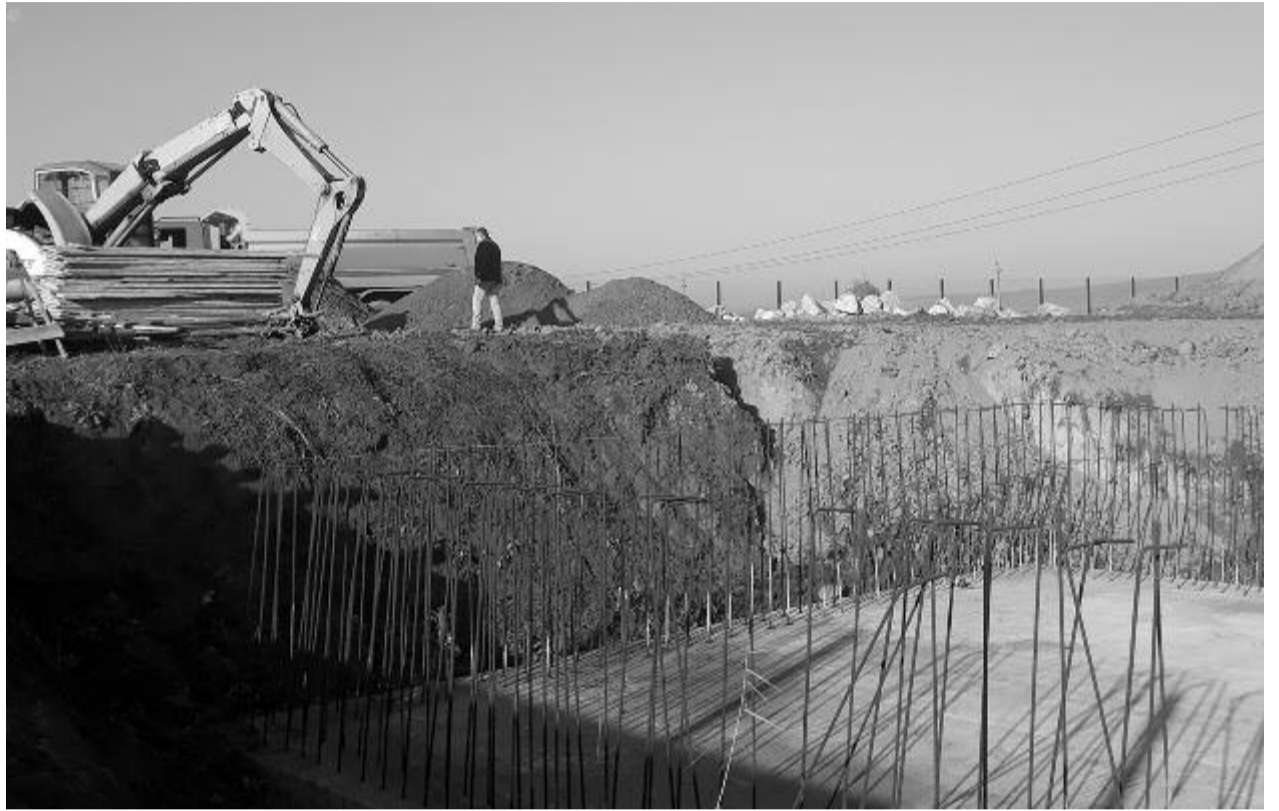
Csak félig tudta elvégezni a munkát a kivitelező a vállalt határidőre, ezért bontják fel a szerződést