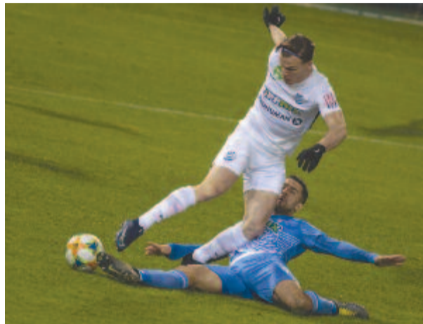
Az elmúlt évadban a Fehérvár FC nyerte a Magyar Kupát, amelynek döntőjét jövőre május 5-én rendezik.

„A versenynaptár módosítása a hazai bajnokságban szereplő felnőtt válogatott játékosokat is kedvezően érinti, hiszen a szövetségi kapitány a felszabadított időszakokban edzőtáborban készítheti fel a csapatot előbb a márciusi vb-selejtezőkre, májusban pedig az Eb-re” – áll a közleményben. A magyar válogatott Bulgária 3-1-es és Izland 2-1-es legyőzésével kvalifikált a pótszelejte-