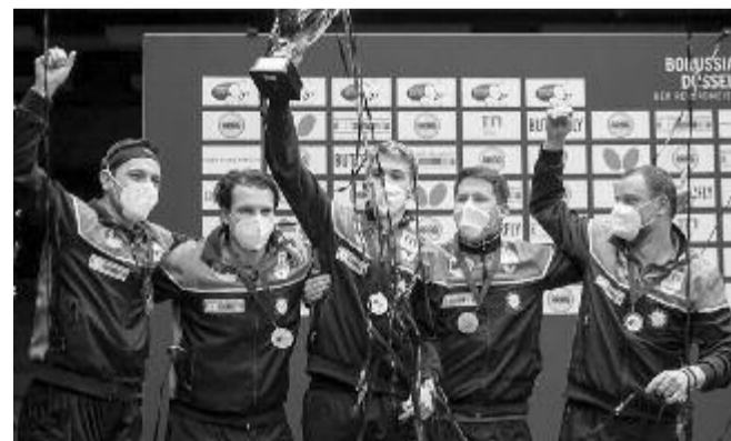
A Borussia Düsseldorf tizenkettedszer bizonyult Európa legjobb klubjának.

A férfiaknál a Borussia Düsseldorf a döntőben 3-1-re múlta felül az ugyancsak német 1. FC Saarbrückent, s ezzel hatodszor nyerte meg a BL-t, és mivel annak elődjében, a BEK-ben is ennyiszor diadalmaskodott, immár tizenkettedszer bi-