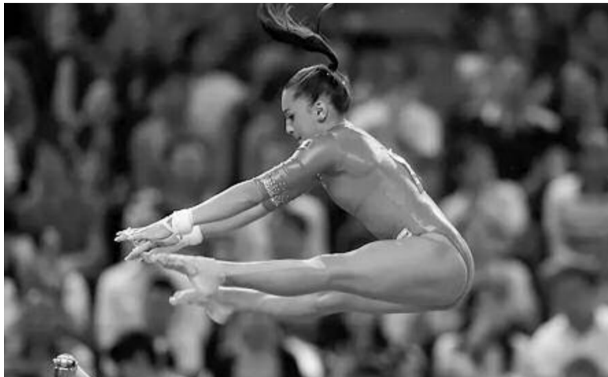
A román csapat vezéregyénisége, Larisa Iordache három évvel ezelőtt versenyzett utoljára