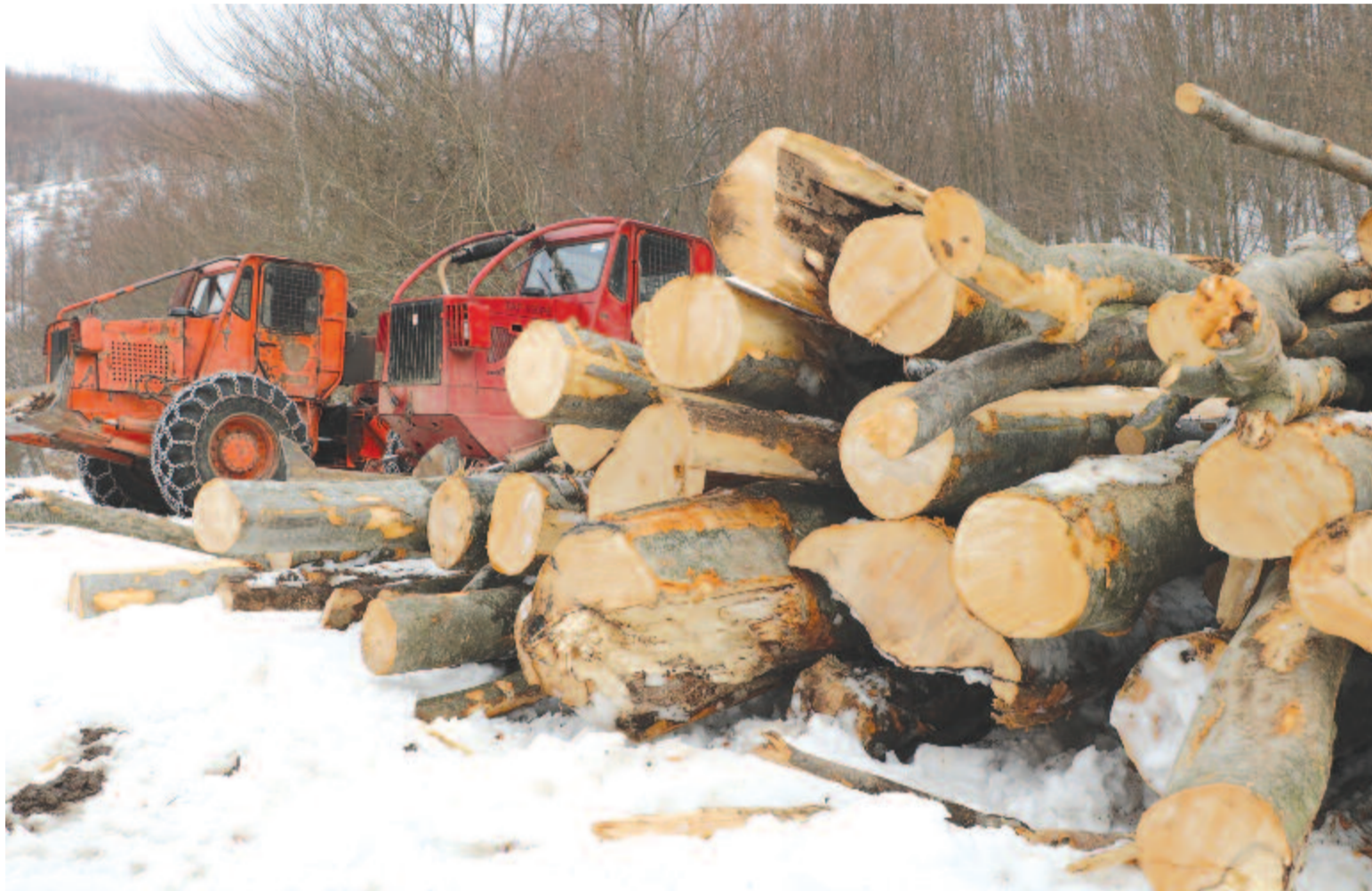
Január végén beindítják az illegális erdőirtás megfékezését célzó fakövetési rendszert