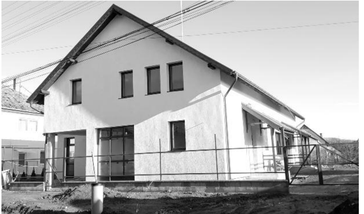
Az épület még nincs kész, de a határidők tarthatók, ezért nem mondanak le az ideai intézményavatásról