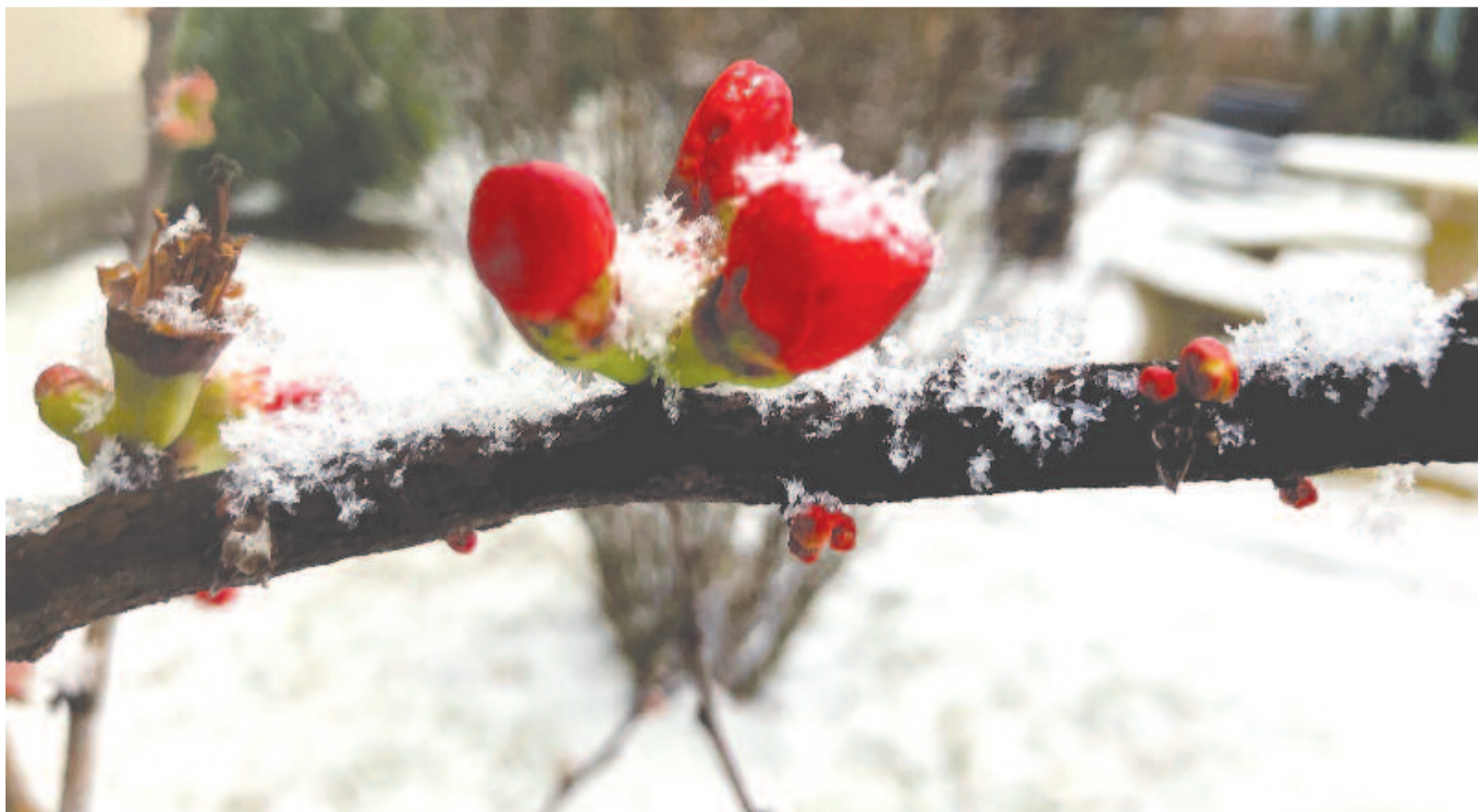
Néha megbomlik az idő, s bimbóba csalogatja a kert bokrait