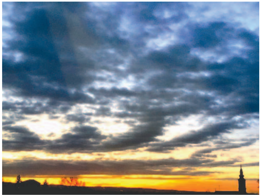
„A Keleti-Kárpátokból bésöprik a remetéket”

„Az itt következő kompozíció »szellemi indítéka« Assisi Szent Ferenc életének egyik legmeghatóbb epizódja. (...) Hiányos képes-