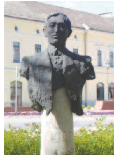
Mellszobra szülővárosában