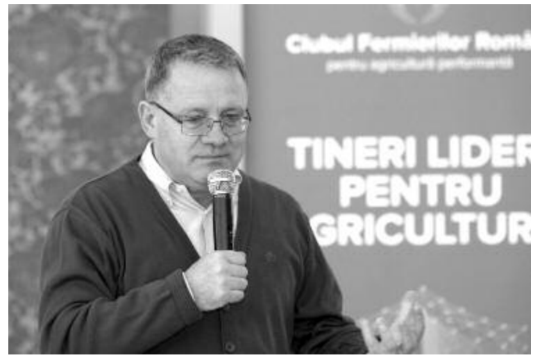
Nechita Adrian Oros mezőgazdasági miniszter

Február 12-én a Romániai Farmerek Klubja meghívására Kézdivásárhelyre látogatott Nechita Adrian Oros mezőgazdasági miniszter, akinek átadták a burgonya-termesztési stratégiát. A dokumentum egy sor olyan intézkedést és irányelvet tartalmaz, amely európai szinten versenyképessé teheti a hazai burgonyát. A találkozón más, nem csak a háromszéki gazdákat érintő kérdések is felmerültek.