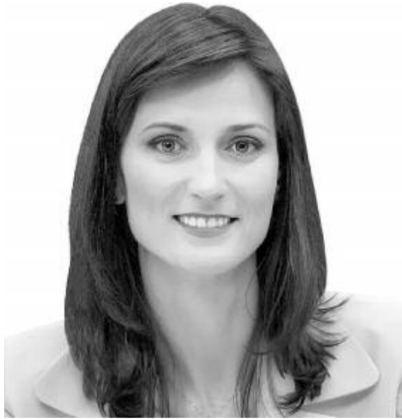
Marija Gabriel, az innovációért, kutatásért, kultúráért, oktatásért és ifjúságért felelős biztos