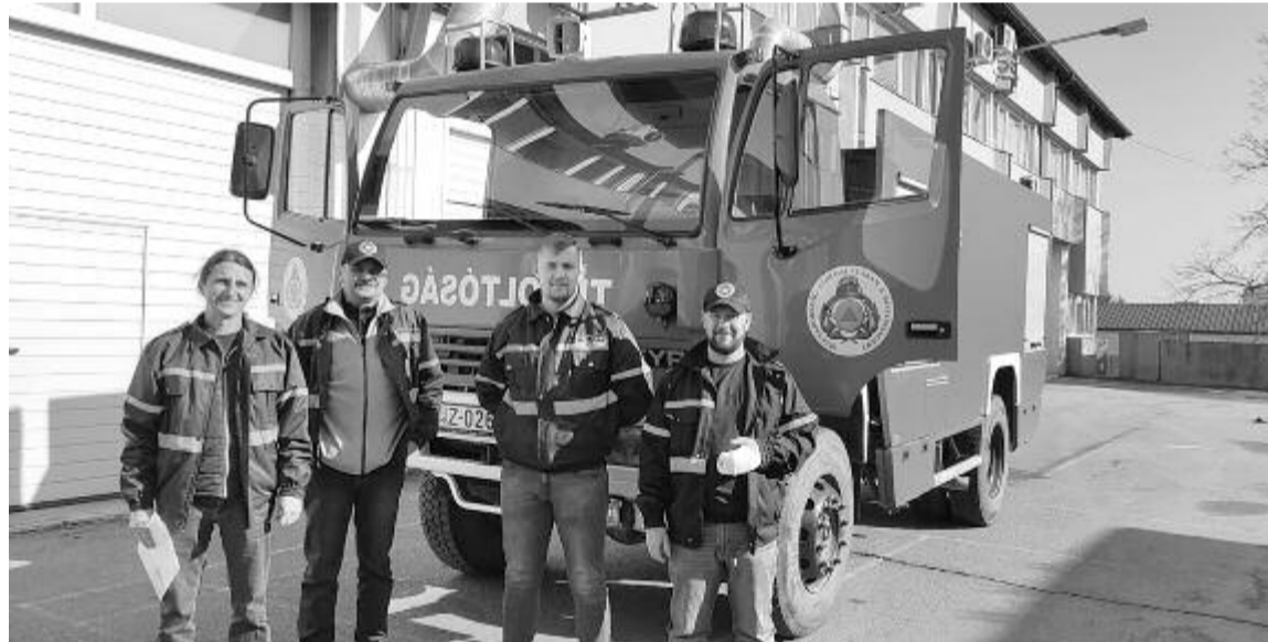
Hétfőn vették át és szállították haza Magyarországról az autót