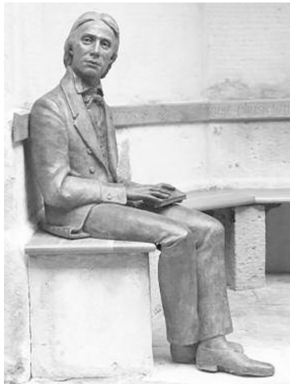
John Keats szobra a Guy's Hospitalban

A felirat téved, hiszen ma már a kor angol lírájának legnagyobbjaként tartjuk számon. Elismertsége Byron kultuszának hanyatlásával csak nőtt, ma már a világirodalom legnagyobbjai közé sorolják, versein kívül komoly irodalmi értéket képviselnek levelei, amelyekből mély gondolatiság, érzékeny kritikai szemlélet rajzolódik ki. Cs. Szabó László szerint ő volt „az angol irodalom Prometheusa, aki megrabolta Spenser, Shakespeare, Milton és Ariosto tüzét”. Műveit Kosztolányi Dezső, Babits Mihály, Tóth Árpád, Vas István, Radnóti Miklós, Szabó Lőrinc fordították magyarra. (MTI)