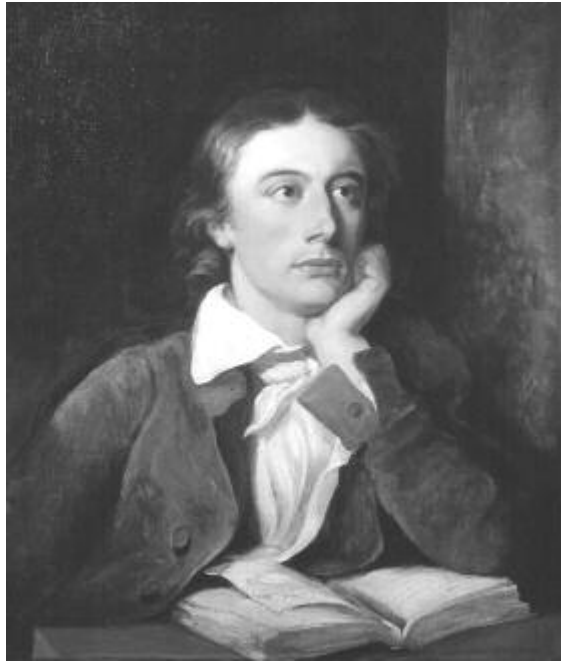
John Keats

1818-ban egy skóciai kirándulásán megfázott, ekkor jelentkeztek először tüdőbajának tünetei. Ugyanebben az évben halt bele a tuberkulózisba öccse, az ő ápolása közben szeretett bele a szomszéd-ságukban lakó Fanny Brawne-ba. Kapcsolatukat beárnyékolta a költő egészségi állapota és anyagi helyzete, a következő évben ugyan eljegyezték egymást, ám a házasságra a lány anyjának ellenkezése miatt nem kerülhetett sor. 1819-ben született Boccaccio nyomán Izabella, vagy a bazsalikomserép című