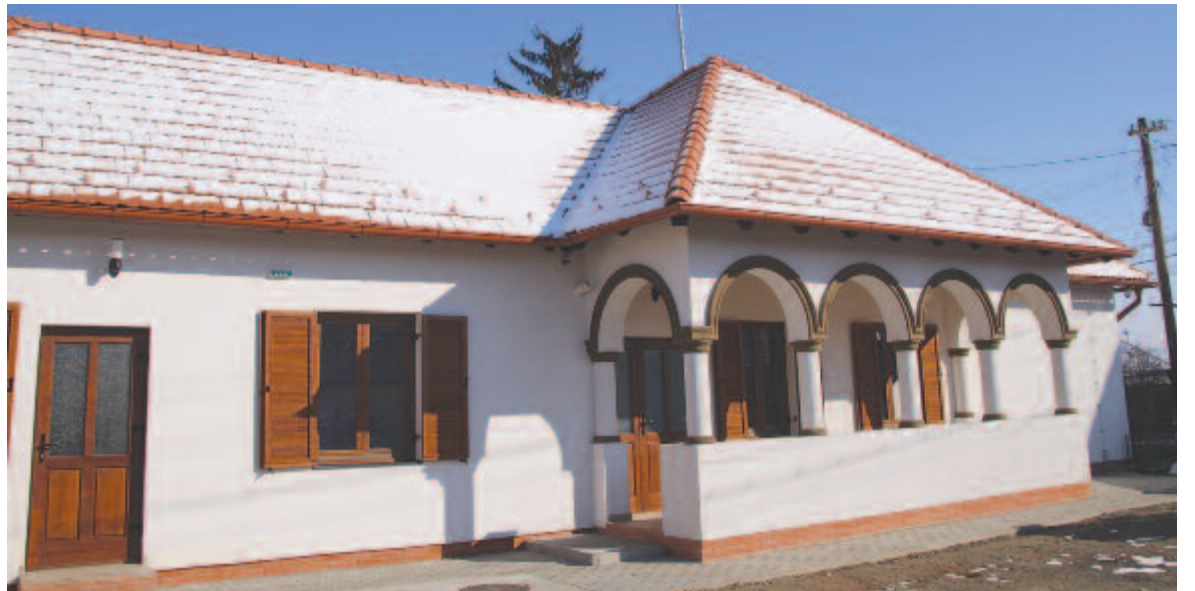
Elkészült a múzeumnak helyet adó tájház

Minden a pénz körül forog. Szeretnénk kialakítani egy piacteret is. Megvan a terület, területrendezést kellene eszközölni, lefedni azt a részt, ökövecéket vásárolni vagy bérelni. Pókakeresztúrra szeretnénk egy új kultúrotthont építeni. A jelenlegi, vályogból készült épület egyik oldala már kidőlt. A CNI-hez benyújtottuk a pályázatot, kaptunk levelet, miszerint rajta vagyunk a