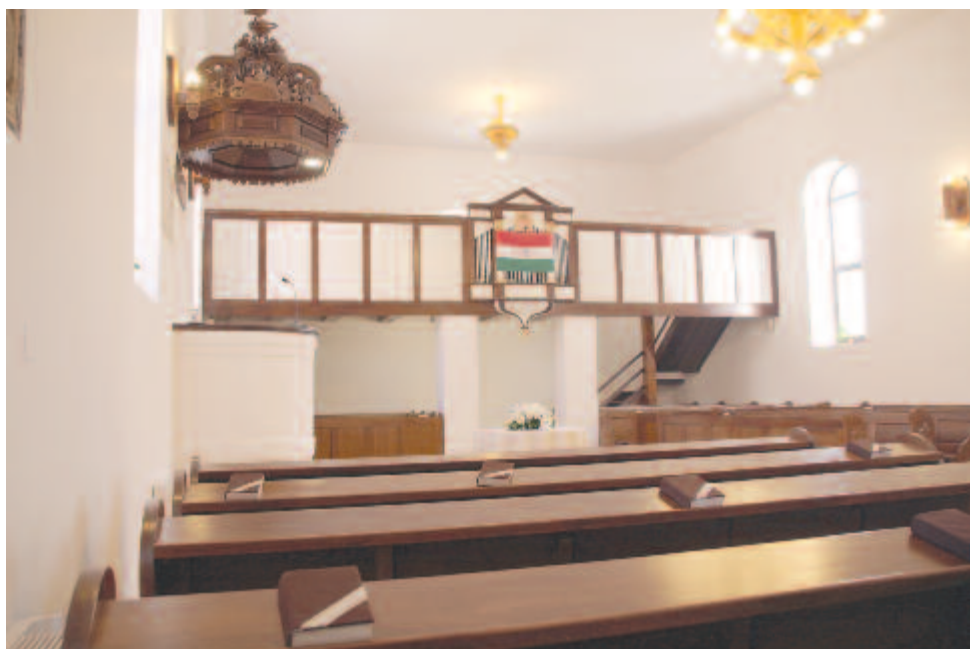
A felújított református templom belseje

A Környezetvédelmi Alapnál megnyertünk egy pályázatot, ami a közvilágítás felújítását, a lámpatestek cseréjét tartalmazza. A tavasszal LED-es lámpatesteket szerelünk Sárpatakon és Pókának egy részén, mert a lélekszám szerint megadott pénzüsszeget nem léphetjük túl. 3800 lelkes községként csak 100.000 eurót tudtunk lehívni, de értesítéseink szerint lesz még kiírás, és akkor a község többi részén is kicseréljük a lámpatesteket.