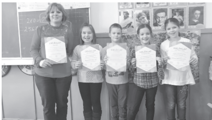
A nyáradszeredai Szó-kincs-vadászok csapat a legjobb teljesítménnyel jutott be az erdélyi csapatok közül a döntők egyikébe