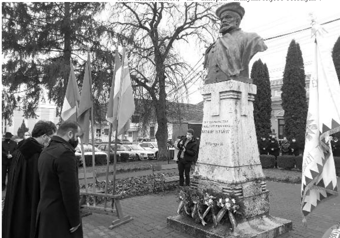
Szervezetek, intézmények, egyházak képviselői hajtottak fejet idén is Bocskai szobra előtt