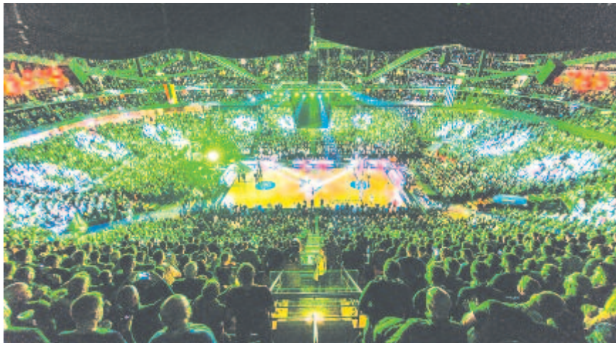
Hangulatkép a Žalgiris Kaunas otthonáról.