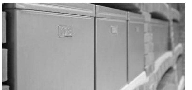
Jelöletlen, emberi maradványokat tartalmazó fémdobozok a Székesfehérvári Osszáriumban (csontkamrában)

A Magyarországi Kutató Intézet az archeogenetikai kutatás során több mint 600 koponya és majdnem ugyanennyi vázmaradványt vizsgált, amelyek összesen több mint 900 egyén maradványait jelenthetik. (MTI)