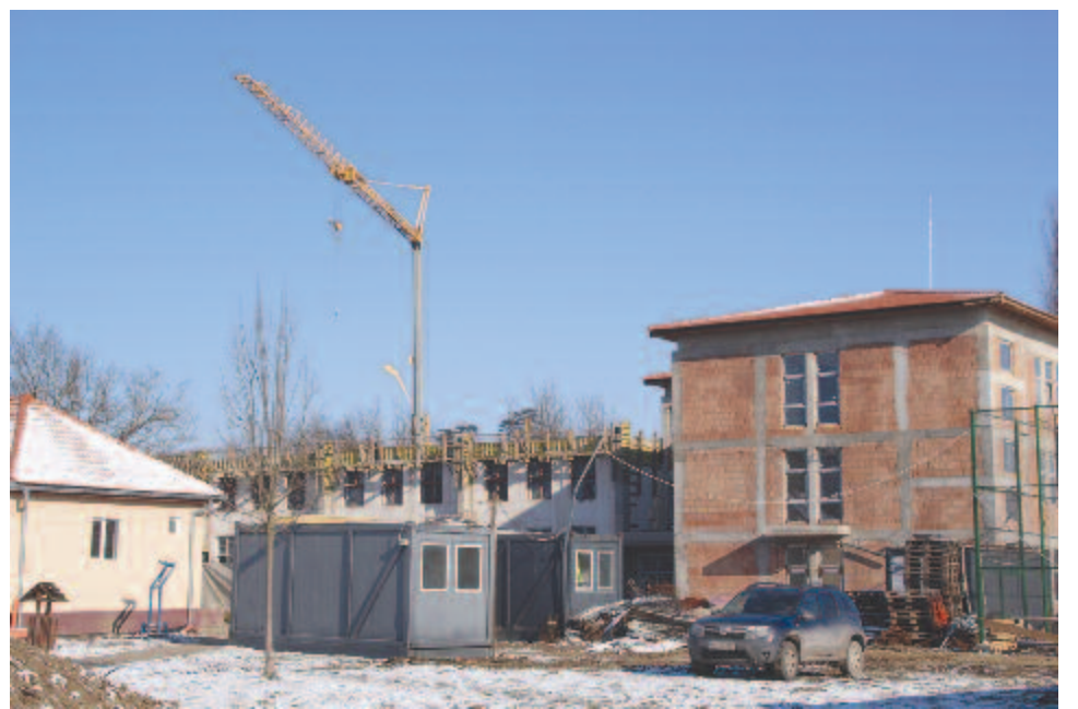
Új szárnyat kap az iskola