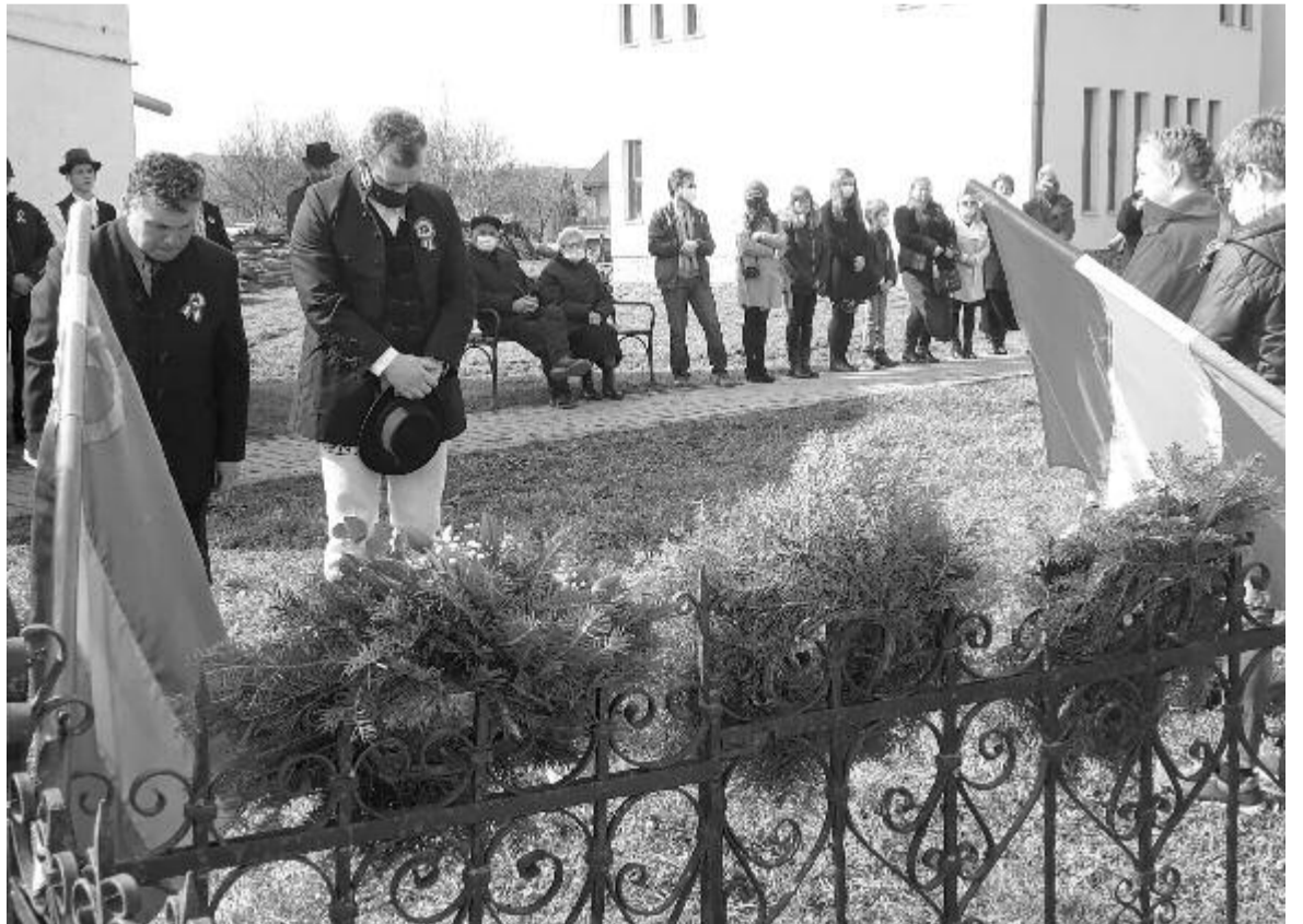
Csikfalva községben négy helyszínen hajtottak fejét a hősök emléke előtt