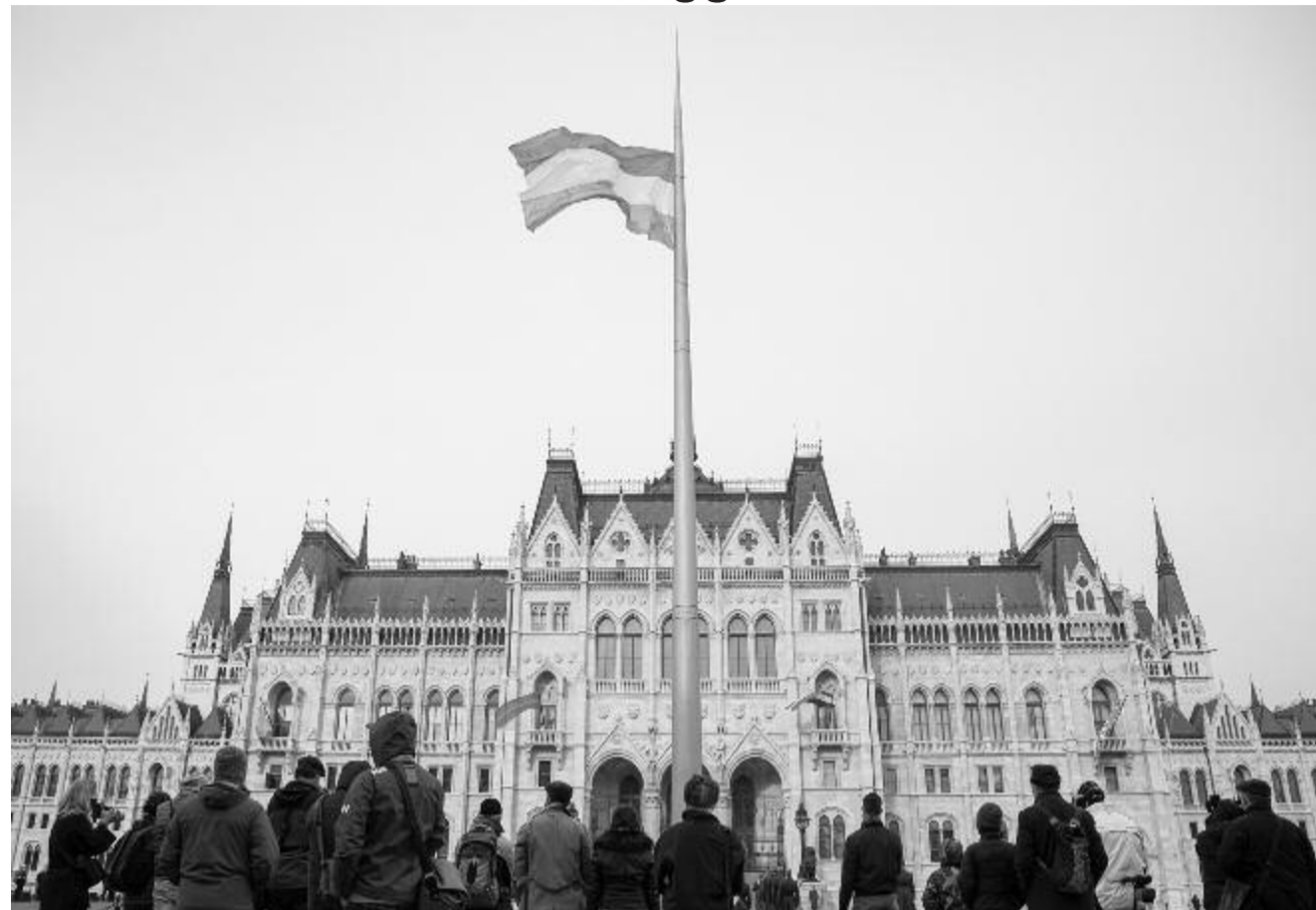
Felvonták a nemzeti lobogót az Országház előtt