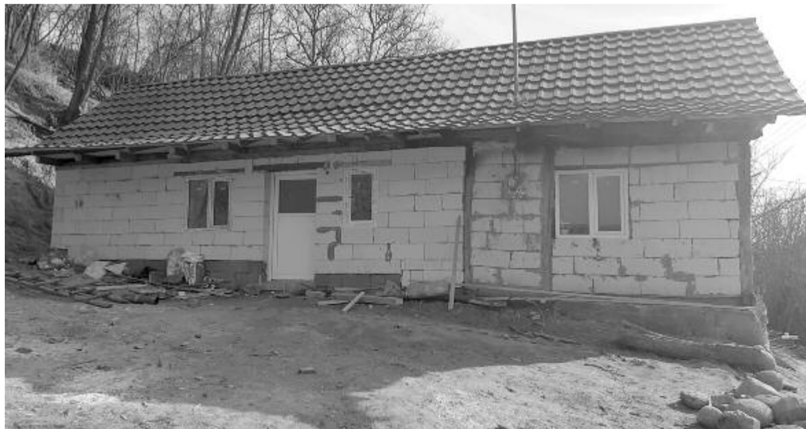
A hihetetlenül gyors, széles körű összefogásnak köszönhetően újjáépült a tűzkárosult család háza