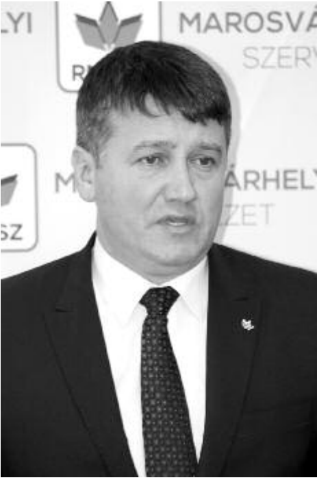
Vass Levente

Cseke Attila fejlesztési, közmunkai és közigazgatási miniszter, az országos érdekeltségű munkálatokat elbíráló minisztériumközi tanács elnöke március 5-én jóváhagyta az égési sérülteket ellátó marosvásárhelyi központ építését. Az új épületben a megyei sürgősségi klinikai kórház mögött épül fel.