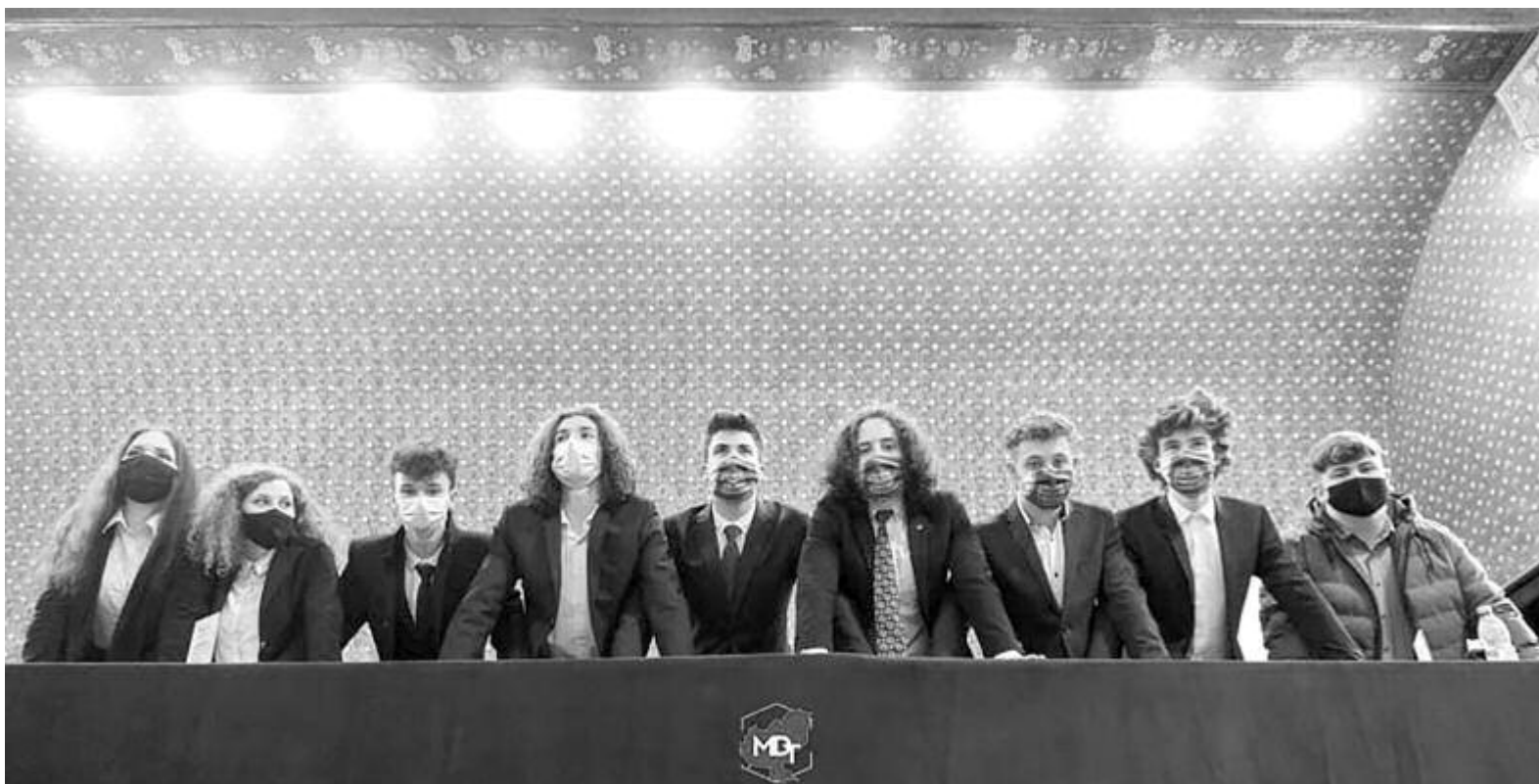
Az MDT leköszönő elnöksége

múlt egy évben. Ezt követte az MDT beszámolója az elmúlt két és fél évről, elmondták mindazt, ami meghatározta ezt az időszakot. Beszámoltak az örömeikről, de nem rejtették véka alá a nehézségeket sem, illetve új célokat fogalmaztak meg, amelyek közül az egyik legfontosabb az, hogy egy nagy családként szeretnének működni. Lezárult egy korszak. Azok a tagok, akik keményen dolgoztak az esemény során, megkapták a szervezet Bernády-díját. Aztán az MDT vezetése átadta a stafétát. Kíváncsian várjuk, hogy miként fog alakulni a diáktanács jövője, de borítékolható, hogy még sok értékes esemény kapcsán fogjuk hallani a nevüket.