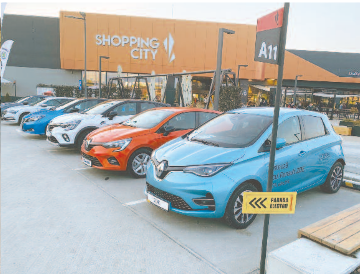
Elektromos és hibrid Renault-k