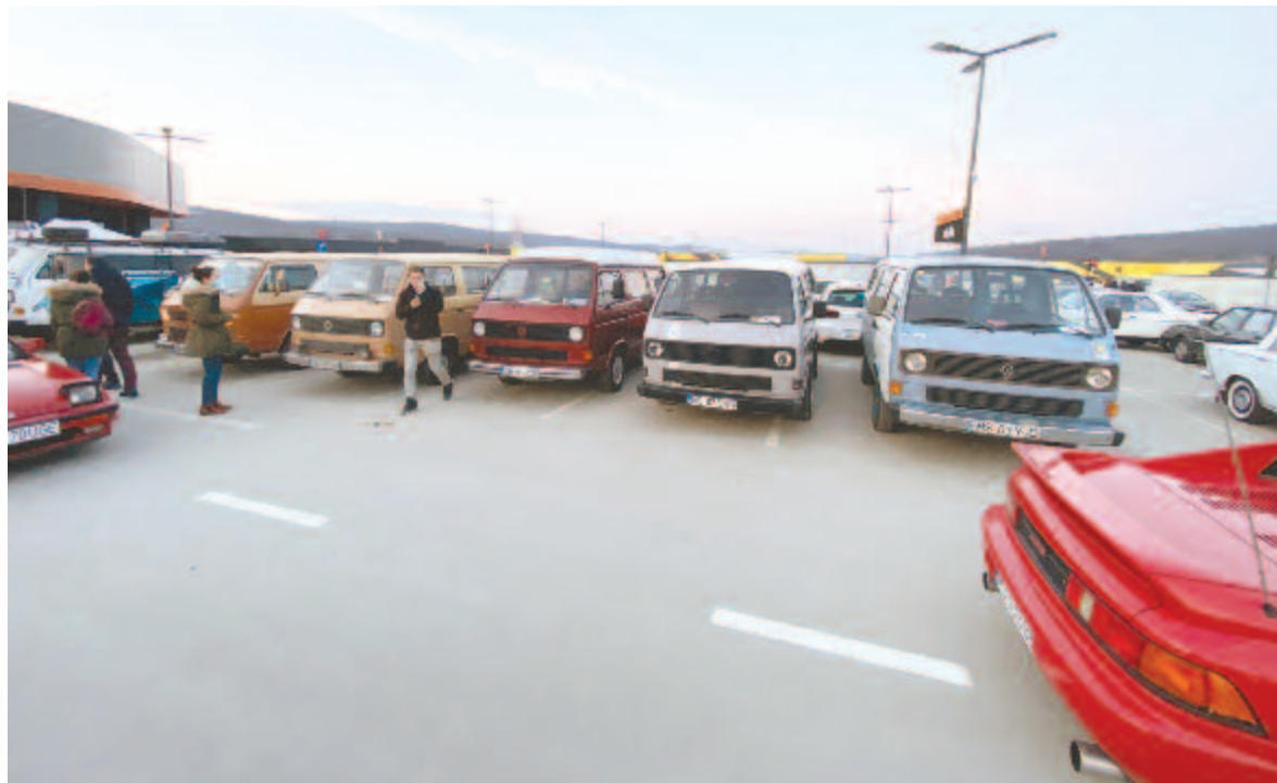
Egy sor VW kisbusz

Összességében volt minden, ami megdobogtatja az autók szerelmeinek a szívét, voltak régi és új kocsik egyaránt, volt benzingöz, de töltőkábel is.