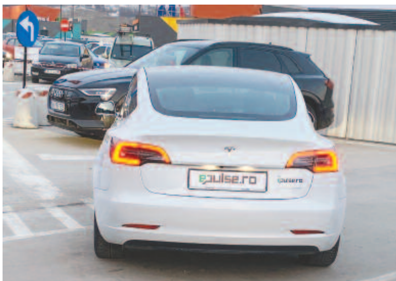
Tesla Model 3

Meglepő volt látni a sok embert, akik a leparkolt kocsik között járkáltak, csodálva az érdekesebbnél érdekesebb autót. Az eseménynek olyan hangulata volt, mint egy nagy baráti összejövetelnek, bárki odamehetett egy idegen ember autójához, megnézhetette, lefényképezhetette, sőt egyes autókba bele is ülhetett. Mindenki nagyon közvet-