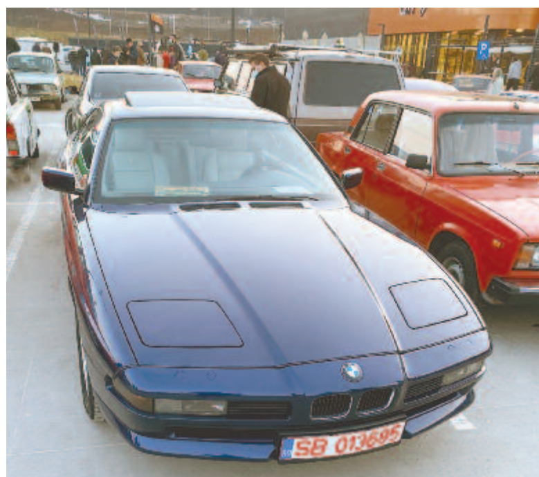
BMW 850i, 5 literes, V12-es, közel 300 lóerős egész sort megtöltöttek, és nem volt közöttük két egyforma.

gyöngyszemeket is lehetett látni, mint például az 1990-es évekből származó 8-as BMW-t, 5 literes V12-es motorjával, vagy a Németországból származó Trabantot, amely egykor rendőrautóként szolgált. Ezenfelül voltak tuningolt járművek, érdekes színekben, a talajtól alig néhány milliméterre vagy különleges belső alkatrészekkel, de olyan autó is volt, amelyikben több volt a hangfal, mint a belső borítás, azaz a kárpitot is lecserélték hangszórókra. Elképzelni sem merjük,