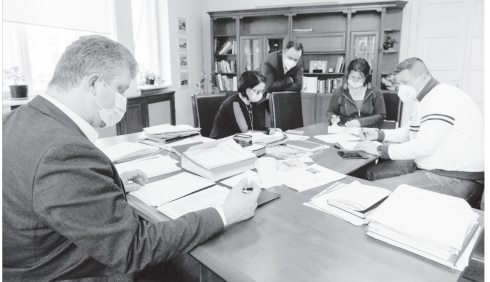
Készül a költségvetés tervezete