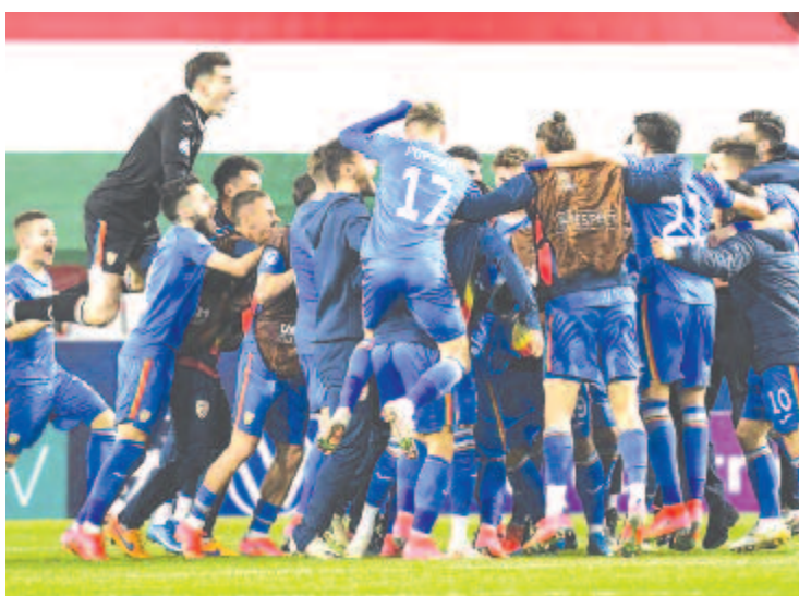
A győztes román válogatott tagjai örülnek a labdarúgó U21-es Európa-bajnokság második csoportkörében, az A csoportban játszott Magyarország–Románia mérkőzés után a Bozsik Arénában 2021. március 27-én. Románia 2-1-re győzött

A magyarok kedden a hollandok ellen fejezik be a szereplésüket Székesfehérváron, a románok a németekkel találkozhatnak.