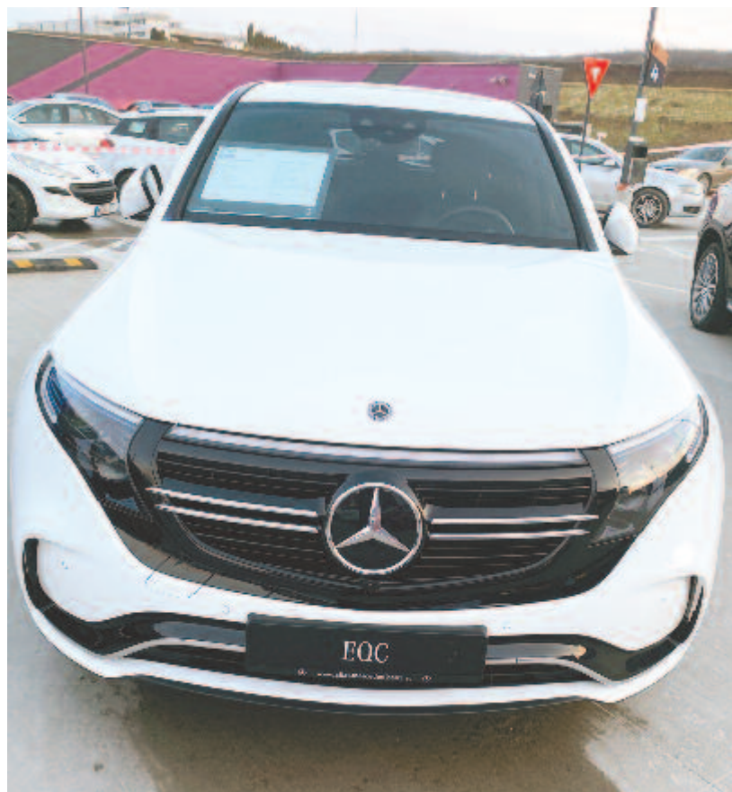
Az első tisztán villamos hajtású Mercedes