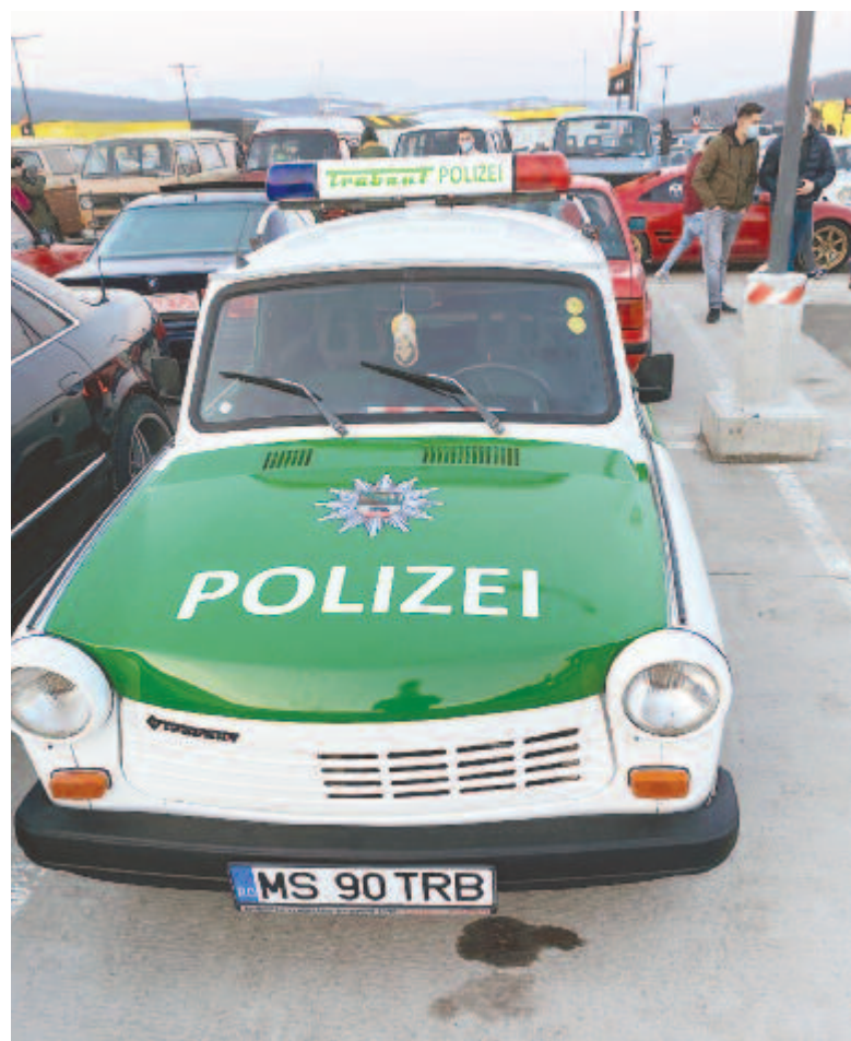
„Rendőrautó voltam Németországban”