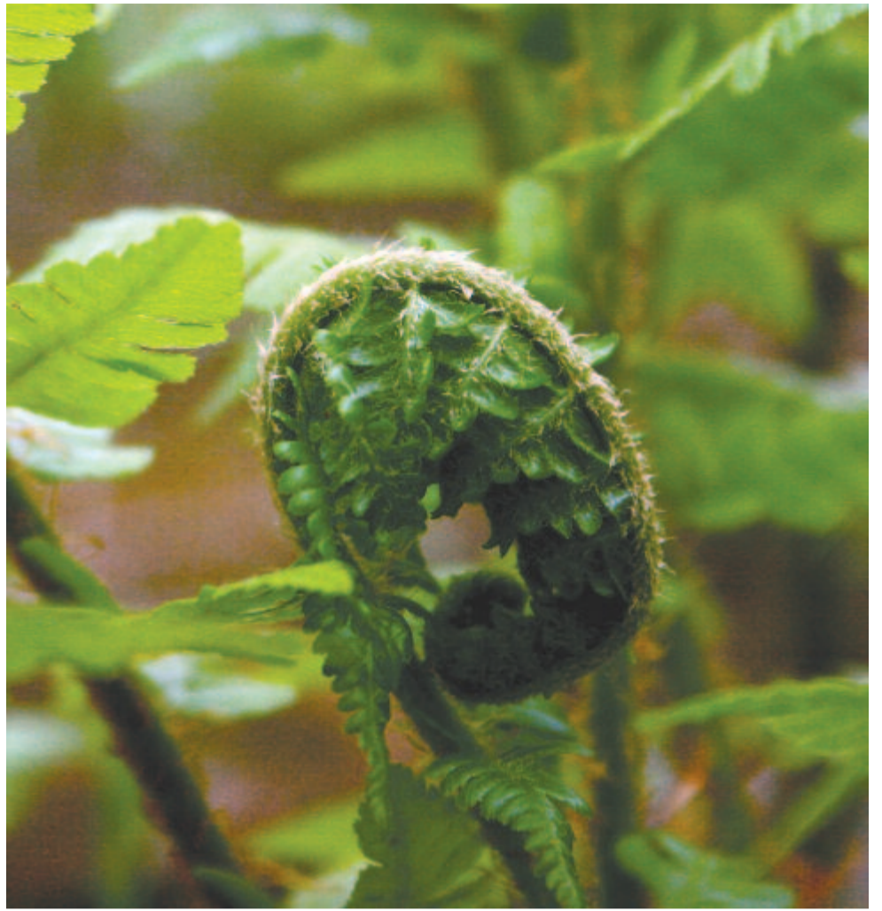
Zöld izmot feszítve gurul sűrű nyárba a páfrány kipörgő levélcsovéja

Motoszkál még fejében egy-egy ének, Szélid szonettek, mennydörgő szavak, Melyekre taps reng és zeng száz ajak.