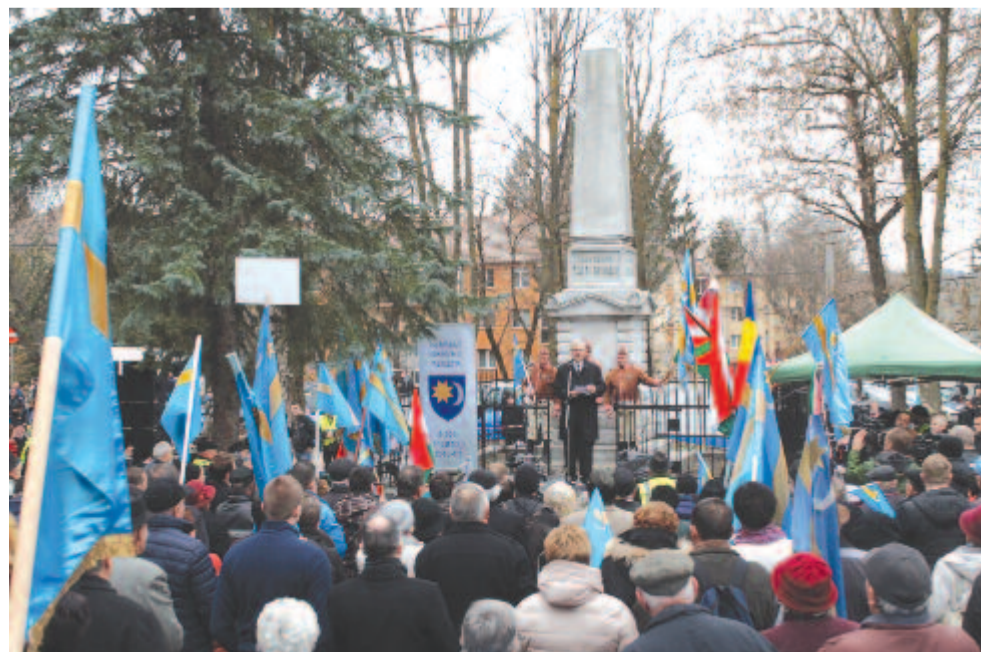
A székely vértanúk emlékműve és a postarét mindmáig a szabadságharcot kötődő események évfordulós megemlékező rendezvényeinek helyszíne. Felvételünk a 2019. márciusi székely szabadság napi megemlékezésén készült.