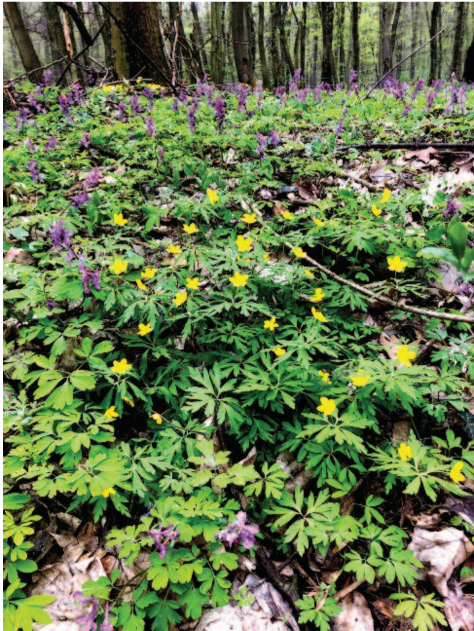
Bogláros szellőrőzsák bizakodó sárgája Szent György-búzák lila tengerében

Már itt az este. A szőlőlevél is Pirosra vált, az ég is rózsafényes, – Az elmulás ez, az emlékezés ez – Már itt az este és már itt a tél is!