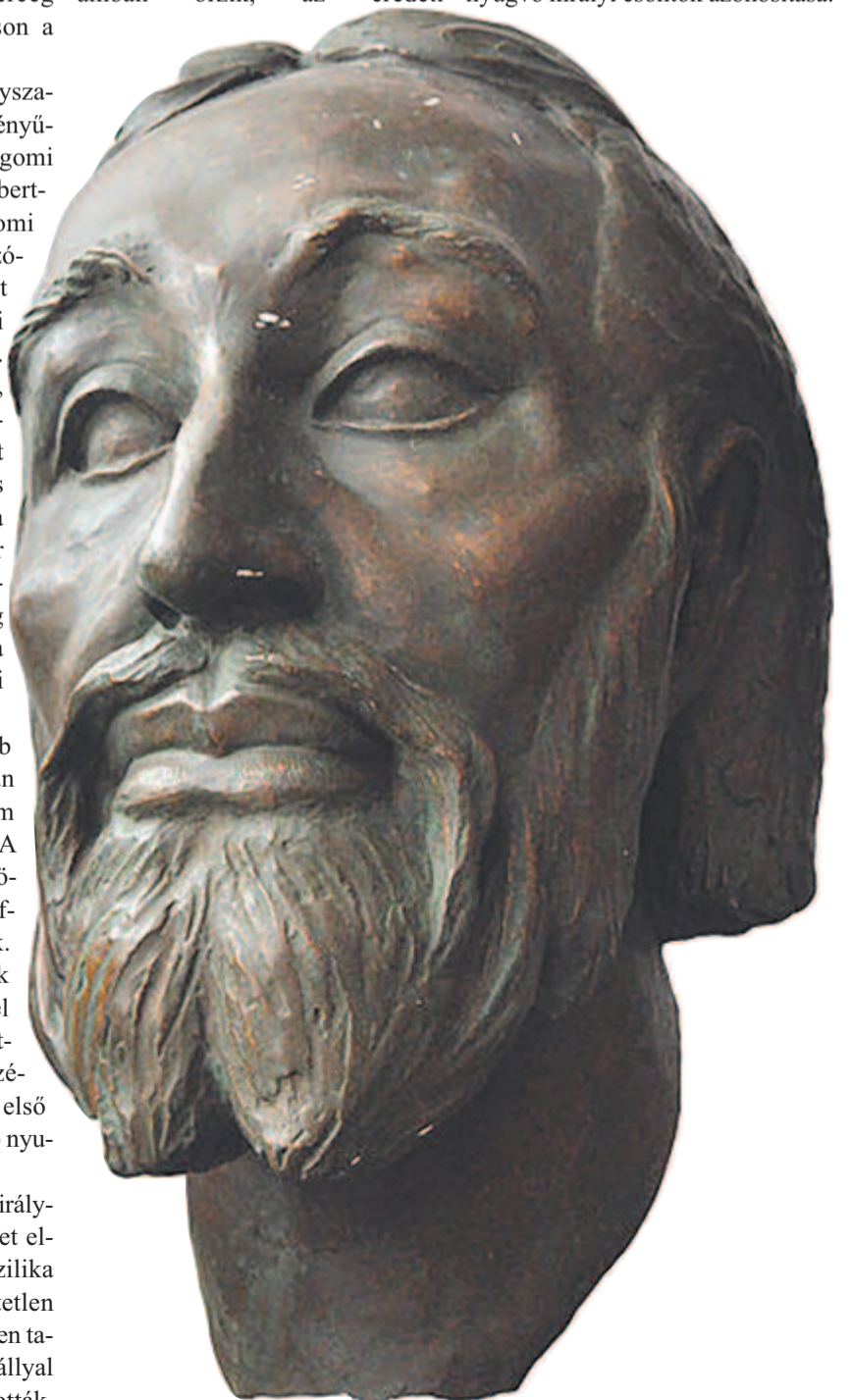
A koponyája alapján készült hiteles arckonstrakció Skultéty Gyula munkája, a székesfehérvári Szent István Király Múzeumban látható.

szarkofágok Székesfehérváron láthatók. A Mátyás-templomban őrzött maradványokból sikerült az archeogenetika eszközeivel az Árpád-ház férfi vonalának jellegzetességeit meghatározni, így idén megkezdődött a székesfehérvári osszáriumban nyugvó királyi csontok azonosítása.