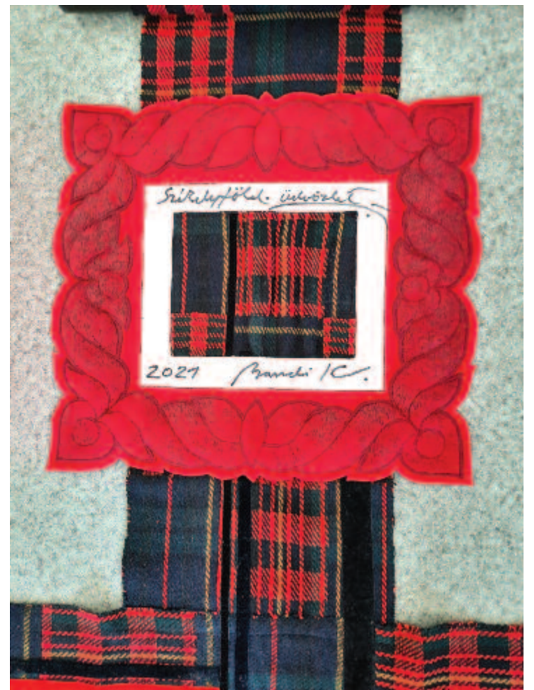
Bandi Kati: Székelyföldi üdvözlés

A recenzió végére, íme egy részlet az összegző, tétova gondolatok sorából: „Bartók egyik utolsó mondata jut eszembe: »csak azt sajnálom, hogy teli bőrönddel távozom«. Mert én meg úgy érzem, hogy teli táskámat üresnek ítélte az utolsó 20-25 év mind odahaza, Erdélyben, mind Magyaror-