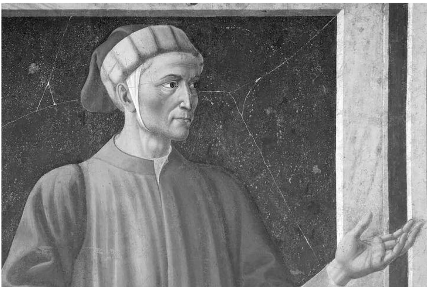
Dante (részlet, 1448-1449 k.), Andrea del Castagno munkája. Uffizi képtár, Firenze. Idén 700 éve, 1321. szeptember 14-én halt meg Ravennában Dante Alighieri (szül. Durante di Alighiero degli Alighieri) olasz költő, filozófus, a világirodalom egyik legnagyobb klasszikusa, ősi nemesi család sarja. Született 1265 májusának második felében, Firenzében.

15 éve, 2006. május 8-án, 85 éves korában hunyt el Budapesten a Kossuth-díjas és többszörös József Attila-díjas író, esszéíró, műfordító, a párizsi Mallarmé Akadémia tagja, a Széchenyi Irodalmi és Művészeti Akadémia (1992) és a Digitális Irodalmi Akadémia (1998) alapító tagja, számtalan díj és elismerés birtokosa, a magyar költészet napjának kezdeményezője. Született 1920. november 28-án Balatonbogláron.