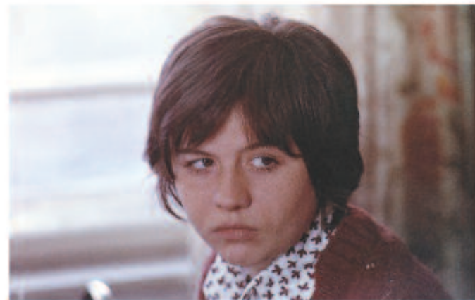
MÉSZÁROS MÁRTA: KILENC HÓNAP (1976)