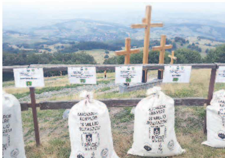
A program jelkép is: ahogyan az összegyűlt búza lisztje a kenyérben egyesül, úgy egyesül minden magyar is a nemzetben

Maros megyében két gazdaszervezet is bekapcsolódott a programba. A Romániai Magyar Gazdák Egyesületének Maros szer-