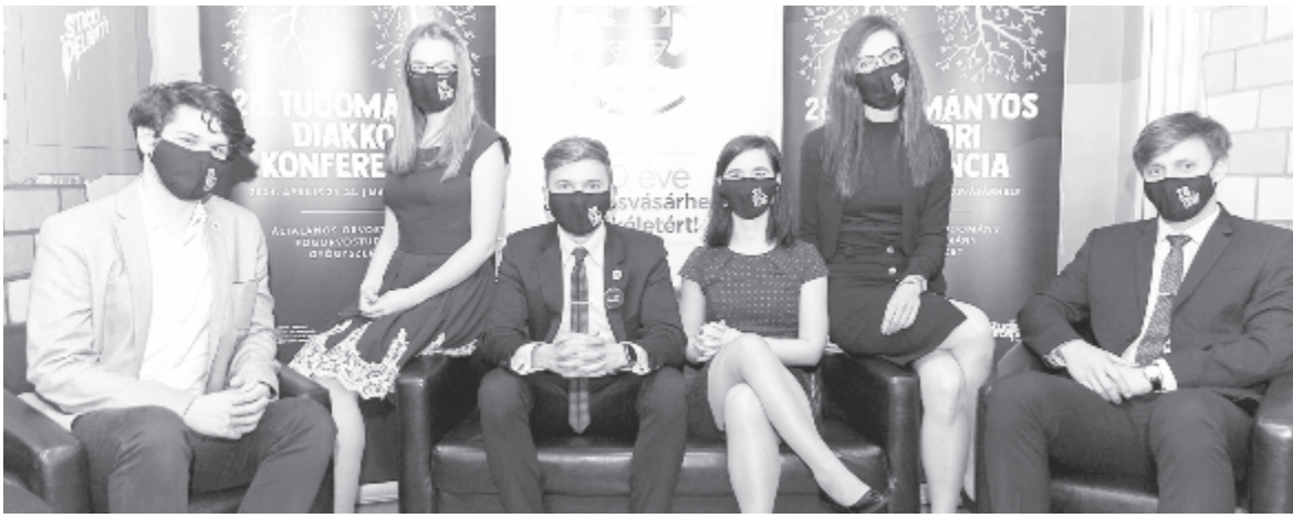
A szervező csapat

Április 21. és 24. között szervezték meg Marosvásárhelyen a 28. Tudományos Diákköri Konferenciát. A járványhelyzet miatt az eseményt nem lehetett a hagyományos formájában megvalósítani, viszont a szervezők nem akarták teljesen átköltöztetni az online térbe. Így idén először hibrid formában valósult meg az orvostudományi és gyógyszerészeti tudományos diákköri konferencia. Az eseményen számos külföldi orvos is tartott bemutatót.