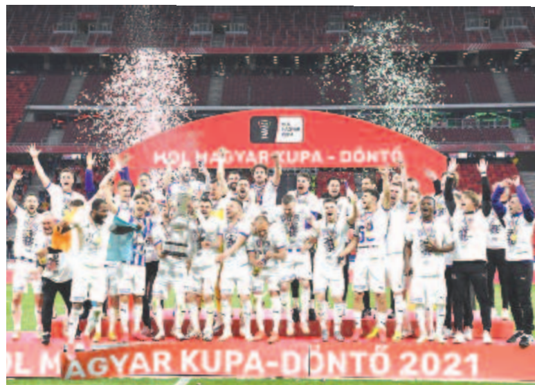
A kupagyőztes Újpest FC csapata.

Sikerével az Újpest indulhat a Konferencia Liga első kiírásában. Nagy valószínűséggel a MOL Fehérvár FC is csatlakozik hozzá bajnoki másodikként vagy harmadikként, mivel a negyedik Paksnak már csak matematikai esélye van megelőzni az OTP Bank Liga hétvégi zárásakor.