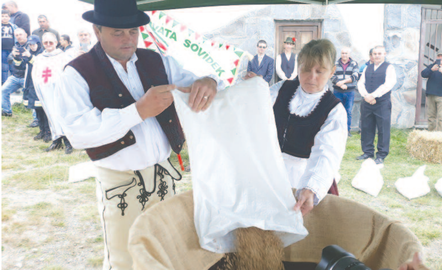
Az RMGE Maros tavaly is partnere volt a programnak, az összegyűlt búzát a Bekecs-tetőn öntötték össze