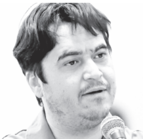
Ruhollah Zam – Iránban kötélt általi halállal kivégezték

Az ENSZ-főtitkár videóüzenete a sajtószabadság világnapján, május 3-án: