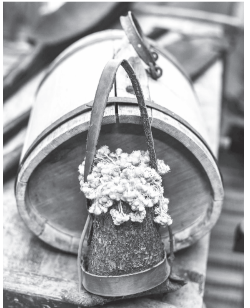
Érdekes, ma már szinte elfeledett eszközöket is vizionálhatunk itt

A fiatalember úgy érzi, eljutott lassan oda, hogy a házban már nem fér a gyűjtemény. Egy másik porta vagy tágas melléképület volna erre a célra a legmegfelelőbb, és egye-