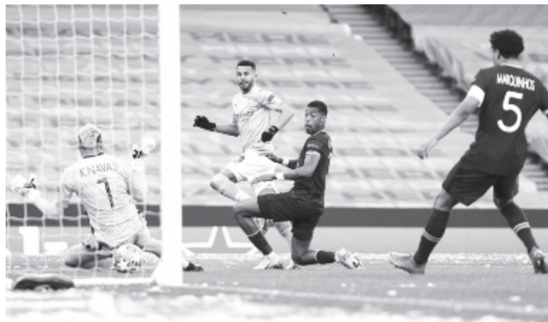
Mahrez első gólja.

A fordulást követően is rendkívül magas színvonalon futbalozott mindkét gárda, a Manchester City-