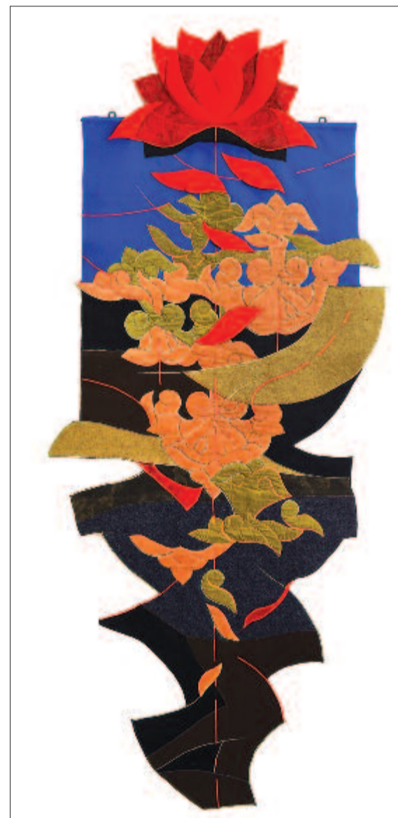
Bandi Kati: Tulipánunk genézise

Be vagyunk oltva. Élünk. De ez milyen élet? Lelkes vagy Lelketlen?