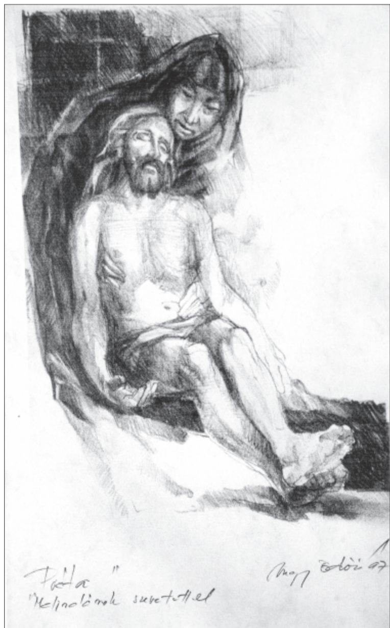
Piéta... Nagy Ödön rajza