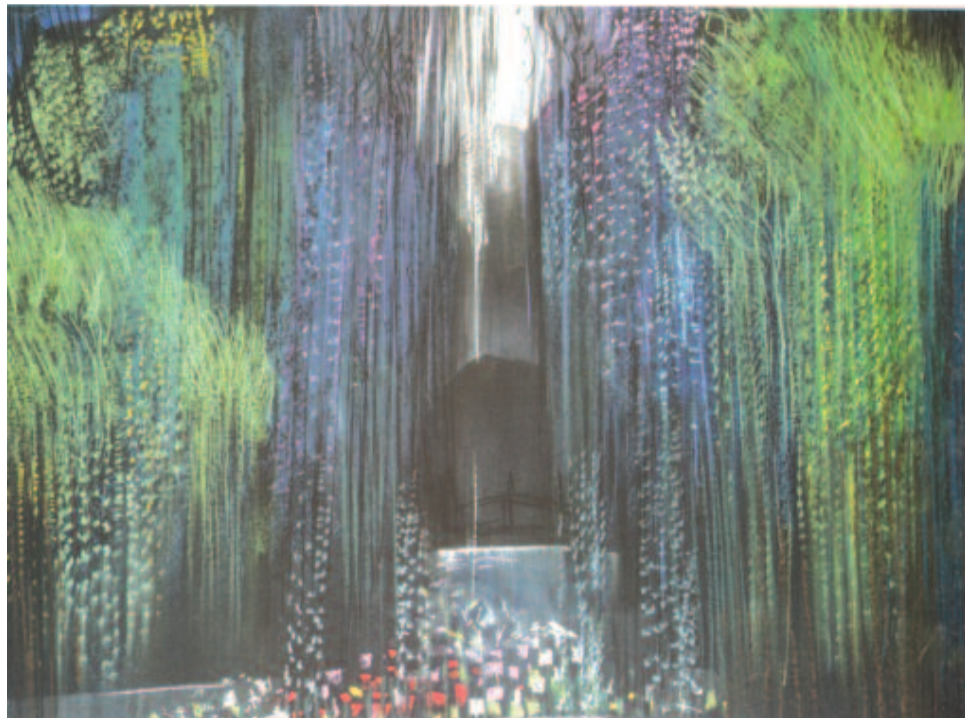
Tavas... Nagy Ödön pasztellje

nem csupán a tehetség, hanem a gondolkodó, a mindig újat akaró alkotó és alkotás többletét. Így készült el több száz munkája, amelyeket kötelességünk számba venni, ahol pedig erre szükség van, a nevével megjelölni, és nem csupán a jelenre, hanem a jövőre szólóan is beépíteni abba az európai fogantatású, erdélyi szellemi-művészeti építménybe, amely nélkül aligha jöhetett volna létre.”