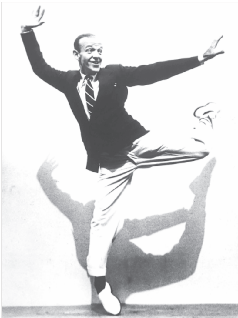
Fred Astaire Munkácsi Márton fotóján

A második világháború előtt rendszeresen tartotta a kapcsolatot Magyarországgal, hazalátogatott, képei gyakran jelentek meg a pesti lapokban, 1937-ben részt vett a Modern Magyar Fényképezők kiállításán.