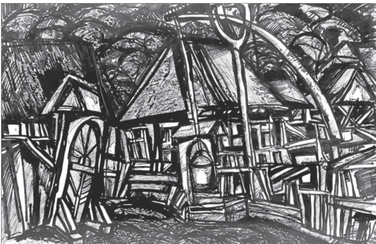
Sz. Kovács Géza: Régi struktúra a BMC marosvásárhelyi kiállításán

*40 éve, 1981. május 27-én hunyt el a költő