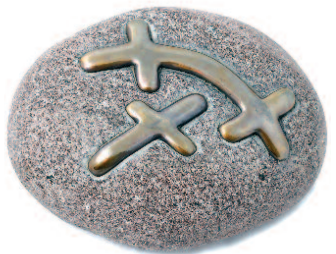
Kiss Levente: Lelet