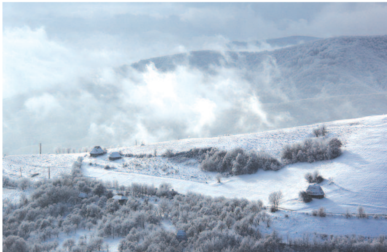
Bálint Zsigmond: Meseország