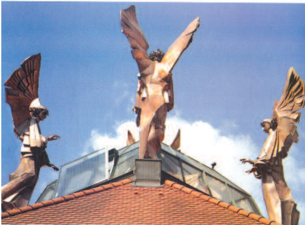
Nagy Ödön angyalai a csíkszeredai Millenniumi templomon

pott ennek megfelelő feladatokat. A csíkszeredai Millenniumi templom angyalszobrai, majd újabb köztéri, monumentális alkotások tanúsítják sokoldalúságát. A kültérről a beltérre is kiterjed a figyelme, a szakrális művészet is megérinti. A nemzeti és az egyetemes értékek egyaránt izgatják. Mind több irányban teljesedik ki alkotóművészete. A pályarajznak ezt tükröző, befejező része a legterjedelmesebb fejezet. Gazdagon kirajzolódik az a művészi attitűd, amit Nagy Ödön temetésén Székedi ekképpen fogalmazott meg: „Soha nem akart ismételni, soha nem akart a közhelyek szintjén maradni. Nem létezett olyan téma a legkisebektől a legnagyobbakig, amelyhez akár egyedül, akár társaival ne adta volna hozzá