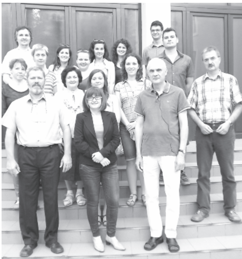
A marosvásárhelyi hallgatók körében