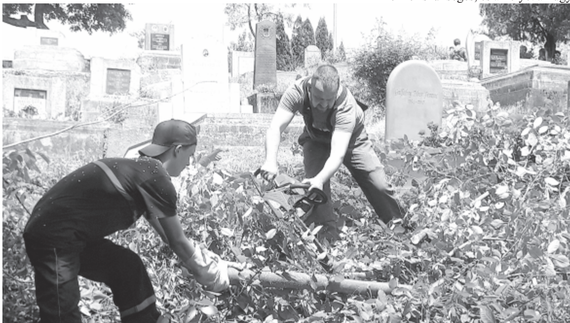
Az ifjúsági önkéntes tűzoltók a felnőttekkel dolgoztak

Csíkfalva községben – a vadadit leszámítva – az önkormányzat kezelésében vannak a temetők, ezért a községgazdálkodási munkacsoport takarítja, kaszálja azokat. Amióta ezt komolyabban kézbe vették, a temetők jóval gondozottabbak, évente kétszer vágják le a fűvet, az elnőtt ágakat. Hogy a terület ne legyen tele különféle hulladékkal – amely egyrészt csúnya, másrészt a karbantartók munkáját akadályozza vagy éppen a testi épségüket veszélyezteti –, az önkormányzat minden temetőben külön hulladékártoló edényt helyezett ki az üvegtárgyak (vázák, mécsesek) begyűjtésére, egyet pedig az újrahasznosítható hulladéknak. A növényi maradványok, koszorúk számára külön tárológödöröket készítettek, ahol el lehet azokat égetni.