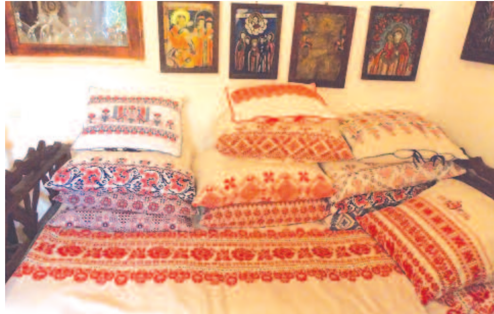
Felső-Maros menti varrottasok

– Úgy kezdődött, hogy édesanyám nagyon sokat kézimunkázott, azok a párnák – mutat a szemben levő ágyra – az ő keze munkáját dicsérik. Hihetetlenül aprólékosan, türelmesen és gyönyörűen varrt. Szabócsaládból származom, mindkét nagyszülőm szabó volt, apai részről Makfalván parasztszabó, anyai részről Kolozsváron úriszabó volt a másik nagyapám. Nálunk a családban nagyanyám már kisgyermek koromban megtanított a Sin-