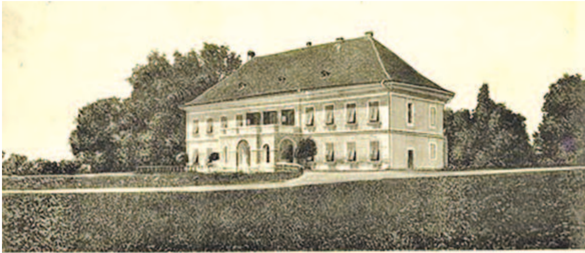
Abafája Br. Huszár kastély

Abafája Szászrégentől hat kilométerre délre, a Maros jobb partján fekszik. Neve az ómagyar Aba személynév és az „erdő” jelentésű fa összetétele. A települést 1332-ben említik először Abafaya néven. Eredetileg valószínűleg a Beng határrészben feküdt, és egy török kori pusztítás után települt át mai helyére. Az abafajai Huszár-kastély a 19. század elején épült, késő barokk, klasszicizáló stílusú épület. Az épület főhomlokzatán háromszögű oromfalat képeztek ki, amelyben eredetileg a család címere állt.