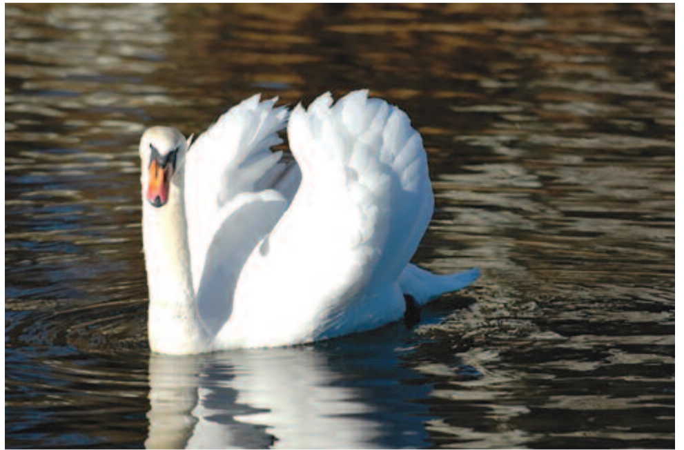
Hófehér kánikulai látomás

Minthogy azonban ez az összeg útasra és felszerelésre nem futotta, fölajánlotta a hiányzó, némi viszontszolgálat fejében a