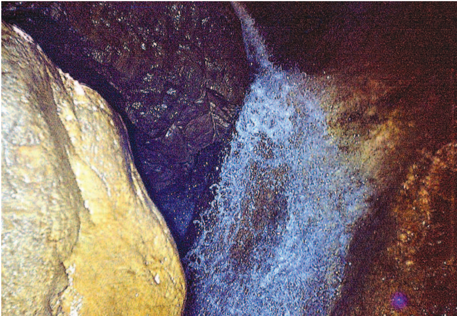
A Nagykálbá-barlang (Sziget-hegység) vizesése

Maradok kiváló tisztelettel. Kelt 2021-ben, a barlangok napján.