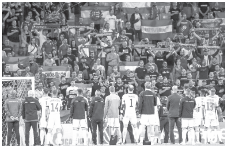
A magyar válogatott tagjai a szurkolók előtt.

Fontos, hogy más szövetséget is büntetnek, de mivel ez nem jut el a magyar közvéleményhez, eltérő megítélés érzetét kelti, illetve a stadionon kívüli szurkolói rendbontásért a rendvédelmi szervek felelősek. Lehet vitatni, hogy ez egy jó vagy igazságos rendszer, de a szabályokat, ahogy a büntetéseket sem én találtam ki, illetve nem tudok megakadályozni egy sajtóorgánomot sem, hogy olyan felvételeket készítsen, ahol egyes magyar szurkolók focisták nem identitását kérdőjelezzik meg. A Fegyelmi Bizottság ezeket is mint bizonyíték fogadja el, tehát ha senki sem ellenőrizi a meccset, de van bizonyíték, lesz büntetés. Ami mindenkinek rossz. A probléma forrása nem én vagyok, én inkább megelőztem volna a bajt a magyar válogatott érdekében.”