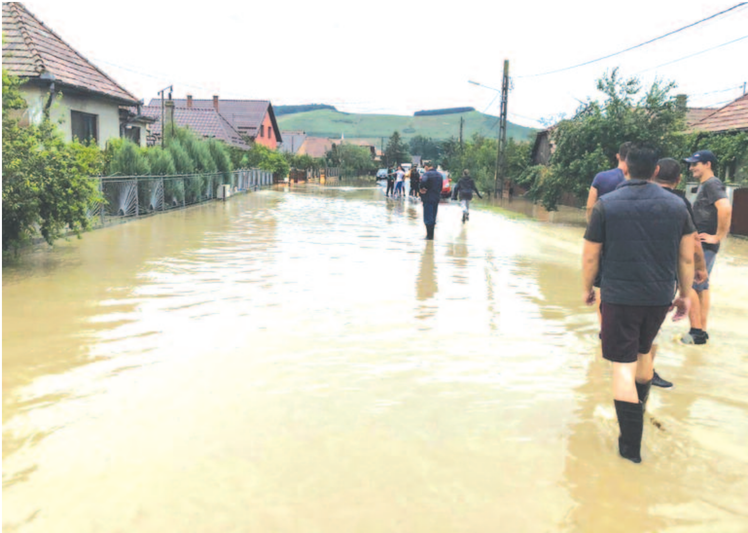
Nagyernye térségében számos háztartást öntött el a víz, de áradásveszély nem áll fenn a megyében