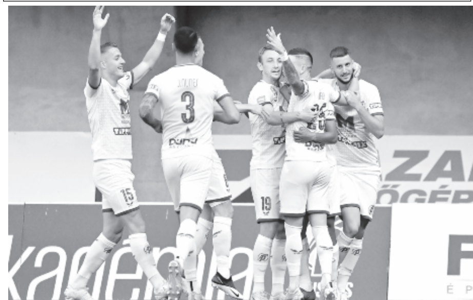
A Puskás Akadémia játékosai örülnek a finn Inter Turku elleni mérkőzésen elért sikernek a Pancho Arénában 2021. július 15-én – a felcsúti alakulat először nyert párharcot az európai kupaporondon.

Az élcsoport: 1. Seps OSK 3, 2. Kolozsvári CFR 3, 3. Dinamo 3, 4. Rapid 3, 5. Medgyes 3, 6. CSU Craiova 3.