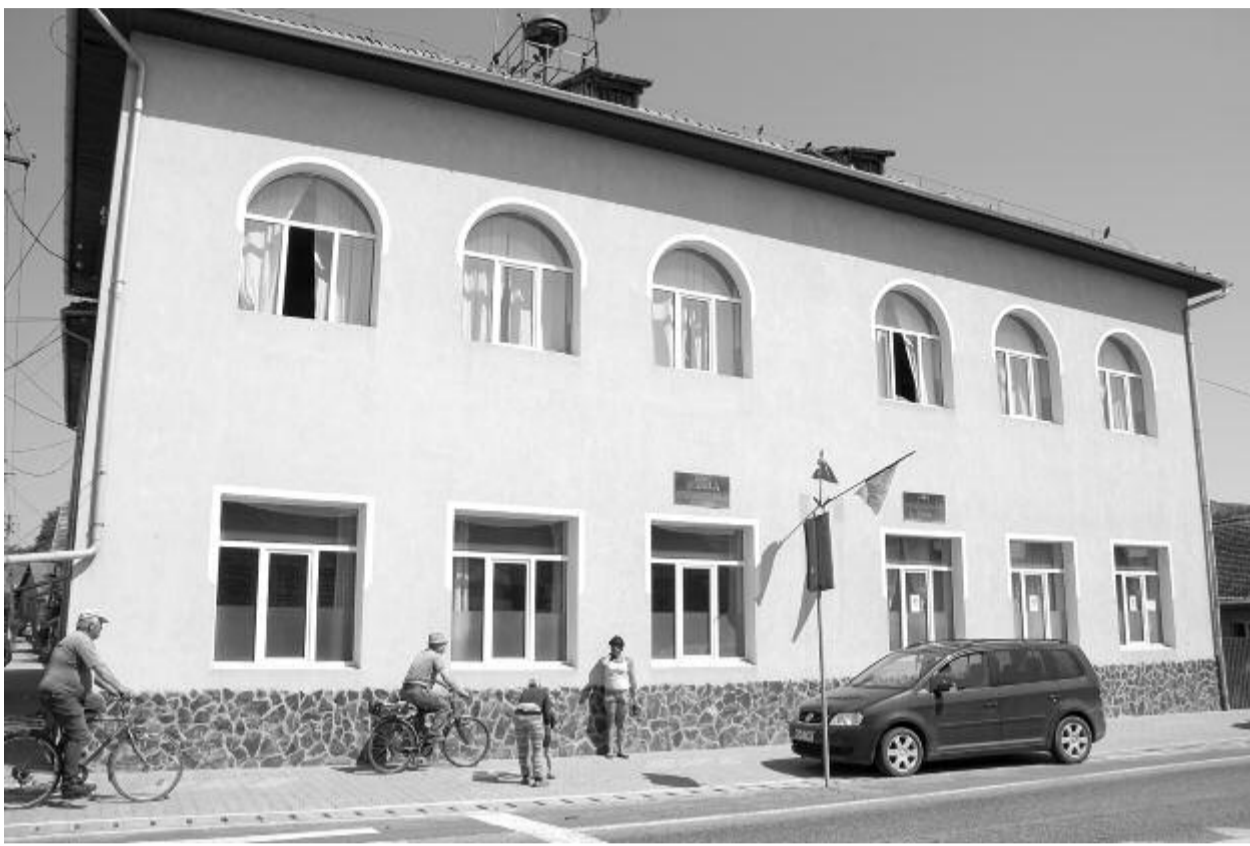
A gyulakutai iskolaközpont