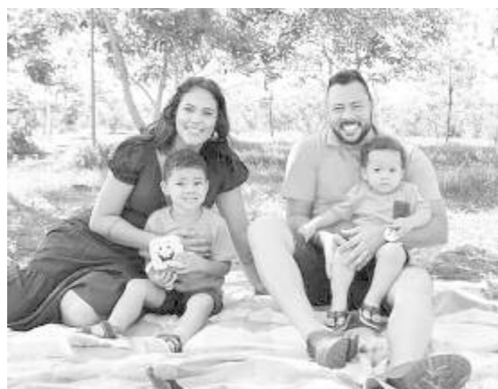
Sao Paulo külvárosában, Barretosban laknak

Nem egyeztünk meg, így bár szeretnék visszatérni a pályára, ezt csak akkor teszem, ha anyagilag megéri a magam és a családom számára.