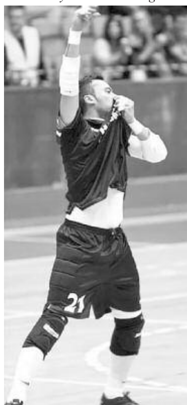
Egy bajnokicím-hódítás emléke

– Most minden energiámmal a családomra és a vállalkozásomra koncentrálok, a teremlabdarúgás megmaradt hobbinak. – Volt-e még ajánlatod az utóbbi években, amióta abbahagytad az aktív sportolást?