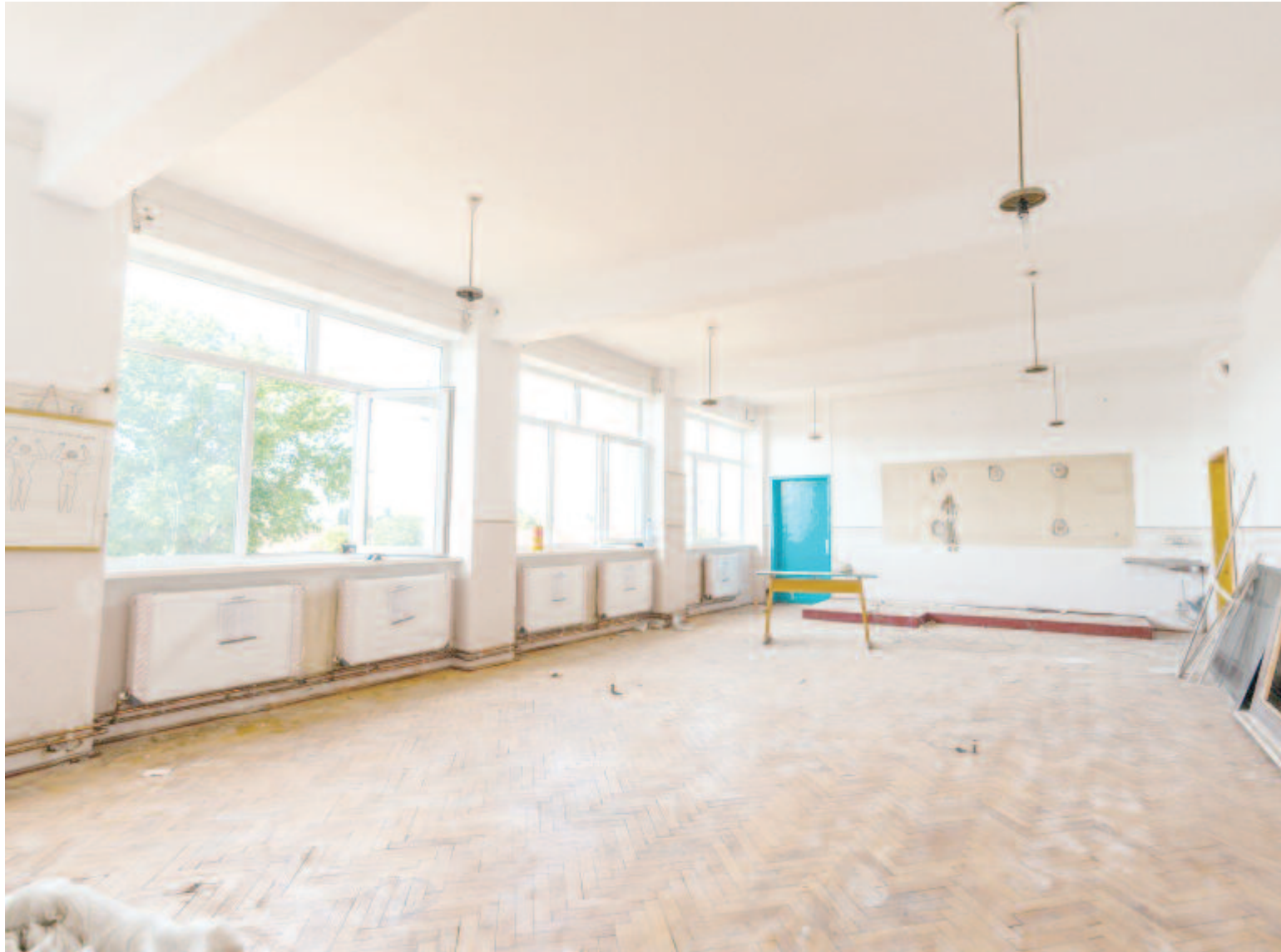
Folyik az iskolák felújítása