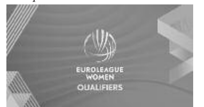
Sportdiplomás siker: Sepsiszentgyörgy és a Sepsis Aréna először adhat otthont Euroliga-selejtezőnek.

* Sepsiszentgyörgyön rendezik a női kosárlabda-Euroliga egyik selejtezőcsoportjának küzdelmeit. A román bajnokságot Sepsis SIC bejelentette, hogy házigazdaként játszhatja szeptember 21-e és 23-a között az 1. csoport mérkőzéseit, amelyeken a magyar Atomerőmű Szekszárd mellett a török Bellona Kayseri lesz az ellenfél. A másik ágon a Bourges Basket, a Valencia Basket és a Famila Baschet Schio küzd majd a kiadó helyért. A két csoport első helyezetteje csatlakozhat az Euroliga mezőnyéhez, a többiek a EuroCup Women sorozatban szerepelhetnek.