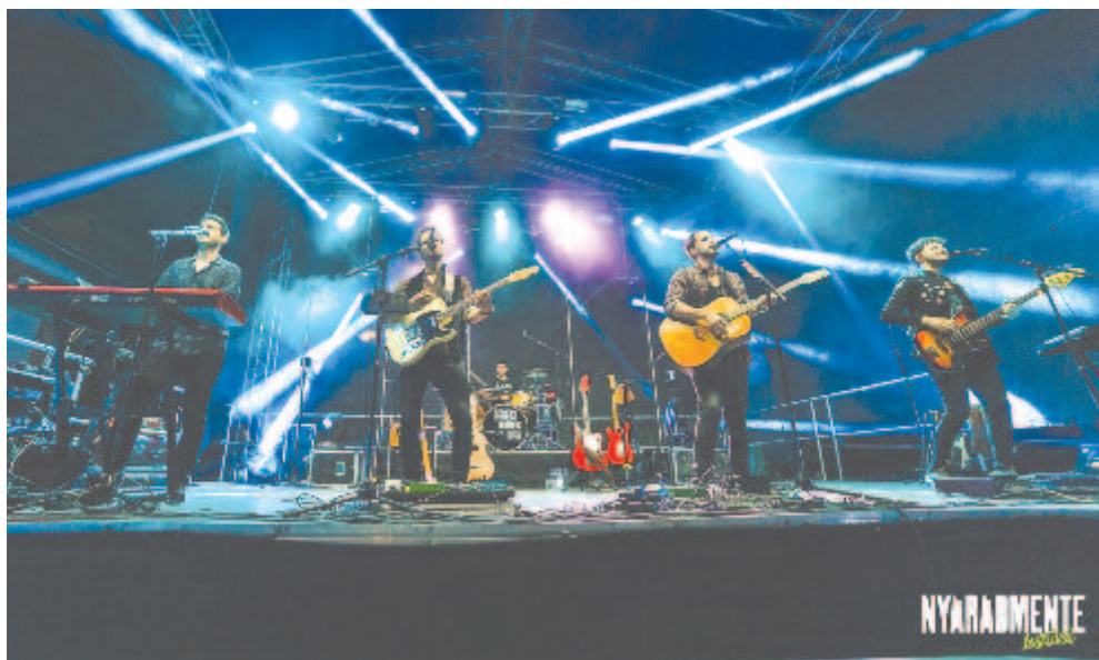
Értékelés, szórakozás és megújuló életérzés – mindezt egyszerre nyújtotta az idei Nyárádmente Fesztivál

Az idei fesztivál a tervezettnél kevesebb pénzbe került – tudtuk meg Szereda polgármesterétől, hiszen próbáltak költségátékonyan szervezni (még az utolsó héten is lemondtak egy fellépőt, mert jelentkezett ingyen koncertező is). A rendezvény fő támogatói voltak: a Maros Megyei Tanács, a Nyárádmente Kistérségi Társulás, Nyárádszereda önkormányzata, a Nyárádszeredai Ifjúsági Szervezet, az RMDSZ, a magyar kormány Nemzetpolitikáért Felelős Államtitkársága és a Bethlen Gábor Alapkezelő Zrt. A fesztivált további 12 helyi és térségbeli vállalkozás támogatta a költségek fedezésében, ugyanakkor hét csatorna volt médiapartnere a fesztiválnak, a szervezői csapatban 13 személy dolgozott heteken át, a hét végén pedig 25 önkéntes és 15 pedagógus is besegített – mindannyiuknak köszönet jár a derekas munkáért.