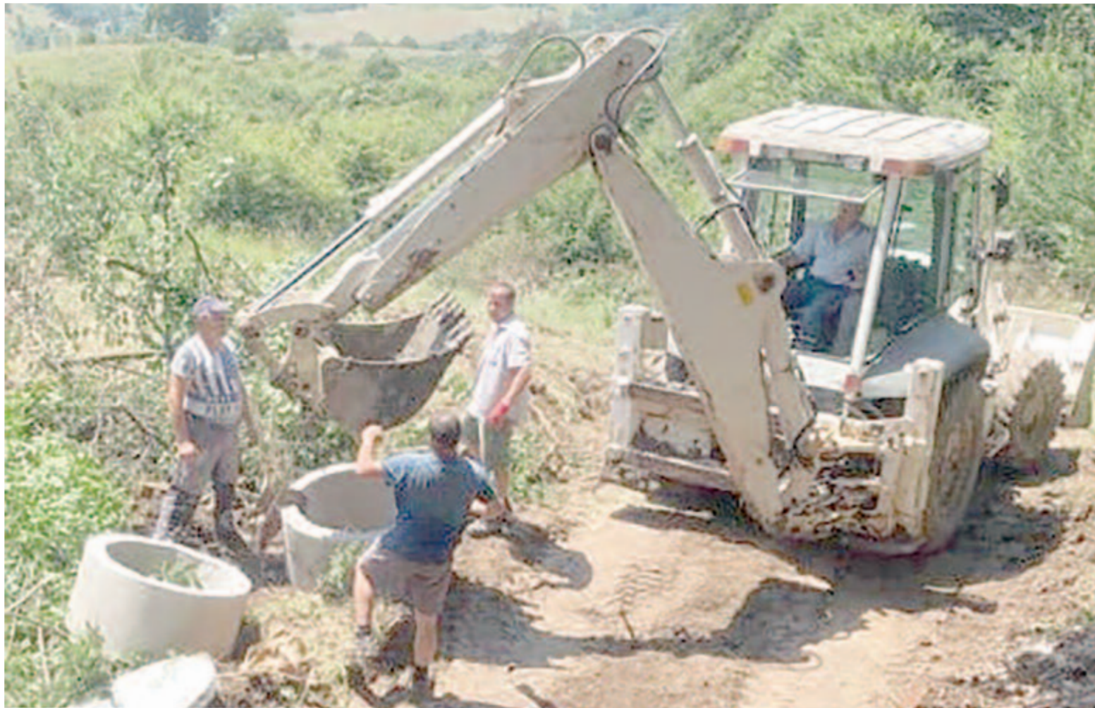
Közös erőfeszítéssel vezette el a vizet a lakosság és az önkormányzat a falu közelébe