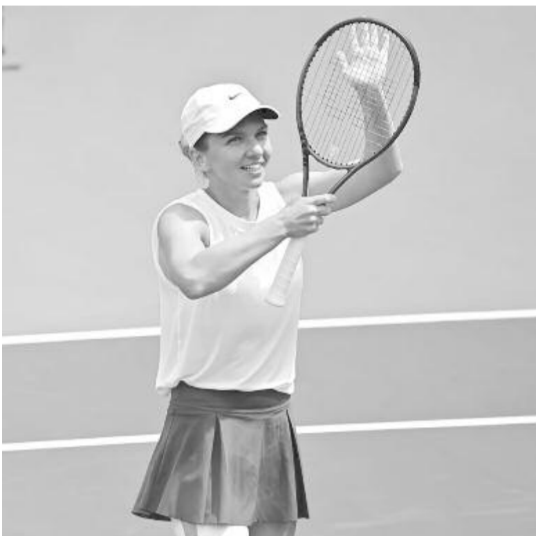
Extra nagy mosoly a hosszabb idő után aratott első győzelemre, írta közösségi oldalán a román teniszező Fotó: Simona Halep (Facebook)

A második játszmában többet hibázott Halep, így a lengyel elhúzott 3:0-ra, majd 4:1-re, amikor a román teniszező orvosi szünetet kért. Ezután megnyert egy játékot, az eső miatt azonban félbeszakították a találkozót, majd a pályára való visz-