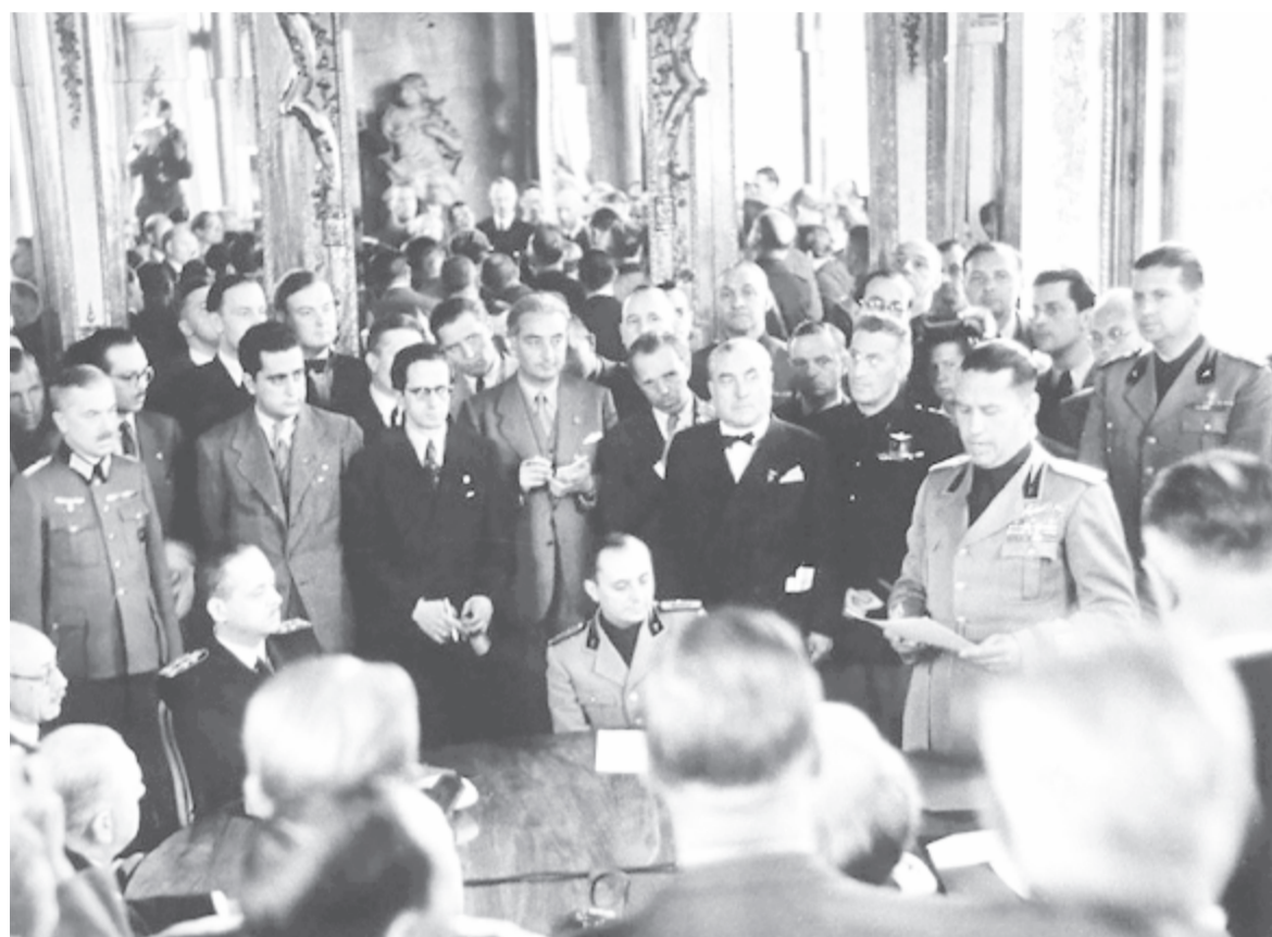
A második bécsi döntés aláírása a bécsi Belvedere-palotában

ter naplójából mindenesetre kiténik, hogy a kérdés mind neki, mind Ribbentropnak elsősorban a román olaj zavartalan szállítása és a nyugalom miatt volt érdekes.