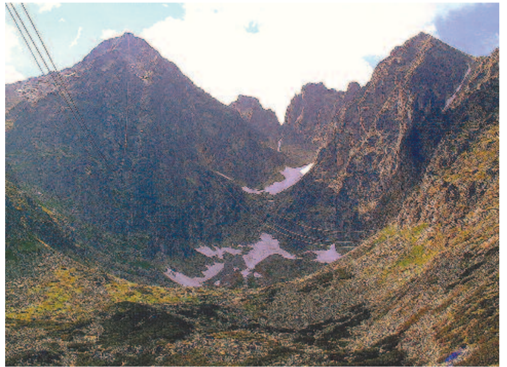
Még ifjúságával tüntet a nyár