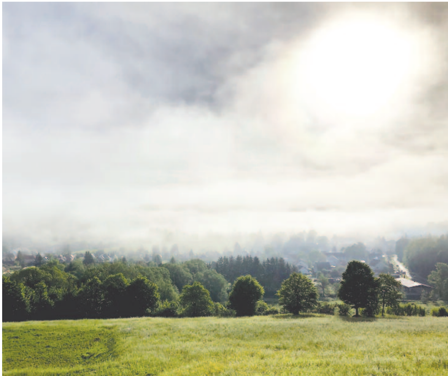
Még titkolják sóhajuk a szelek

Kelt 2021-ben, a meteorológiai ősz harmadik napján