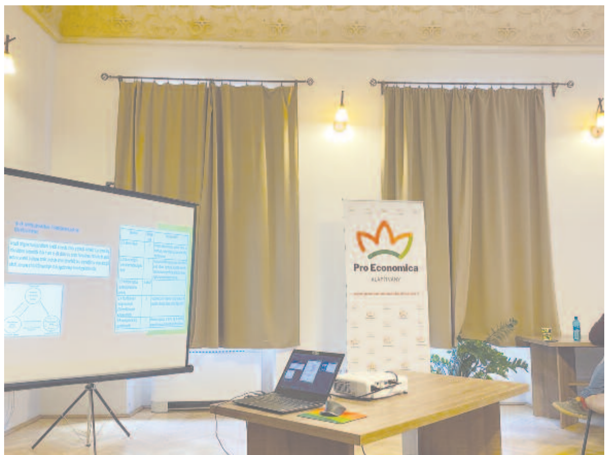
Green Day rendezvény

pessé azokkal szemben, amelyek nem is tudnak erről a törvényről, így nem is fizetnek. Ez azért lehetséges, mert csak azokat ellenőrzik, akik mint fizetők már szereplenek a rendszerben, és elég nehéz felde-ríteni a jelentő- és fizetőköteles cégeket. Ezen kellene változtatni. Erre egy jó módszer lenne a magyarországi példa, ahol termékdíjként szerepel a csomagolóanyag-adó. Ott a gyártókat kötelezik, hogy fizessék meg ezt az adót. Ez a módszer eléggé leegyszerűsíti a dolgokat, hiszen az importőr fizet és minden egyes csomagolóanyag-gyártó, és nem azok, akik csomagolnak. (Egy másik opció az lenne, ha a kereskedelmi kamara vagy a könyvelők tájékoztatnák erről a cégeket.) A csomagolóanyag óriási teher a környezetnek, az össz-hulladékmeny-nyiség 60-80%-áért felelős ez az ágazat.