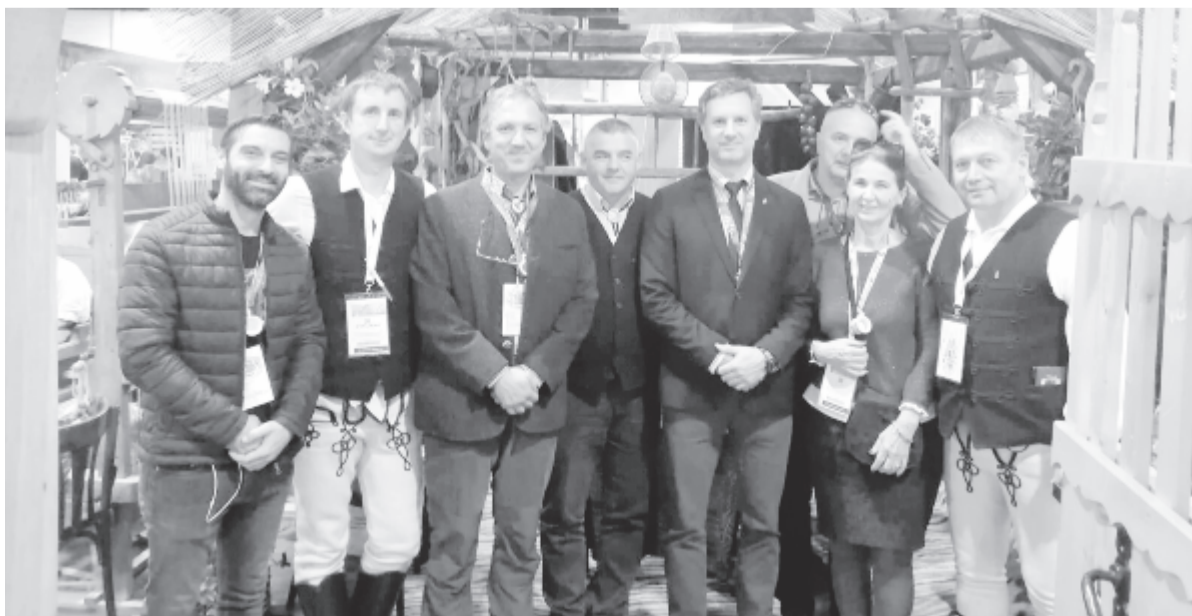
Forrás: az RMGE weboldala

A programra való regisztrálás az összköltségvetés 150%-ának eléréséig lehetséges. (RMDSZ-tájékoztató)