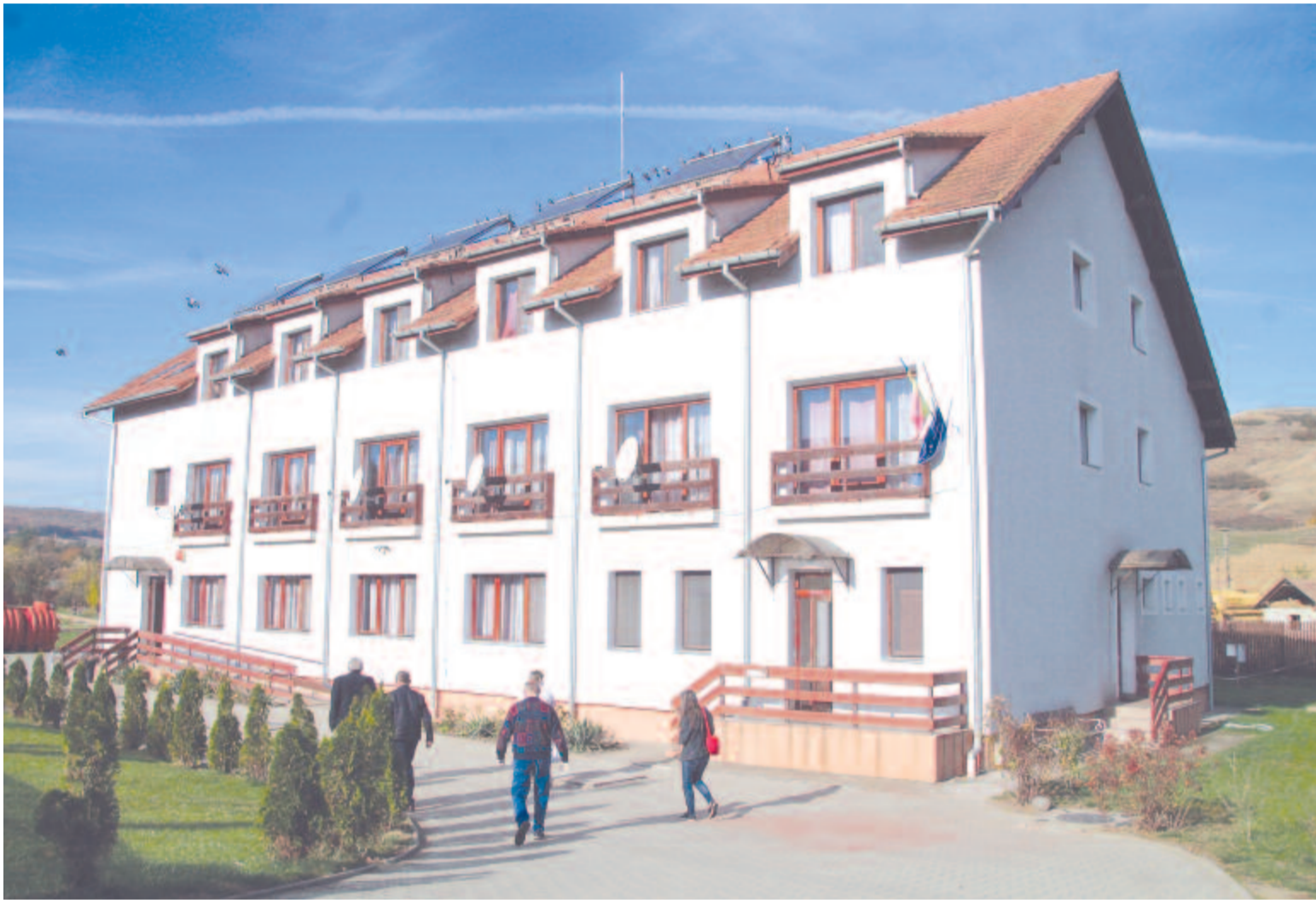
Vendégoldalunk a 6. oldalon

Több mint hat évvel ezelőtt készült el, és fogadta első lakóit a mezőbodoni korszerű idősotthon. Az európai normák szerint, uniós és kormányforrásból felépített ingatlanak az induláskor három-négy lakója volt, a 24 férőhely azonban rövid időn belül betelt, és azóta is telt ház van.