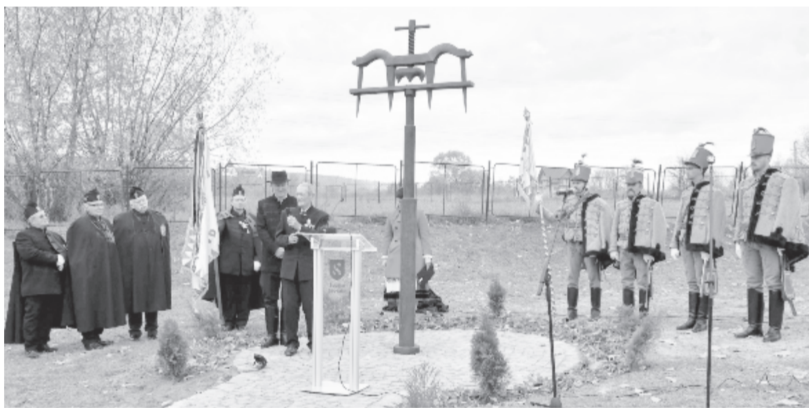
Több évtizedes álom valósult meg a zsarnokság áldozatainak emlékműve felállításával