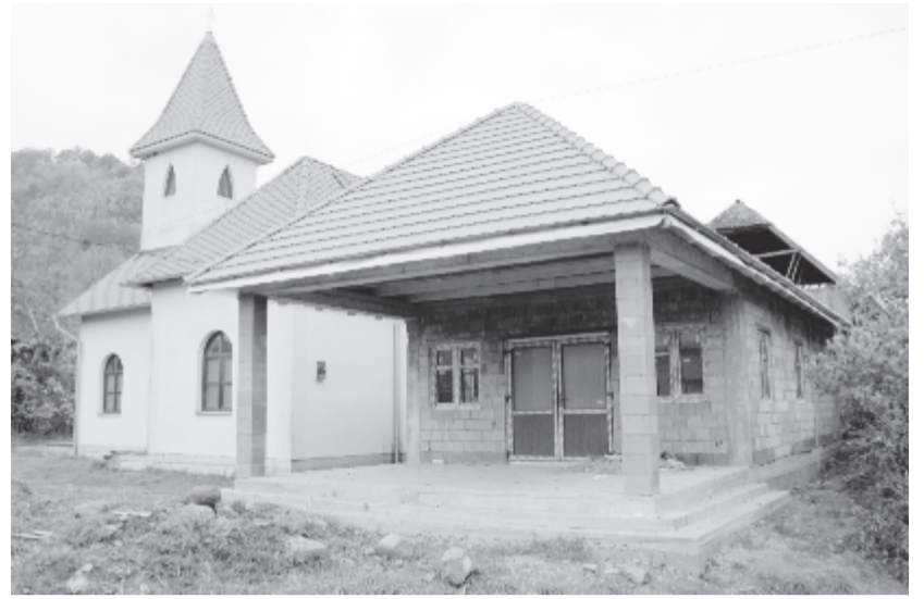
Tető alatt a nyáradmagyarósi ravatalozó