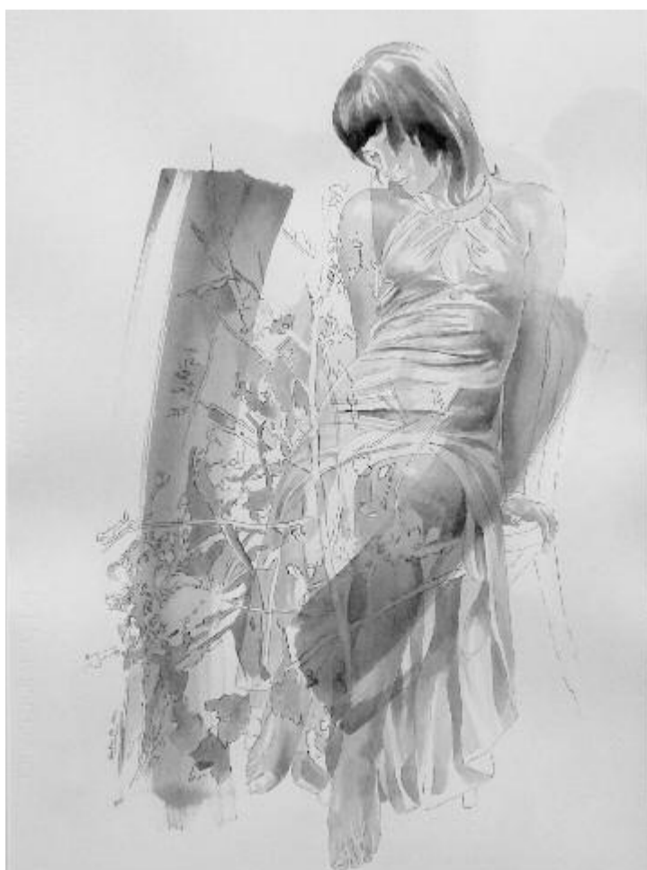
Xantus Géza: Vázlatok III.