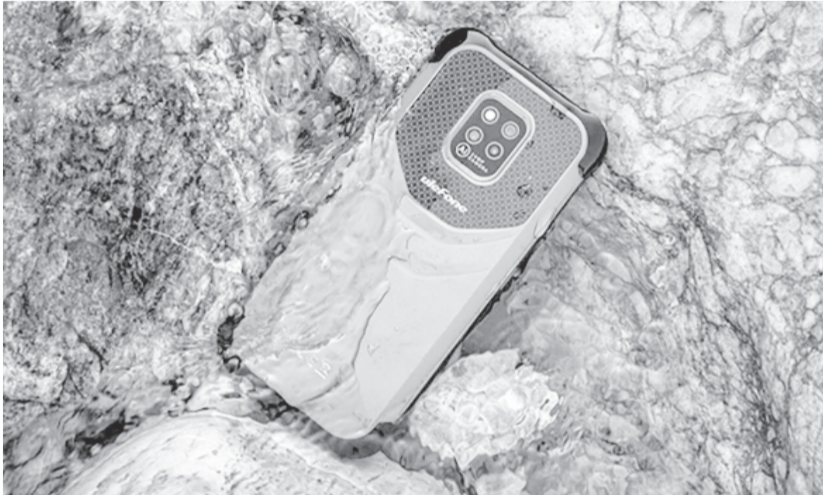
Ulefon Armor 14

nak sem. RAM-ból mindössze négyet kapott, a belső tárhely 64 GB, de ez bővíthető SD-kártyával, illetve egy nyolcmagos processzor dolgozik benne. Átlagfelhasználásra jó, de nem ez lesz a leggyor-