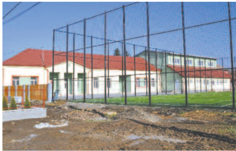
A kerelőszentpáli régi iskola

Mind ezek ellenére egyedüli Maros megyei iskolaként elnyertek egy erasmusos programot, így a 2021–2027 közötti uniós költségvetési ciklusban öt oktatói mobilitási és egy diákcseraprogramot valósíthatnak meg. Erre összesen 150.000 eurót költhetnek. A pályázat alapján lesz egy projektmenedzseri tanfolyam, de az iskolára irányuló programokban az ún. cyber-bulling (számítógépes zaklatás), illetve a szociálisan hátrányos helyzetűek felzárkóztatására irányuló foglalkozásokat szerveznek majd, nyilván e két főtéma kapcsán szervezik meg majd a diákok tapasztalatszerését is.