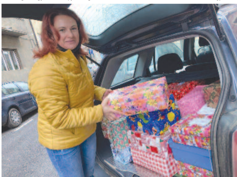
Egy kisbusznyi adomány jutott szombaton a szomszédos megyébe, a vicei otthon lakói számára

Az Örömet szerezni öröm! felhívással indított Maros megyei gyűjtési akció a vártnál jobb eredménnyel zárult, három hét alatt sok embert mozgató meg a kezdeményezés, amelynek az volt a célja, hogy karácsony előtt megteljen néhány polc a szóránymagyar kollégium bentlakói számára. Öröm volt látni, ahogyan a múlt héten lassan megtelt az adományok tárolására kijelölt helyiség. Gyulakuta remekelt, ahol a nőszö-