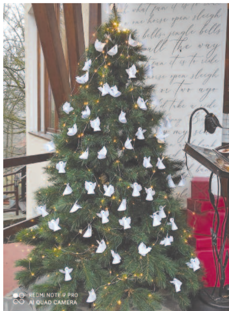
A szovátai Kicsi Gomba angyalkákat indított adománygyűjtésre

A kezdeményezés sikeres volt, öt nap alatt minden kisangyal „elröpült” a fáról, és elhozta egy-egy gyerek rég óhajtott ajándékát.