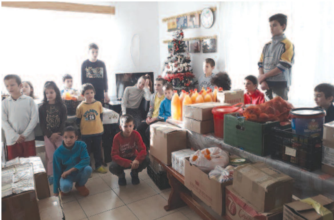
A backamadarasiak adományait az egyesület által támogatott gyerekek kapják meg