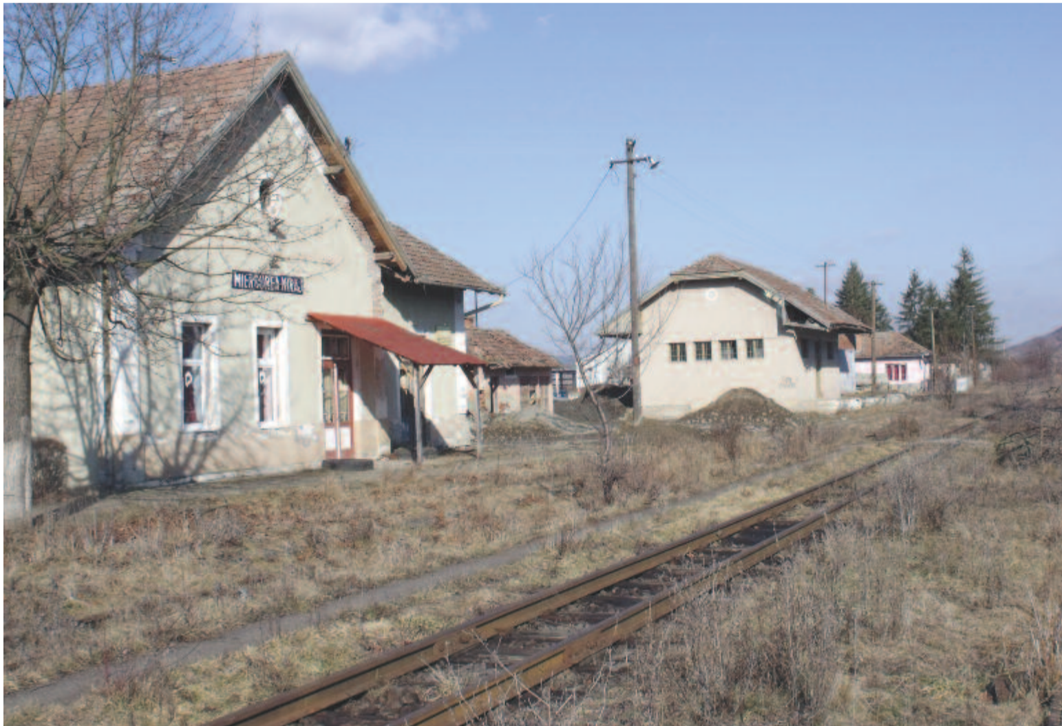
Ki(k)nek érdeke, hogy minden maradjon a régiben, a vasút pedig eltűnjön a gazban?