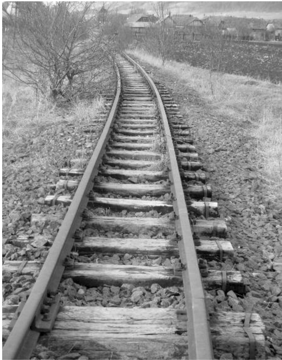
Évekig tartott átvenni a törvényt, az államfő pedig kihirdetés helyett megtámadta

A 2021. szeptember 1. – 2022. augusztus 31. közötti támogatási évben a program támogatói összesen 147 tanulót és 109 egyetemi hallgatót részesítenek ösztöndíjban, vagyis 256 romániai magyar fiatal tanulmányait segítik anyagi és szellemi támogatással egyaránt. (közlemény)