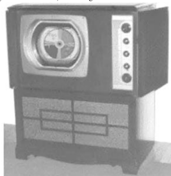
Az első, sorozatban gyártott CBS-Columbia színes-televízió-készülék