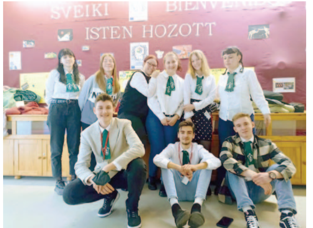
A II. Rákóczi Ferenc Római Katolikus Teológiai Líceum diákjai

Mondhatjuk, hogy az európaiság élményét éltük meg! Nagyon várjuk a program folytatását, amelyre előbb Litvániában kerül sor, majd mi fogadjuk házigazdaként új barátainkat Marosvásárhelyen, s végül Spanyolországban zárul a tevékenységünk.