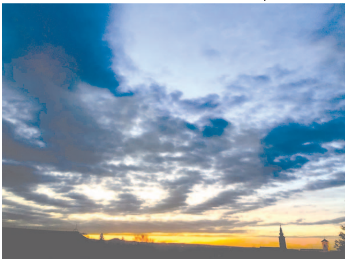
Sebzett madárként a nap zuhanóban

múlt nyarak rézkohó-egétől olvadt érceitől melegszik