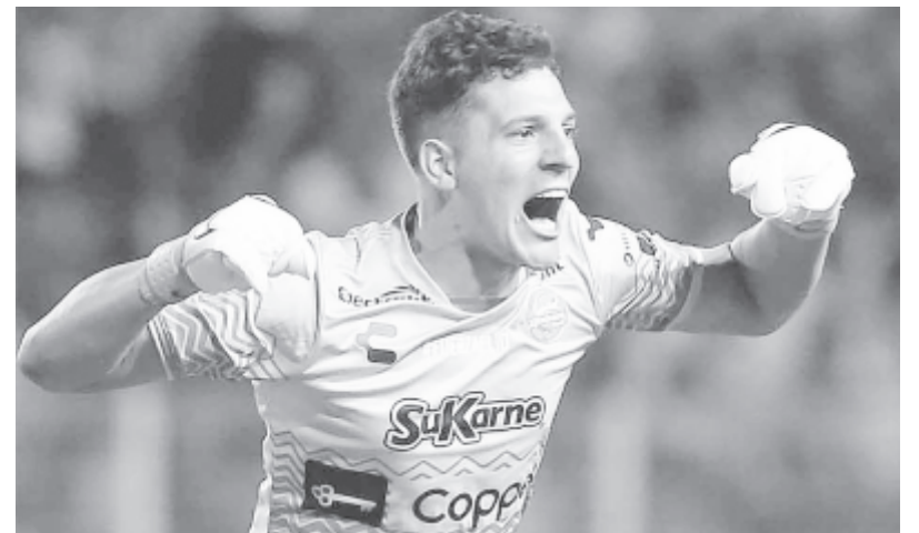
Hét gólt szerzett 2021-ben a világ legeredményesebb futballkapusa, Gaspar Servio.

* A magyar labdarúgó NB I-ben szereplő Debreceni VSC szerződést bontott 37-szeres válogatott labdarúgójával, Németh Krisztiánnal. A futballista szeptember végén, hosszú kihagyás után érkezett a klubhoz, amelyben az őszi idényben hét bajnoki találkozón és egy Magyar Kupa-mérkőzésen lépett pályára. Egy bajnoki, illetve egy kupagólt szerzett, majd december elején a zalaegerszegi meccsen részleges izomszakadást szenvedett. Azóta nem lépett pályára.