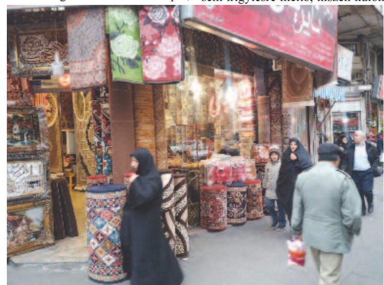
Iráni nők feketében