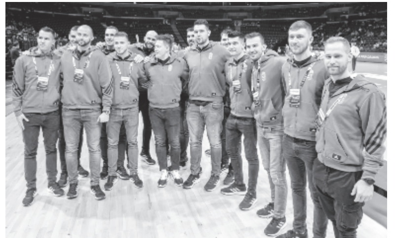
A magyar kézilabda-válogatott tagjai a december 16-ai All-Star gálamérkőzésen az újonnan átadott Budapesti Kézilabda Arénában.