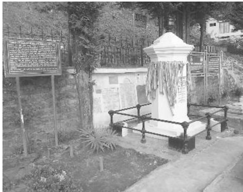
Kőrösi Csoma Sándor síremléke

A végső számvetésben pedig így fogalmaz: „...Zanglára készült, de nem jutottam el, helyette Dardzsilingben kötöttem ki. Gyalogútra indultam, de lett belőle repülés, vonatozás is. A körülmények több alkalommal is erősebbnek bizonyultak nálam. A mérleg másik serpenyőjébe 195 nap utazás került, 4062,63 legyalogolt kilométer, 5.143.762 lépés, na meg rengeteg élmény és tapasztalat. Elkoptattam három pár lábbelit, tíz-egynéhány pár zoknit, elköltöttem pár ezer eurót, (...) megvált tőlem három pár lábujjam körme, szerencsére fájdalommentesen. Sikertörténetről meséltem ebben a könyvben, vagy egy kudarc krónikáját írtam meg? Meggyőződése, értékrendje szerint ki-ki maga döntse ezt el.”