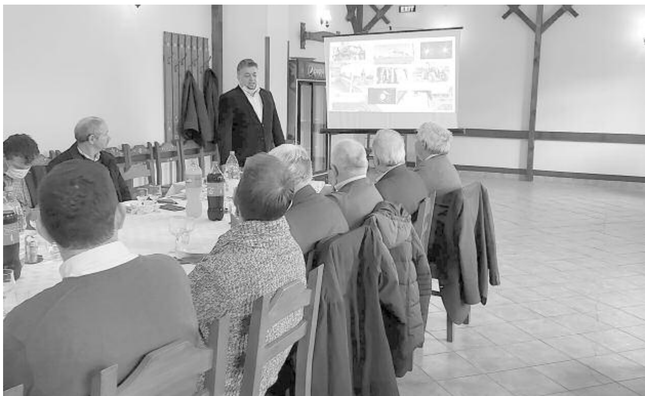
Hatékonyan dolgoztak, sok fejlesztési pénzt lehívtak a kistérségben – hangzott el