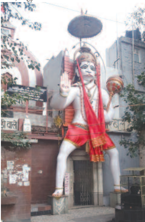
Hindu templom bejárata

Bár december 21-én, a téli napforduló idején úgy érezte, hogy nincs ereje továbbmenni, másnapra elmúlt az érzés, és kellemesen töltötte a karácsonyt Erdélyben is élt ismerősei körében, akik elvitték egy hegyi faluba és a Kaszpi-tó környékére kirándulni. Elképzelése szerint Pakisztánban vagy Afganisztánban keresztül szeretett volna kelet felé tartani, de kifogyott a pénzből. A hangulat sem volt kedvező, inkább szorongást keltő, ugyanis az amerikai katonák drónból kilőtt rakétával végeztek a forradalmi gárda elit egységének parancsnokával, ami a felháborodásból itélve háborúba torkollhatott volna. Emiatt eldöntötte, hogy autóbusszal visszautazik