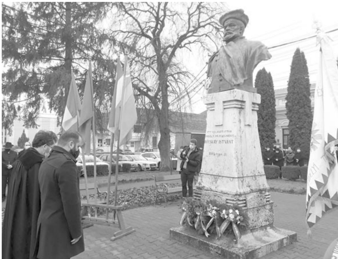
Huszonkilencedik alkalommal tisztelegnek a nagy fejedelem előtt