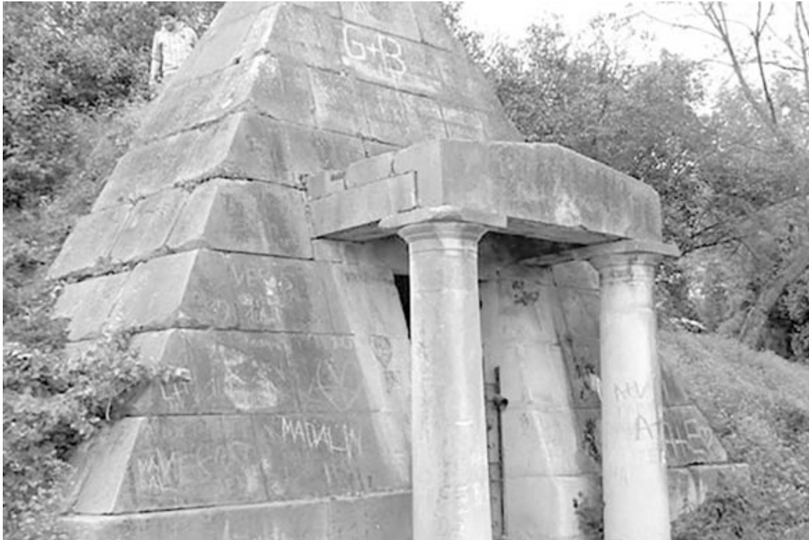
A marossárpataki Teleki-kriptát fel kell újítani, de ehhez szaktanulmány kell