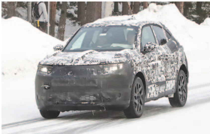
Fiat Uno előlről

Nagyon sok olyan elektromos autó született az utóbbi években, amelyek jónak bizonyultak a valós felhasználás tekintetében is, de nem lehetett őket megvásárolni, mert túl kevés készült belőlük. Aztán szép lassan a piac elkezdett átalakulni, és megérkezett az elektromos éra. Mostanra már szinte minden gyártónak van elektromos autója, és a legnagyobb vállalatok többsége már be is jelentette, hogy 2030 és 2035 között le fogja állítani a belsőégésű motor fejlesztését. Ez persze nem azt jelenti, hogy többé nem fognak benzines vagy dízelmotort gyártani, hanem azt, hogy ezeknek a moto-