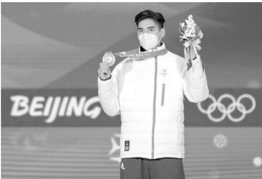
A Magyar Olimpiai Bizottság által közreadott képen a bronzérmes Liu Shaoang a férfi rövidpályás gyorskorcsolyázók 1000 méteres versenyének eredményhirdetésén.

Női szánkóban az első két futamot rendezték. Raluca Strămăturaru már az első menetben nagyot rontott, többször nekivágódott a jégcsatorna oldalának, így csak a 31. időt teljesítette a 35 induló sorában. A második menetben aztán a 27. lett, összetettben pedig egy helyet javítva, feljött a 30. helyre.