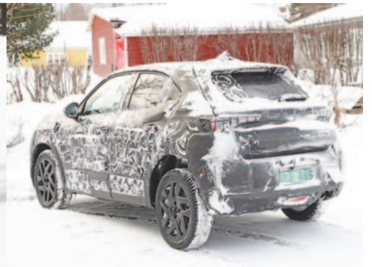
Fiat Uno hátulról