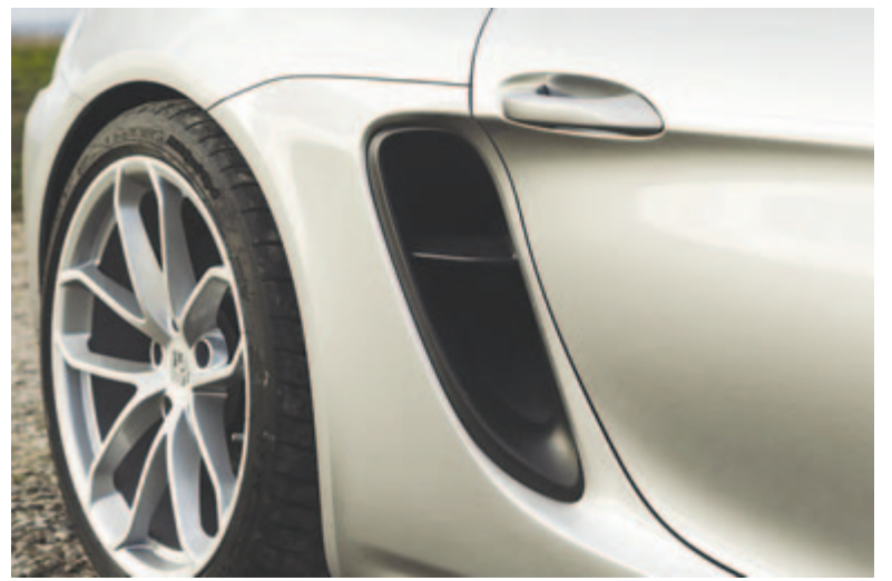
Porsche oldalsó légbemlő

Az új platformmal 33%-os költségcsökkentést és 10%-os fogyasztáscsökkentést szeretnének elérni a jelenleg használt megoldásokkal szemben. Az erre a platformra épülő autók esetében a 400 kilométeres hatótávot célozzák meg.