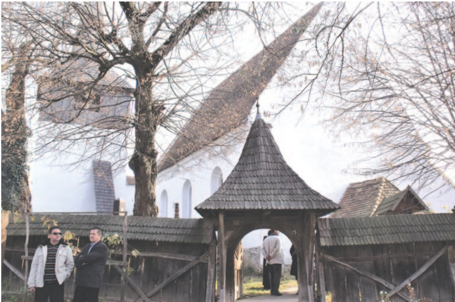
A nyárádszentlászlói templom eredeti kerítésének visszaállításához is szaktanulmány szükséges