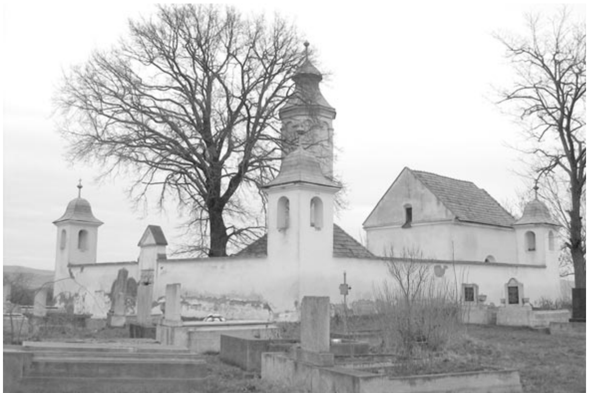
A kerelőszentpáli Teleki-kápolna és kriptá felújítása igen költséges

Az idei alap elosztásakor a polgármesterek egyetértettek abban, hogy támogatni kell a Marosszentgyörgy mellett létesítendő fociakadémia felé vezető út megépítését is, hiszen azt nemcsak a marosszentgyörgyi vagy marosvásárhelyi gyerekek, fiatalok használnák, hanem az egész megye. Ezt a beruházást azonban nem a Szolidaritási Alapból finanszírozzák.