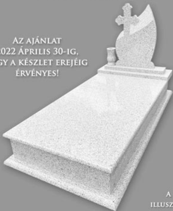
A KÉP ILLUSZTRÁCIÓ!

AZ AJÁNLAT 2022 ÁPRILIS 30-IG, VAGY A KÉSZLET EREJÉIG ÉRVÉNYES!