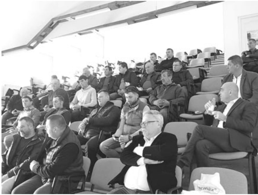
Kéttucatnyi gazda volt kíváncsi – hasznos dolgokat hallottak a szombati előadáson

A bemutatón az előadó többször is hangot adott örömeinek, hogy „felkészült társasággal” találkozott a szombati napon. Az előadás után néhány gazdától