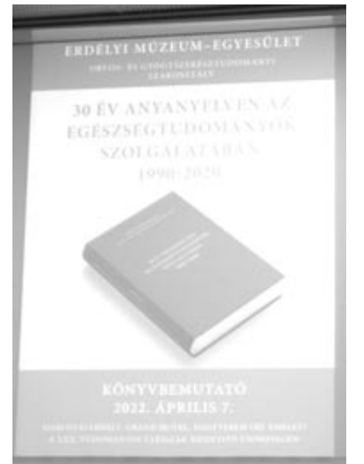
A szakosztály 30 éves története

A rendezvényt megelőzően, április 6-án a Studium HUB közösségi központban tartották nagy érdeklődés, népes részvétel mellett a pályakezdő orvosok és gyógyszerészek fórumát.