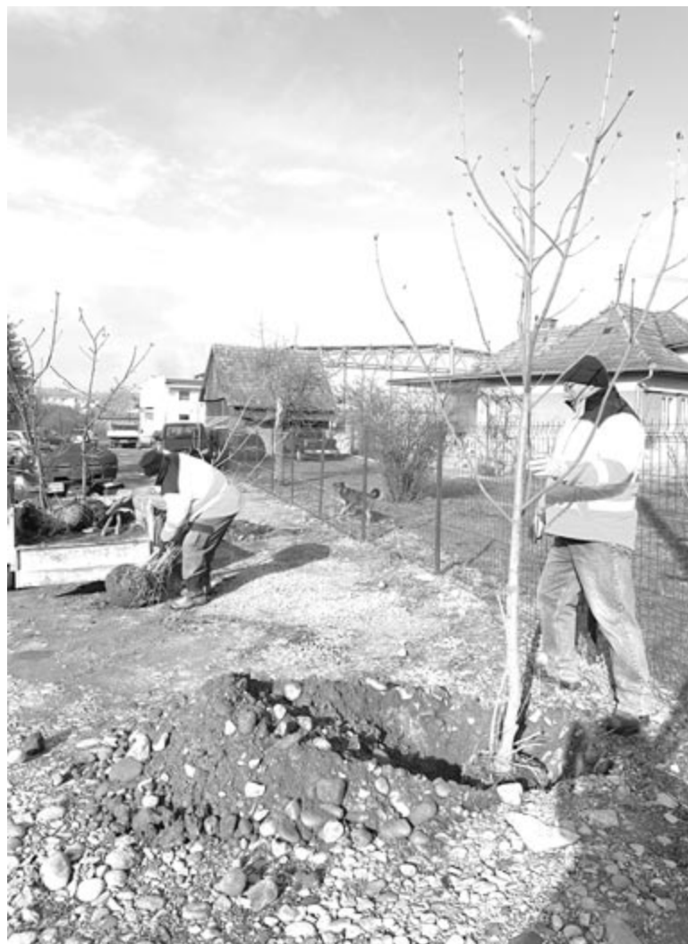
Szovátán a napokban folyik a tavaszi faültetés