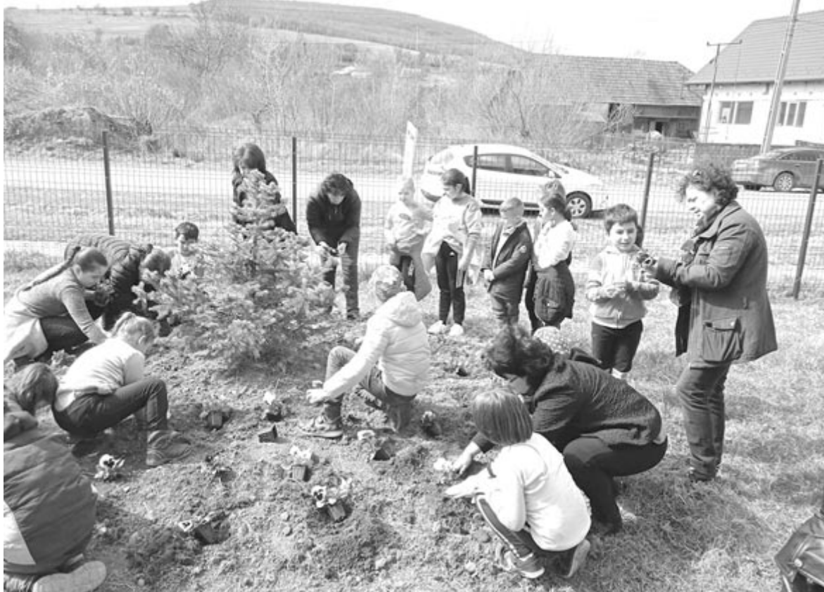
Múlt pénteken főleg Szentháromságon takarítottak, ültettek virágot az iskola diákjai, pedagógusai

Tánczos Barna környezetvédelmi miniszter a múlt héten jelentette be, hogy az általa vezetett tárca elindította a Tiszta Romániát! nevű, egy hónapos környezettudatosító és takarítási kampányt. A mindent elborító hatalmas hulladékmennyiség láttán nem lehet tétlenül ülni, ezért a minisztérium elől kíván járni a jó példával, az alárendeltségéhez tartozó intézmények erdőket, folyópartokat fognak megtakarítani. Ezzel párhuzamosan a Környezetvédelmi Alap révén a tárca az országos takarítási kampányra 20 millió lejt fordít, amelyből az önkormányzatok lakosságárainyosan 3 és 30 ezer lej közötti összegeket hívhat-