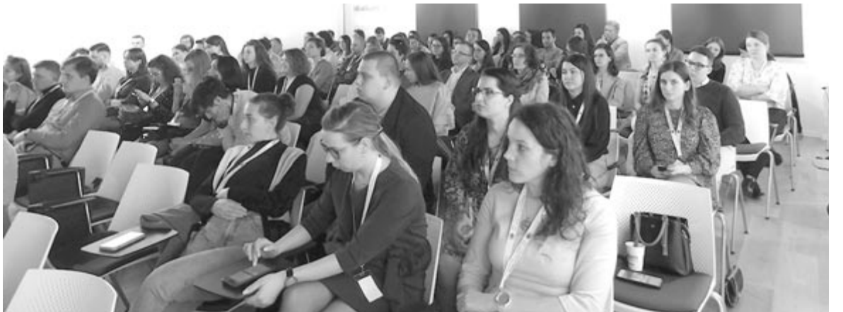
Fiatal orvosok, rezidensek

Szombaton délelőtt megtartották a Keresztény Orvosok Szövetségének évi közgyűlését, majd a Grand Szálló nagytermében zárult a konferencia, amelyen közel félezren vettek részt.