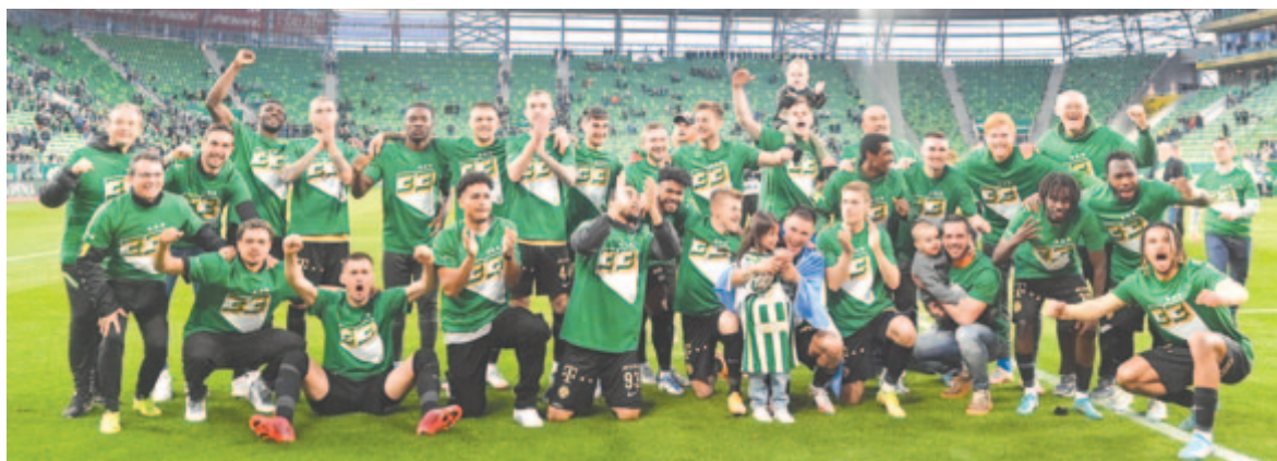
Csoportkép a sorozatban negyedszer bajnok Ferencváros labdarúgócsapatáról, miután 2-1-re legyőzte ősi riválisát, a vendég Újpestet a magyar labdarúgó NB I 29. fordulójában, a Groupama Arénában 2022. április 24-én.