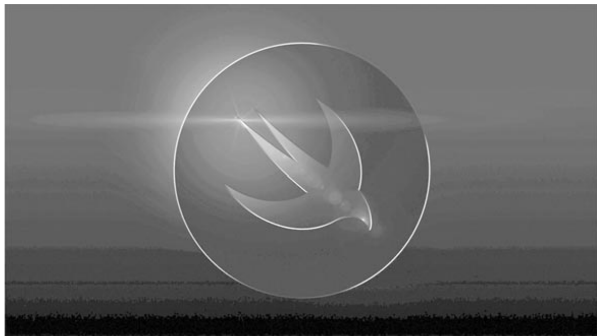
WWDC 2022 logó

Nem mellesleg a beszámoló alapján az Octo vírus arra is képes, hogy átvegye az irányítást a felhasználó mobilja felett, illetve rögzítse, hogy mi történik a kijelzőn, valamint, hogy megfigyelje, hogy adott helyzetben milyen karaktereket gépel be a felhasználó. A ThreatFabric szakemberei szerint a fejlesztők célja az volt, hogy a vírus már a felhasználó beavatkozása nélkül is képes legyen a tranzakciók elindítására.