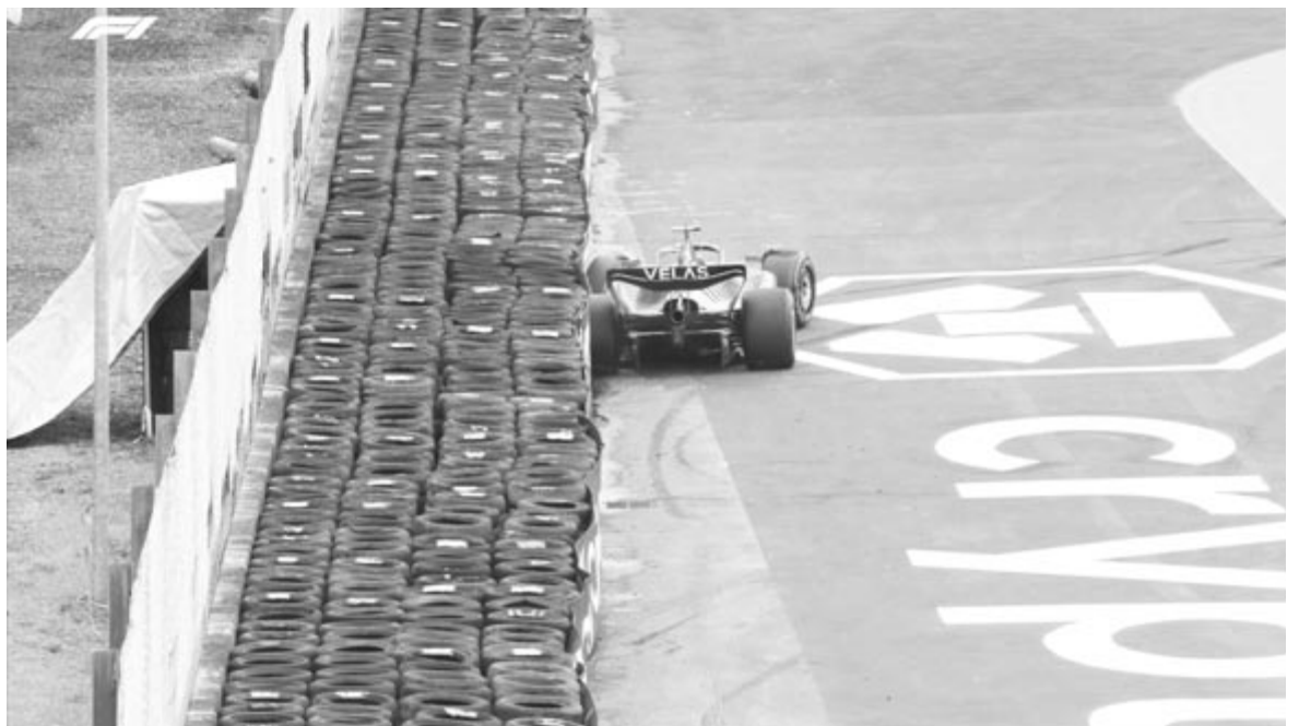
Az 54. körben a harmadik helyen haladó és a vb-pontversenyben éllóvas Leclerc hibázott, megpörgött és a gumifalba csapódott

* csapatok: 1. Ferrari 124 pont, 2. Red Bull 113, 3. Mercedes 77, 4. McLaren 46, 5. Alfa Romeo 25, 6. Alpine 22, 7. Alpha Tauri 16, 8. Haas 15, 9. Aston Martin 5, 10. Williams 1 p.