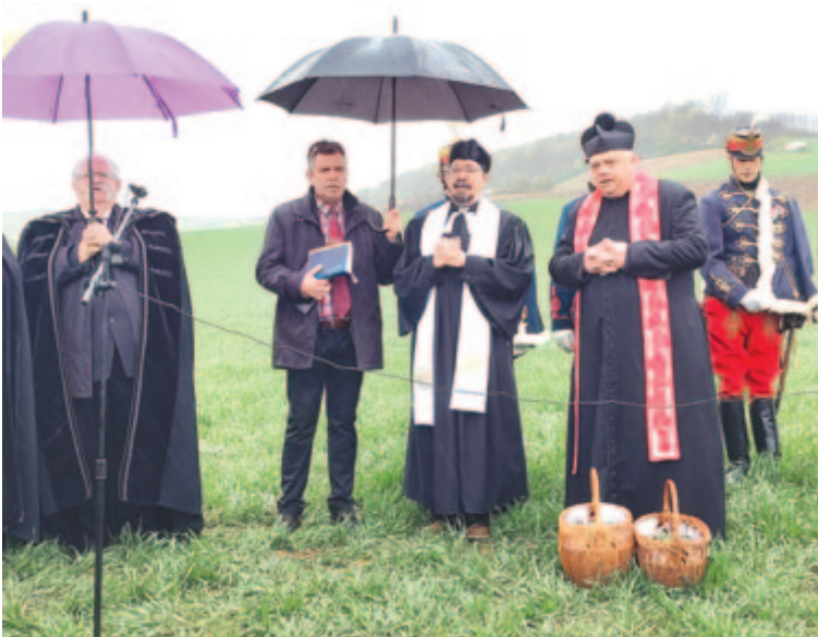
A határban a bő termésért imádkoztak, majd megáldották a vetést és a munkálkodókat

A búzaszentelés a határ, a búza-földek megáldását jelenti, a népszokás szerint ennek ideje Szent Márk napja (április 25.) vagy egy ehhez közel eső nap. Az országos búzaszentelő Magyarországon első alkalommal 2001-ben rendezték meg Esztergomban, 2019-től a MAGOSZ és a NAK közös szervezésében Kárpát-medencei rendezvényé bővült, végül látva az elszakított országrészek magyarságát.