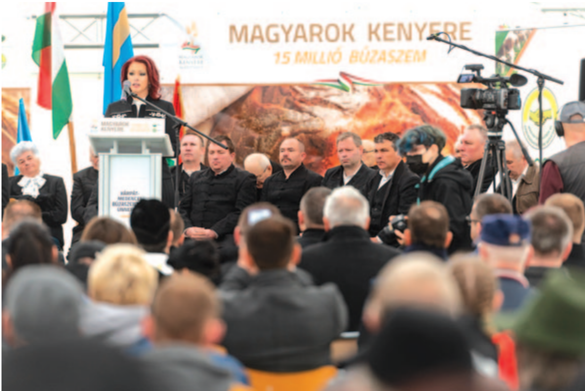
Az anyaországi és hazai agrárszektor és politikum képviselői is jelen voltak a rendezvényen

„A búzaszentelés évszázados, szent rítusa hozott össze bennünket” – állapította meg a magyar Nemzeti Agrárgazdasági Kamara (NAK) általános agrárgazdasági ügyekért felelős országos alelnöke. A Magyarok kenyere program mint nagyszabású jótékonykezdeményezés azt a célt szolgálja, hogy ne legyen olyan magyar asztal a Kárpát-medencében, amelyre ne jutna kenyér. A program látszólag az adományozásról szól, de jelentő-