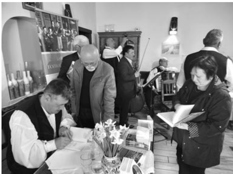
A 2008-ban megjelent kötet második, kissé átdolgozott kiadását vehették kezükbe az érdeklődők

munka nem a bányákban folyik, hanem az imádság a legnehezebb munka, mert imádkozni csak őszintén lehet. Akik úgy tudnak imádkozni a mi népünkért, mint akik a népért élnek, azoknak a szívük dobbanásában benne van az, hogy vigyázni kell az Istentől kapott talentumokra. „Ez a föld a miénk, ha százszor is elveszik tőlünk, és otthonainkban lehet, kell, kötelező énekelnünk, mert énekeink, himnuszaink által tartjuk meg magunkat, és dalaink által tudunk közösséget teremteni” – fejegette a lelkipásztor.