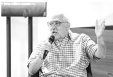
Dr. Bokros Lajos

Romániában ez a hatás az infláció. A vártnál magasabb inflációhoz az is hozzájárult, hogy az egyes kormányok túlságosan jelentős kiadásokat hajtottak végre, illetve a jegybankok túl sok monetáris enyhítést alkalmaztak. Ez a keresleti oldal. Azonban a kínálati oldalon az a jelenség mutatkozik, hogy bizonyos kínálati láncok világgazdasági szinten teljesen összetörték. Hiány van félvezetőkből, az előrejelzések szerint pedig hamarosan élelmiszerhiánnyal is kell számolni. Ezek a tényezők pedig tovább fokozzák az inflációt. Ilyenkor olyan gazdaságpolitikát kell alkalmazni, amely megoldja ezeket a kínálati problémákat, amit nem lehet belföldön megoldani, azt EU-n belüli összefogással kellene. Ilyen lenne például az, ha végre egységes energiapolitikája lenne az