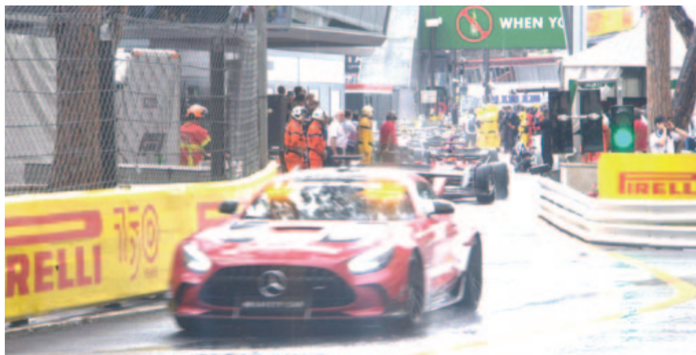
Biztonsági autó vezette fel a mezőnyt az állórajt helyett, de két kör után visszavezényeltek mindenkit a boksztucába, mert a látási körülmények nem voltak megfelelőek.

* pole-pozíció : Charles Leclerc (monacói, Ferrari)