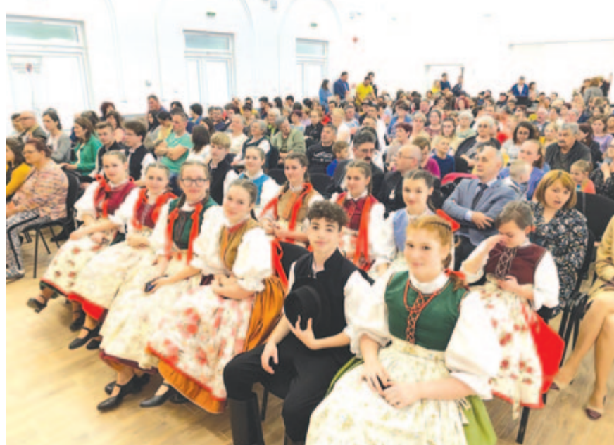
A gyulakutai kultúrház avatóünnepsége

van ellátva, új ravatalozója van, minden utcáját aszfaltréteg fedi. Kiterjesztettük a járdahálózatot, rengeteg aszfaltozott parkolót alakítottunk ki, parkosítottunk. Nemrég adtuk át az uniós alapokból 2.300.000 lejes értékben teljesen felújított, impozáns művelődési otthont. A tanügyi intézményeink közül községi szinten 12-t újítottunk fel, építettünk egy vadonatúj iskolát és óvodát. Jelenleg felújítás alatt áll a gyulakuti 1-es és 2-es számú iskola és az azokhoz csatlakozó tornaterem. Ezt is uniós pénzalapokból végezzük, a felújítást és csúcstechnológiával való felszerelést is magába foglaló projekt ö s s z é r t é k e 6.300.000 lejre rúg. A tornaterem már megkapta a sátoertőt.