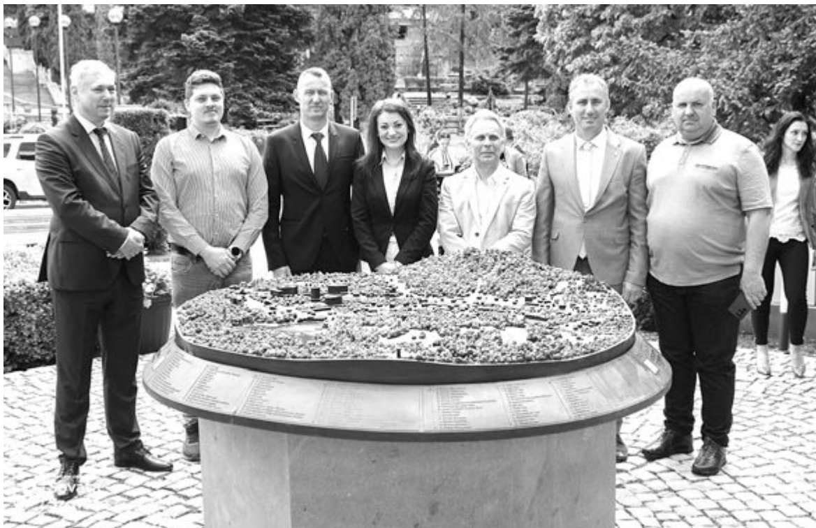
Az ország legnagyobb városmakettjét avatták fel múlt csütörtökön Szováta