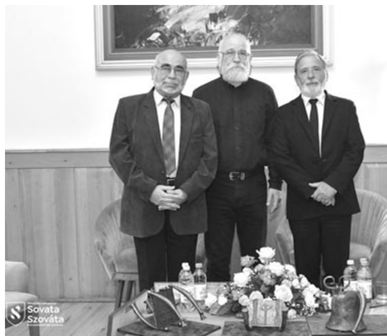
Három személy kapta meg idén a díszpolgári címet