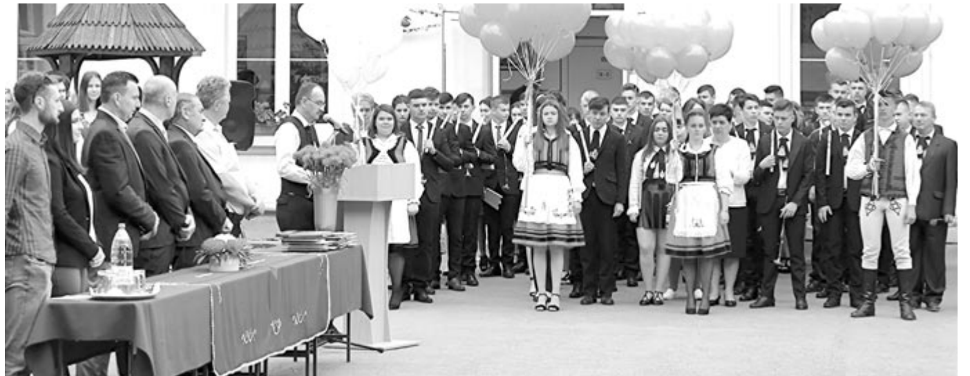
A léggömbök úgy szállnak el az égen, ahogyan a végzős diákok szétszélednek a világban

A természettudomány – intenzív angol és filológia – intenzív német profilú osztályokban 36, az automechanika, illetve kereskedelmi szakosztályokban 43 diák fejezte be az idei tanévet Nyárádszerezében.