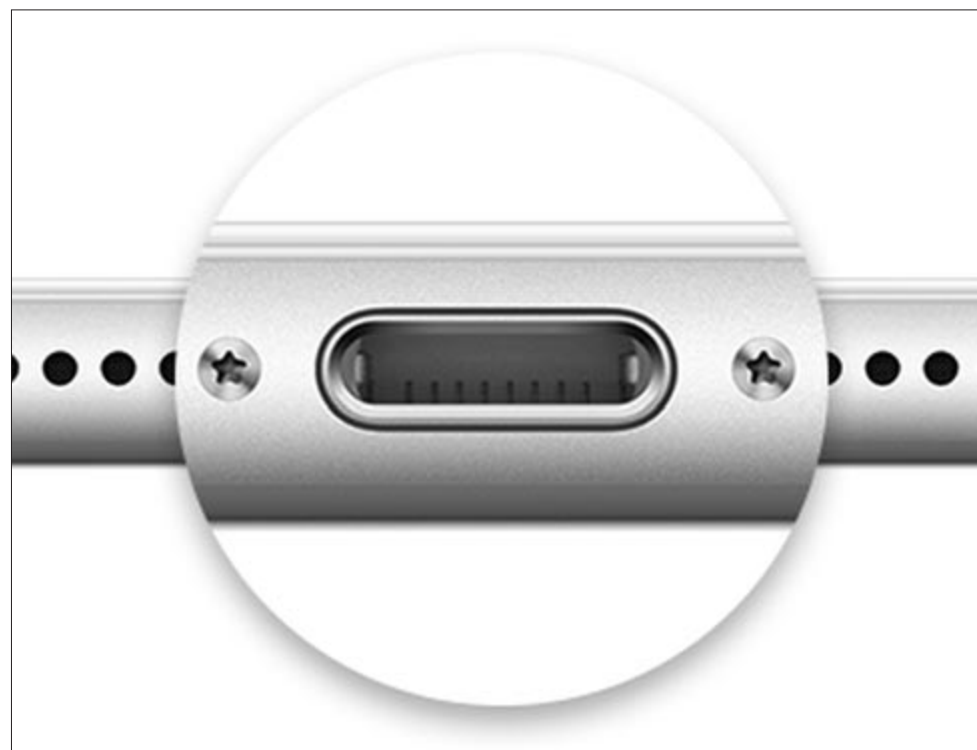
USB C csatlakozóval szerelt iPhone-konceptió

Azonban nemcsak az iPhone kábelei esetében volt külön az Apple, hanem a laptopok esetében is. Egészen 2016-ig ott is egy külön csatlakozót használtak, ami a MagSafe nevet viselte. Ezt váltotta 6 évvel ezelőtt az USB Type C. Tehát elmondható, hogy a laptopokkal napirendre kerültek, ott rendben van a csatlakozó. Azonban a laptopoknál a váltás egy másik kényelmetlen szituációt idézett elő, mégpedig, hogy akkoriban még az iPhone-okhoz USB A (klasszikus USB) – Lightning kábelt adtak. Azaz a méregdrága telefonunkat csak egy adapterrel tudtuk hozzácsatlakoztatni a még drágább laptopunk-