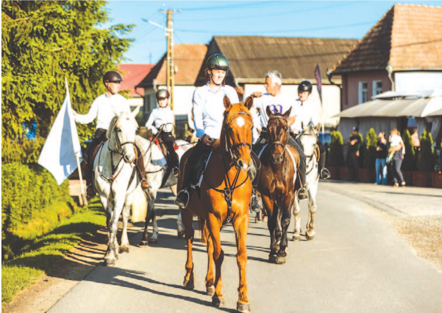
Hétfőn este vették át az imaszalagokat Harasztkeréken, szombaton érkeznek fel a lovasok a Nyeregbe