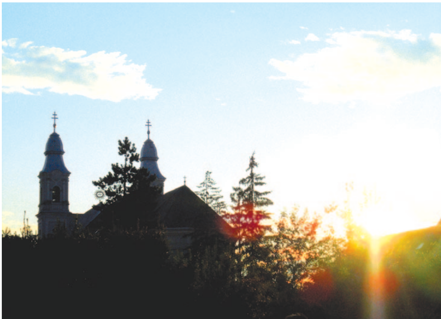
A csíksomlyói basilica minor, júniusi nap leszentültében

Kelt 2022. június 3-án, egy nap híján 102 évvel Trianon után