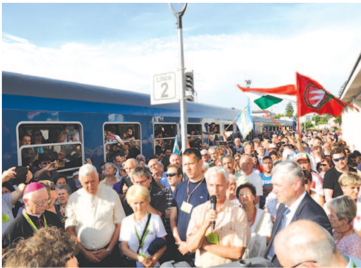
Marosvásárhelyen nagy szeretettel fogadták a zarándokvonatot