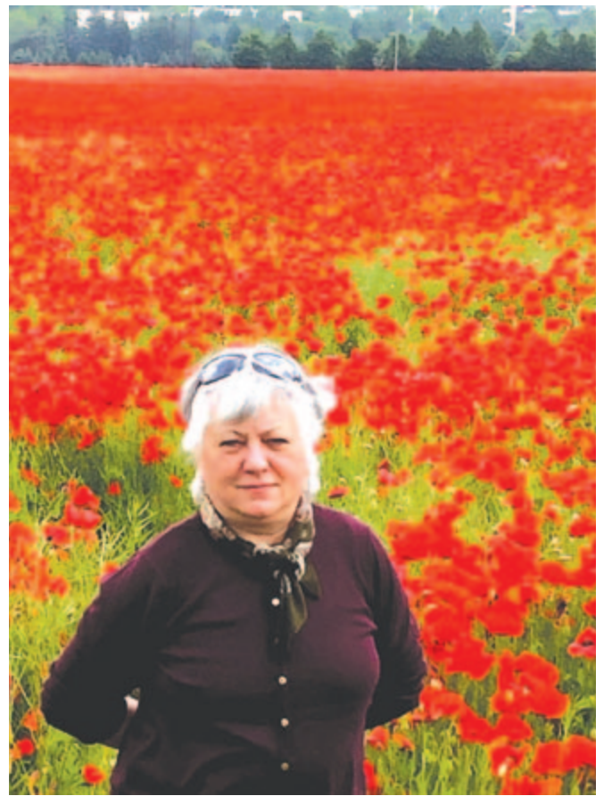
A nyár ragyog, lobog, pipacsosok a rétek

A kezdeti idegenkedésen túllépve a férfi Izmael tanítványául szegődik, aki nem tanít neki semmi új ténnyt – ellenben a mindenki által ismert biológiai, ökológiai, történelmi, sőt bibliai tényeket teljesen szokatlan elrendezésben gondolja és gondoltatja újra. A „tanítás” során nem csak rámutat arra, hogy mi