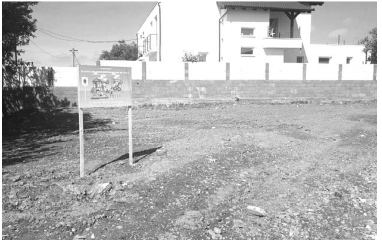
A helyszín és az avatási időpont ki van jelölve – idén elkezdik az építést