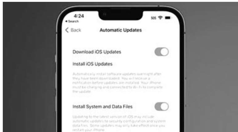
Az újítás a menüben