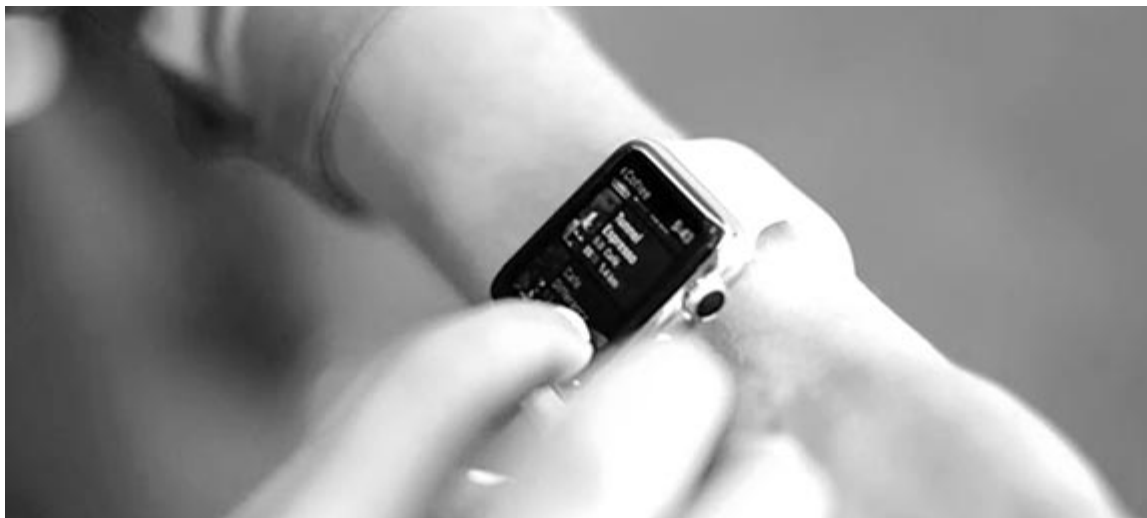
Apple Watch egészségügyi alkalmazás

Nem mellesleg az Apple Watch egyik célja az lenne, hogy az egészségügyi jelekre figyeljen. A fent felsoroltak mellett lehet hallani arról pletykákat, hogy a későbbiekben a vérucorszint megállapítására, valamint pontos vérnyomásmérésre is alkalmas lesz az eszköz.