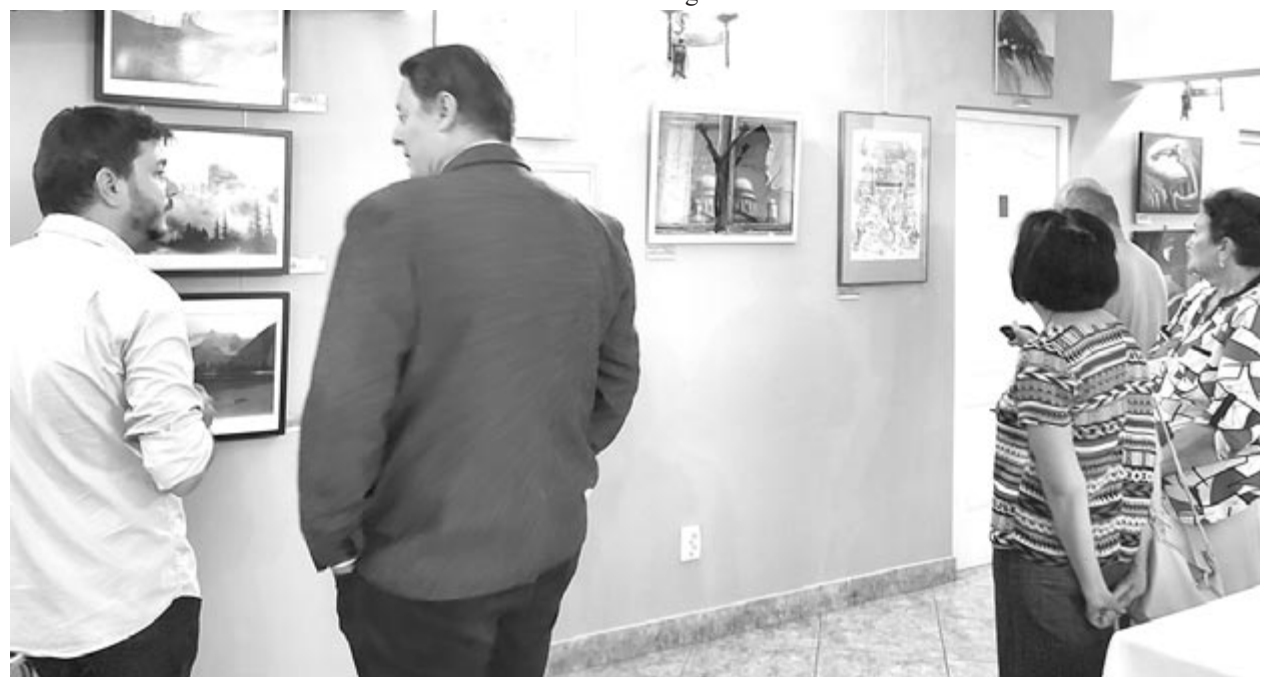
Augusztus végéig látogatható az esztergomi művészek most megnyílt tárlata