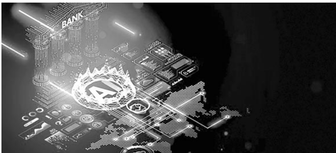
Mesterséges intelligencia és bank

Lehet hallani olyan híreket, hogy a későbbiekben egyre nagyobb teret fog hódítani a pénzintézetek esetében is. Ezzel azonban csökkenni fog az eddig észrevétlen csalások aránya és a hibák száma is. Összességében nézve a mesterséges intelligencia hatalmas segítség tud lenni a banki szektor számára annak érdekében, hogy pontosabban és kisebb kockázattal mellett történjenek a különféle műveletek. Az már egy másik kérdés, hogy mi lesz a tőzsdével, hiszen a mesterséges intelligencia nagyobb valószínűséggel fogja tudni megjósolni az árfolyamok alakulását. Ez egyrészt kiszűri a spekulációt, másrészt viszont csökkenti a befektetések mértékét, ami vállalatok bebukását eredményezheti.