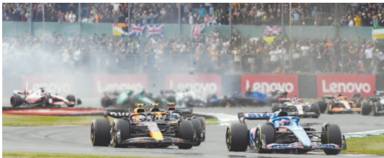
A futamot közvetlenül a rajt után egy órára felfüggesztették, miután az első kanyarban több autó ütközött, Csou Kuan-jü, az Alfa Romeo kínai versenyzője pedig óriási balesetet szenvedett

* csapatok: 1. Red Bull 328 pont, 2. Ferrari 265, 3. Mercedes 204, 4. McLaren 73, 5. Alpine 67, 6. Alfa Romeo 51, 7. Alpha Tauri 27, 8. Haas 20, 9. Aston Martin 18, 10. Williams 3