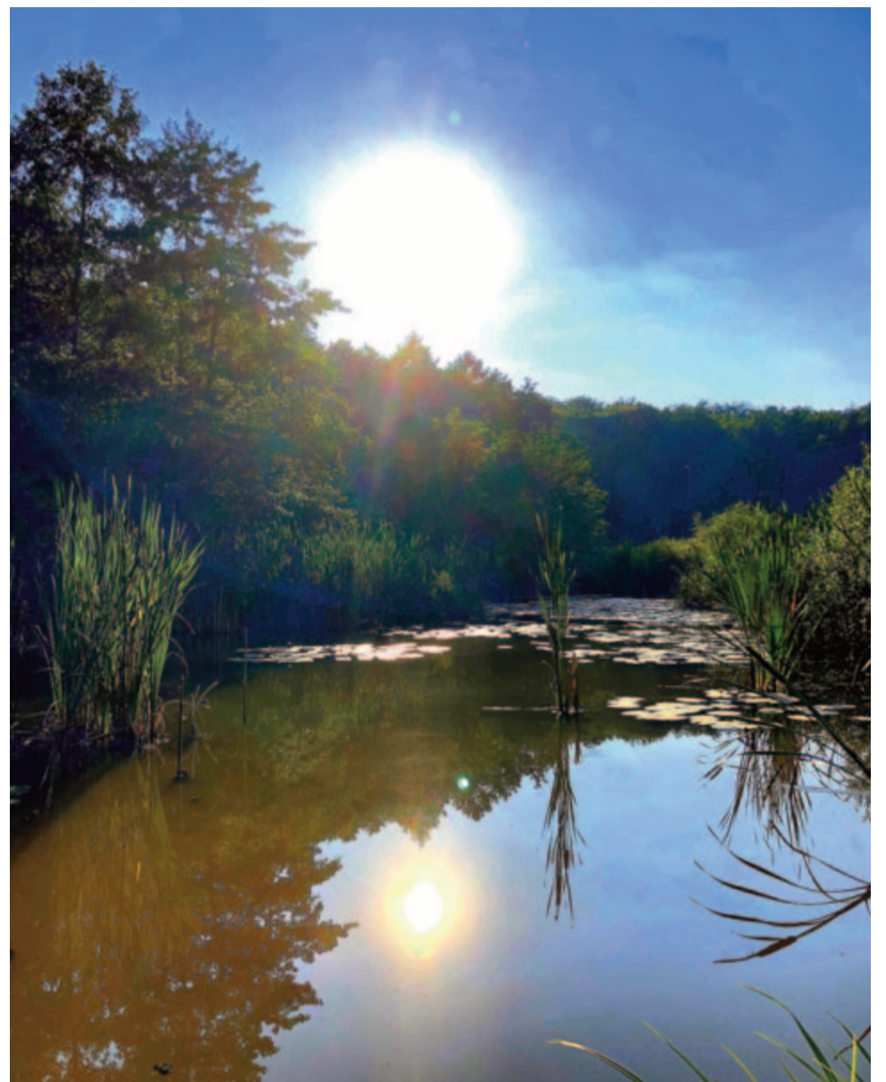
Ez itt az ég, ez itt a nyár

Abban az évben, 1894-ben, amikor Borbás megírta cikkét a sulyomról, július 8-án, Szentpétervár elővárosában, Kronstadtban született a különös élettörténetű orosz fizikus, Pjotr Leonidovics Kapica . Az első világháború idején, 1918-ban szerzett mérnöki diplomát Szentpéterváron, a polgárháború körülményei között spanyolnáthában elvesztette egész családját. Ekkor mentora, Abram Fjodorovics Joffe fizikus, Cambridge-be, Ernest Rutherfordhoz szerzett számára kutatói ösztöndíjat. Itt szupererős mágneses terek előállításával és az ott lejátszódó jelenségek eredményes kutatásával hívta fel magára a figyelmet. Jól beilleszkedett az itt dolgozó tudósok közösségébe, Rutherford saját utódját látta benne. De 1934-ben egy szokásos hazalátogatás után nem engedték vissza a Szovjetunióból. Sztálin a szovjet fizikai kutatások színvonalának emelése érdekében megvásároltatta Kapica Cambridge-i laboratóriumát a Kapica tervezte héliumcseppfolyósítóval együtt, és Moszkvában új fizikai intézetet létesített a számára. Itt sikerült felfedeznie a cseppfolyós hélium szuperfolyékonyságát. A második világháborúban a szovjet acélgártást segítette Kapica találmánya, egy ipari méretekben működő turbinás levegő-cseppfolyósító. Amikor az 1950-es évek végén Kapica a nagy teljesítményű mikrohullámú generátorokat kutatta, érdeklődése a szabályozott termonukleáris fúzió felé fordult, vagyis az atomerőművek irányába. Ekkor meghívták a titkos szovjet atomkutatásban való részvételre, de visszautasította a bomba-