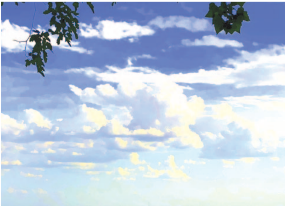
Csepegjete, ti terhes felhők, éltet

Maradok kiváló tisztelettel. Kelt 2022. július 8-án, 318 évvel azután, hogy II. Rákóczi Ferencet erdélyi fejedelemmé választották