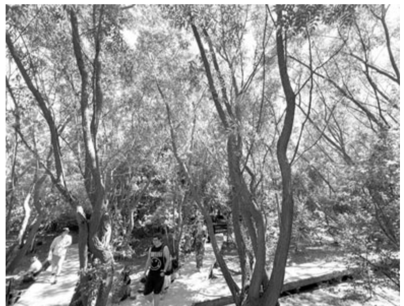
Bemenekülve a fák közé