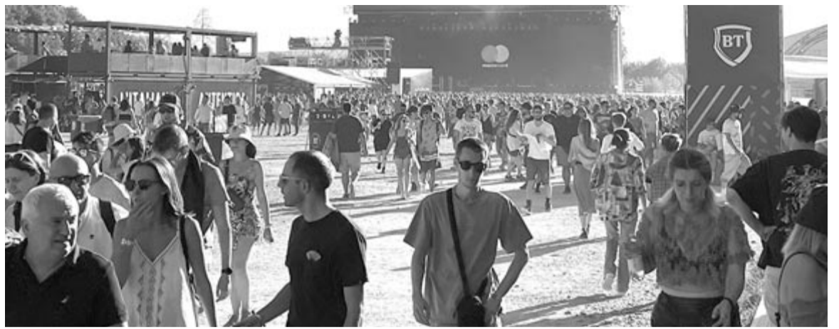
Koncert után a nagyszínpadnál

A másik történet pedig az idei kiadáshoz kapcsolódik. Érkezésem után találkoztam – először személyesen – egy évfolyamtársammal. Egypár mondat után megállapítottuk, hogy az Electric Castle az a fesztivál, ami bizonyos értelemben visszaadja az emberekbe vetett re-