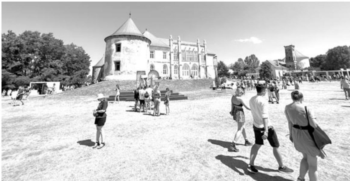
A bonchidai Bánffy-kastély az Electric Castle ideje alatt

Összességében az Electric Castle idei, nyolcadik kiadásának is megvolt az a hangulata, amiért minden évben érdemes oda visszamenni, amiért a fesztiválózókat várják a júliust és azt, hogy Bonchidára meheszenek. Továbbá pedig a zenei felhozatalra sem lehetett panaszkodni. Az elektronikus zene válfajain belül mindenki megtalálta a hozzá közel álló stílust.