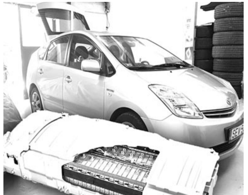
Toyota Prius és elhasznált akkumulátorcsomag, illusztráció