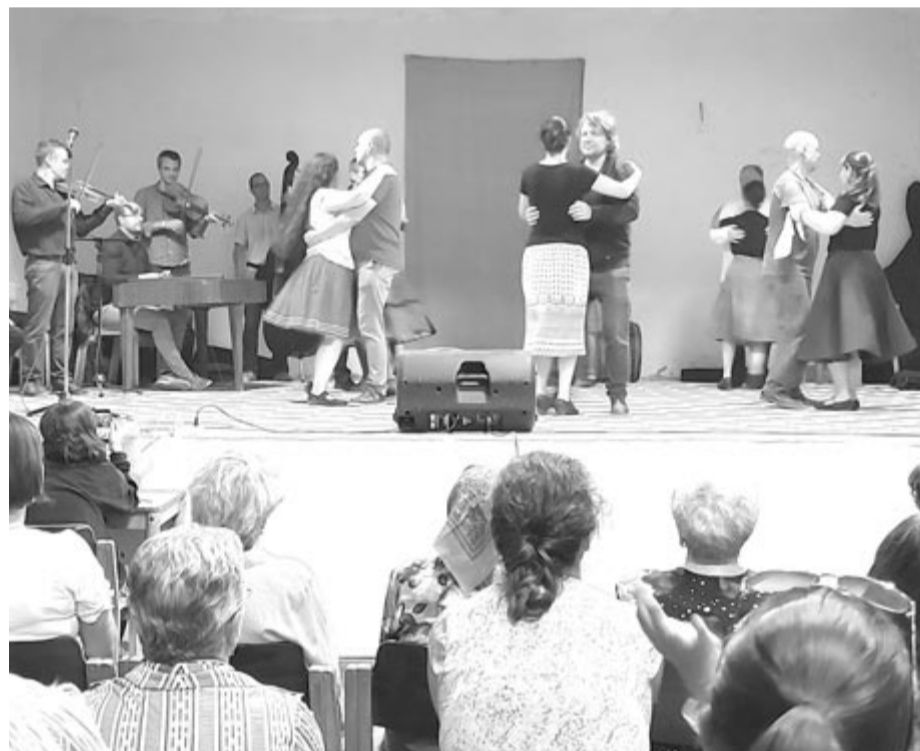
Táncelőadásokkal és hajnalig tartó tánczóval zárták az idei marosszéki tábor

borban, mindössze 121 bejelentkezett személy, ez talán a legkisebb létszám az elmúlt huszonegy év alatt, és úgy tűnik, hogy még az elmúlt két év online táborai iránt is nagyobb volt az érdeklődés. Az idei táborban a hazai és magyarországi érdeklődők mellett Finnországból, Portugáliából és az Amerikai Egyesült Államokból érkeztek „lakók”, Ázsiát és Afrikát ezúttal senki sem képviselte.