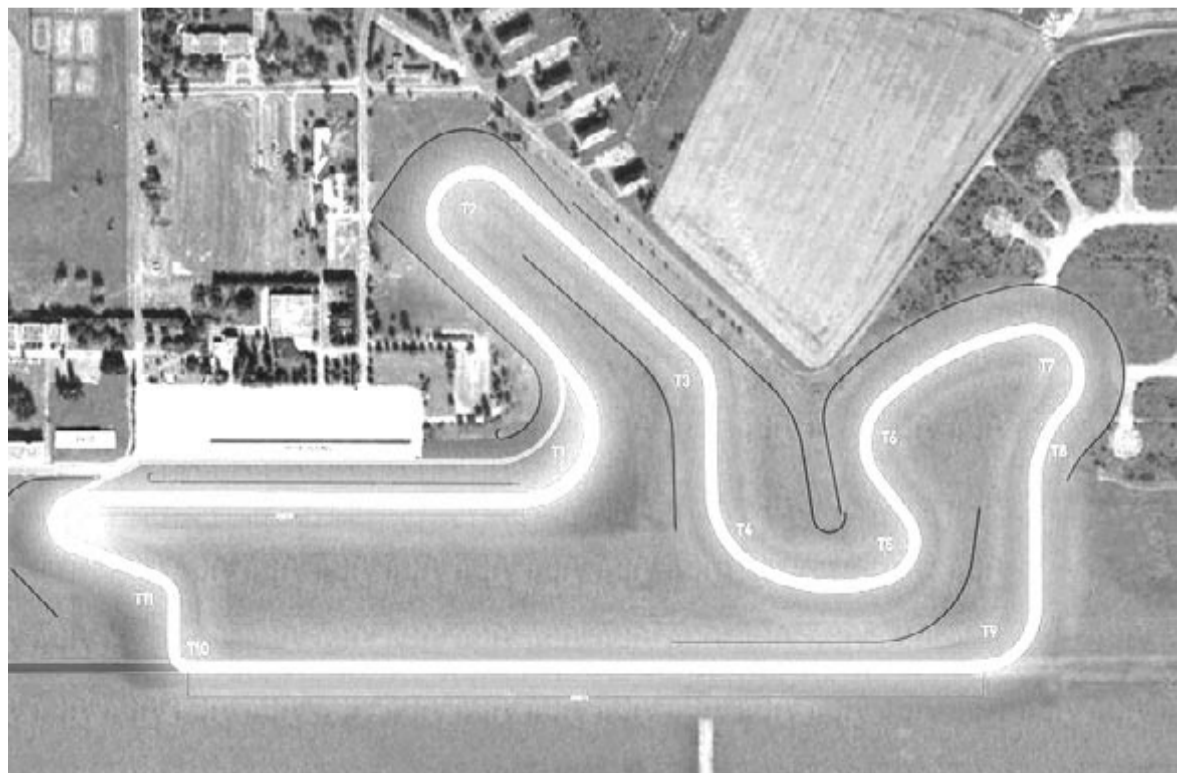
Couvron Eco Circuit

egyáltalán nem kizárt, hogy valóban képes lesz felépíteni ezt a versenypályát az elektromos autók számára.