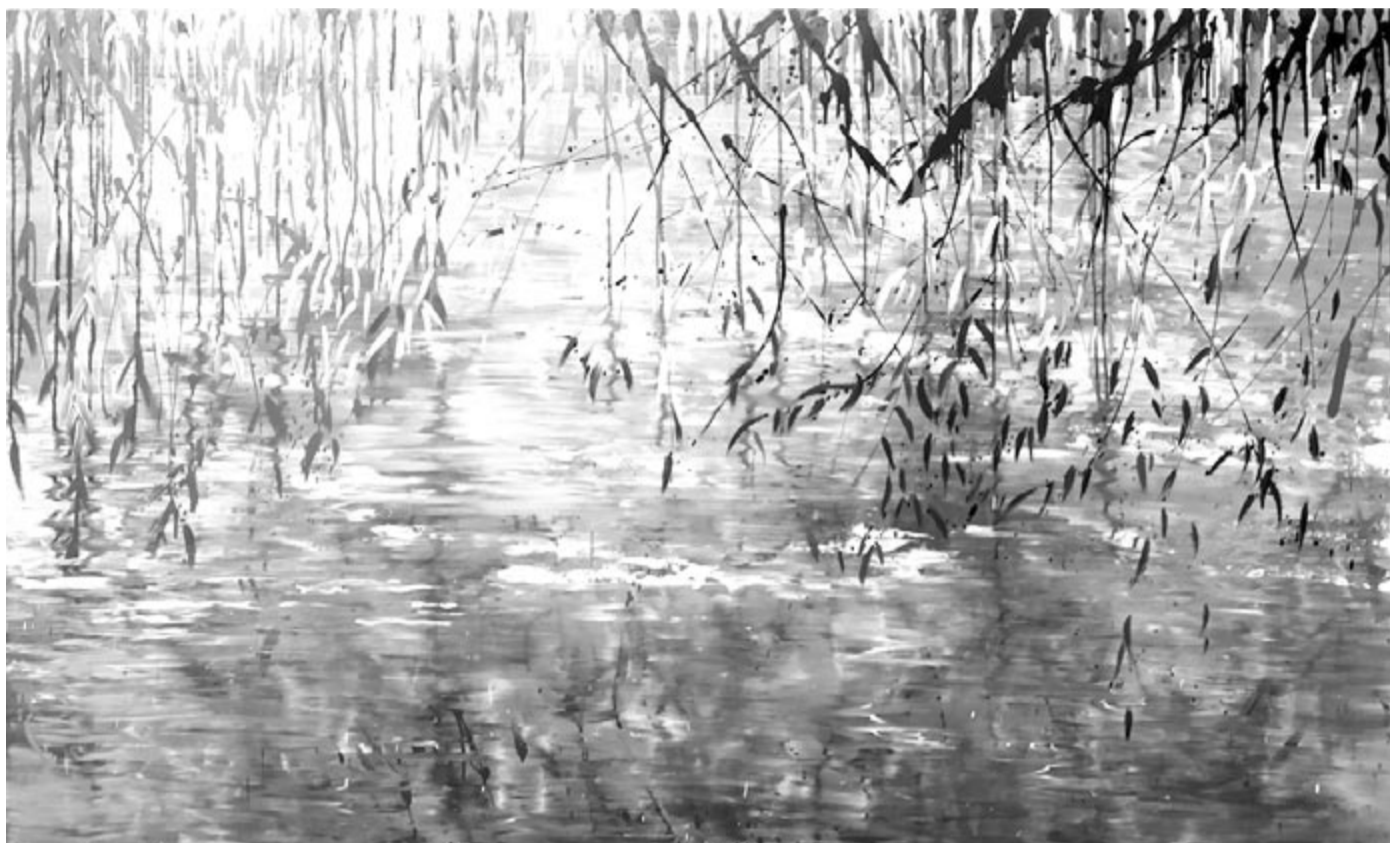
Vízükör... Knyihár Amarilla képe

hogy a miénk! Talán kétségbeesve, de adj erőt s hitet mindenkinek, hogy verseidnek ritmusát kövesse!