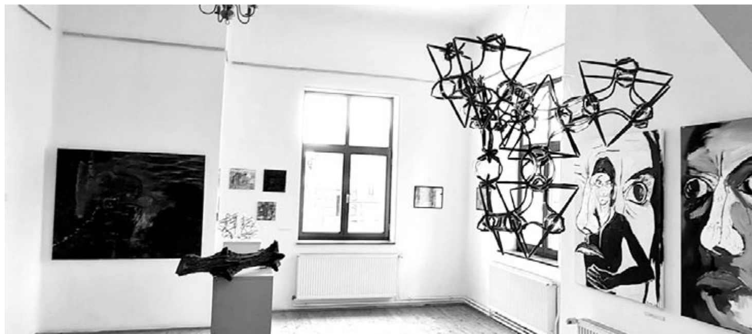
Kiállítás a gyergyószárhegyi Cika teremben

Végül egy másik vásárhelyi érdeklőségű alkotótáborról is ejtsünk szót, a Vadárvas-károl , amely közel két évtizede működik a Bucsin túloldalán, Bükkfőn, a Sövér Elek Alapítvány jóvoltából, Gál Mihály elnök szervezésében, és a többségét minden alkalommal a Marosvásárhelyről érkezett alkotók képezték. A táborozók tárlatát hagyományosan Gyergyóalfaluban nyitják meg a vasárnap délelőtti nagymise után. Ez alkalommal is úgy lesz, július 31-én az Új Galériába várják a közönséget. (nk)