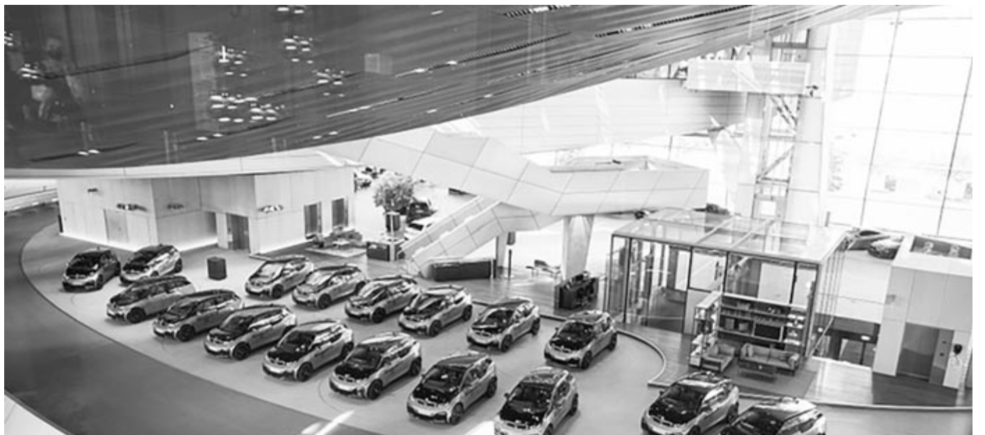
BMW i3, Galvanic Gold változat

Nemrég készült az i3-ból egy Home Run kiadás is, amelyből mindössze 10 darabot gyártottak. Ebből ötöt sötétzürkére, ötöt pedig sötétvörösre festettek. Ezzel is a sportosságukat akarták hangsúlyozni, ahogyan a 20 colos felnikkel is. A Home Run esetében a hangzásra is odafigyeltek. Mind a tíz példányt Harman Kardón hível szerelték fel. A Home Run kiadás összes példányát elkelt.