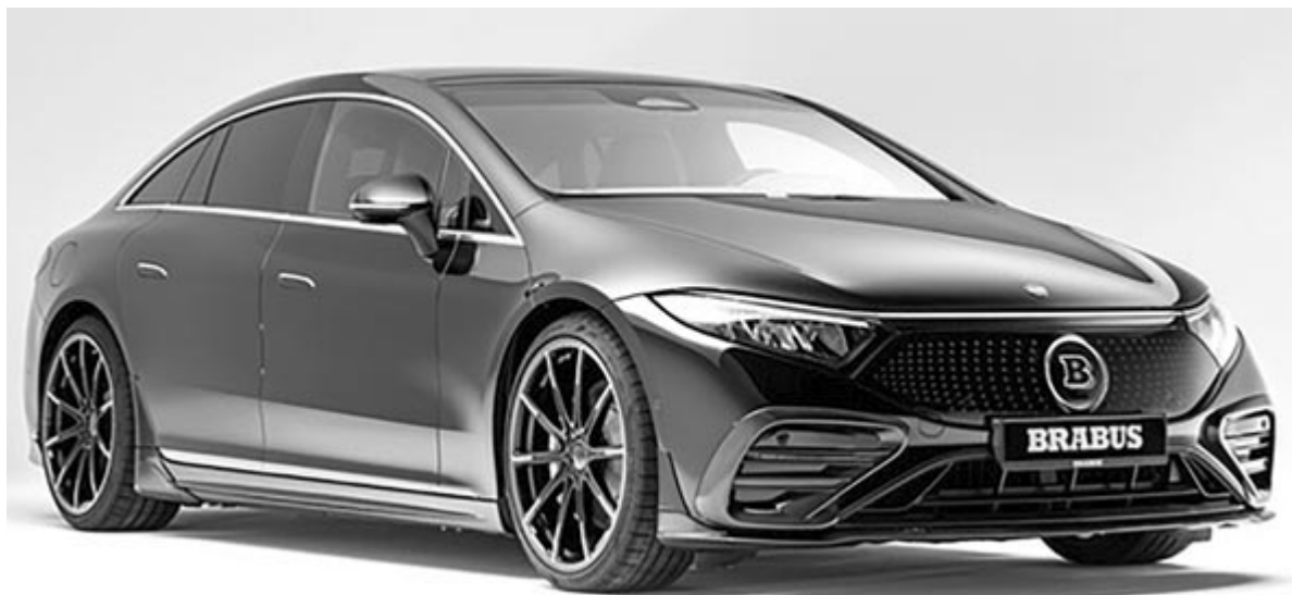
Brabus EQS

A Brabus mindig arról volt híres, hogy fog egy modellt, és addig faragja, ameddig sokkal erősebb nem lesz, mint ahogy az eredeti gyártó tervezte. Emellett pedig természetesen a külalakra is odafigyel, hogy sokkal sportosabb legyen. Most viszont egy teljesen új területen próbálta ki magát. Elektromos autót tuningolt, még hozzá oly módon, hogy nem nyúlt hozzá a teljesítményhez. Ehelyett a hatótáv növelését tűzte ki célul.