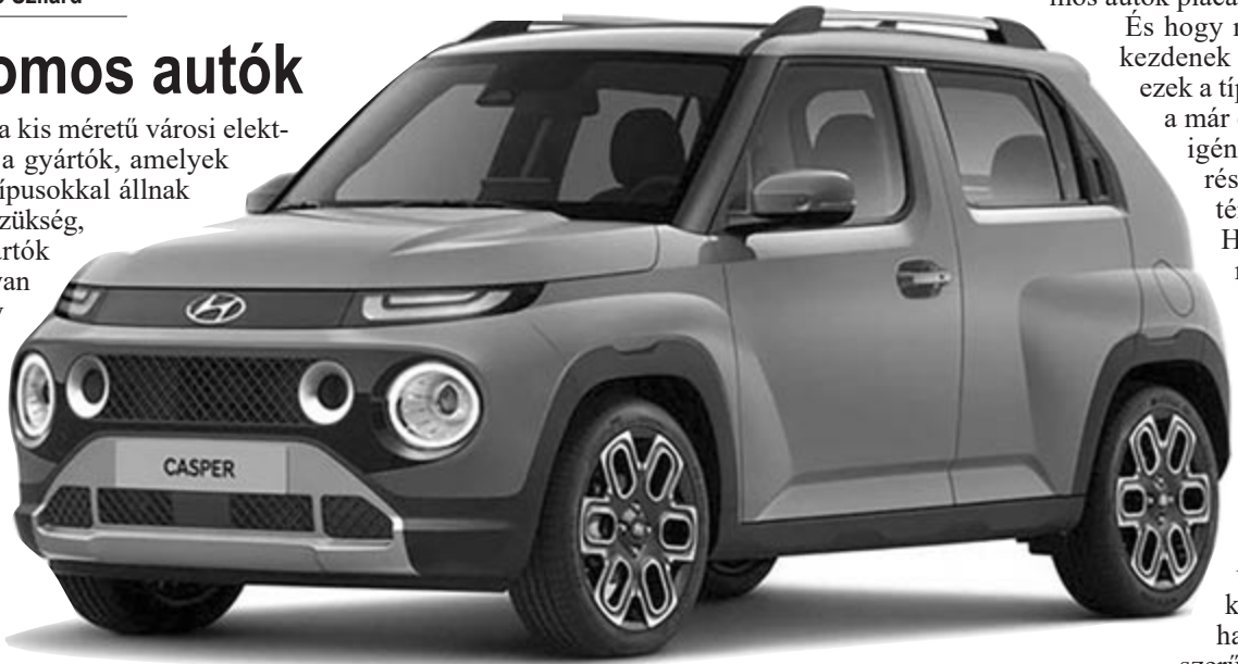
Hyundai Casper

A Hyundai a napokban jelentette be, hogy kimondottan Európa számára fog gyártani nem egy, hanem rögtön két kis méretű elektromos típust. Az egyik jövő év végén, a másik 2024 közepén mutatkozhat be, legalábbis a tervek szerint. A brit