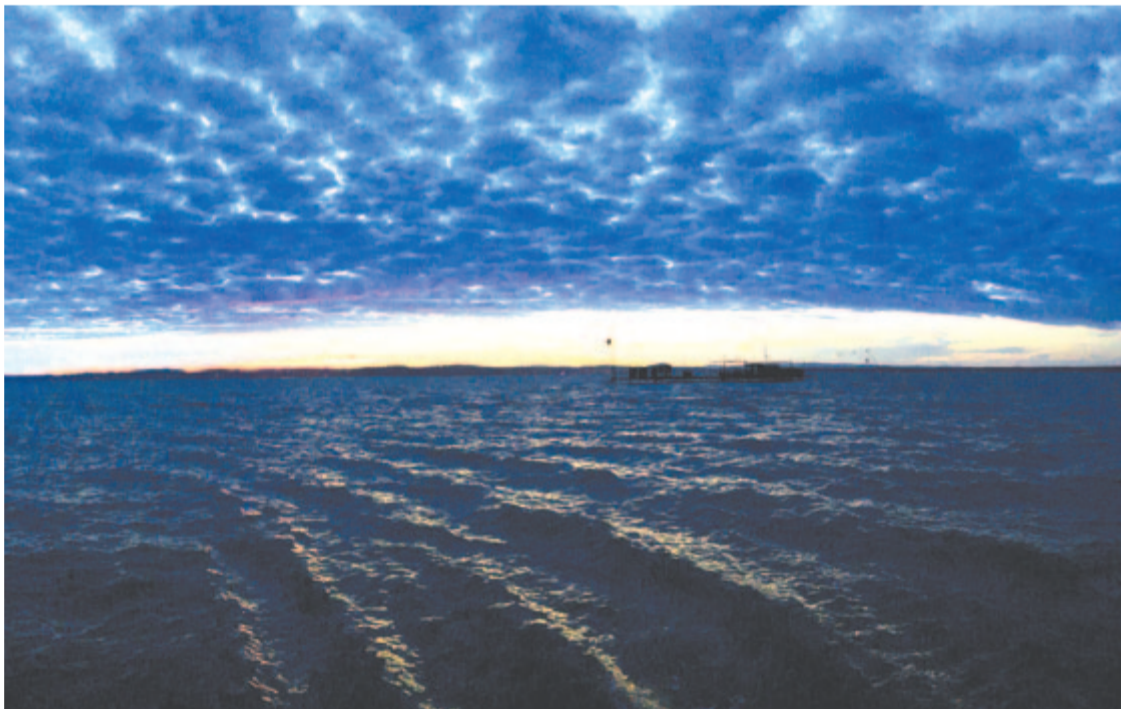
Kék hordókat gurít a viharelőtti csend

Kelt 2022-ben, őszi nap-éj egyenlőség napján