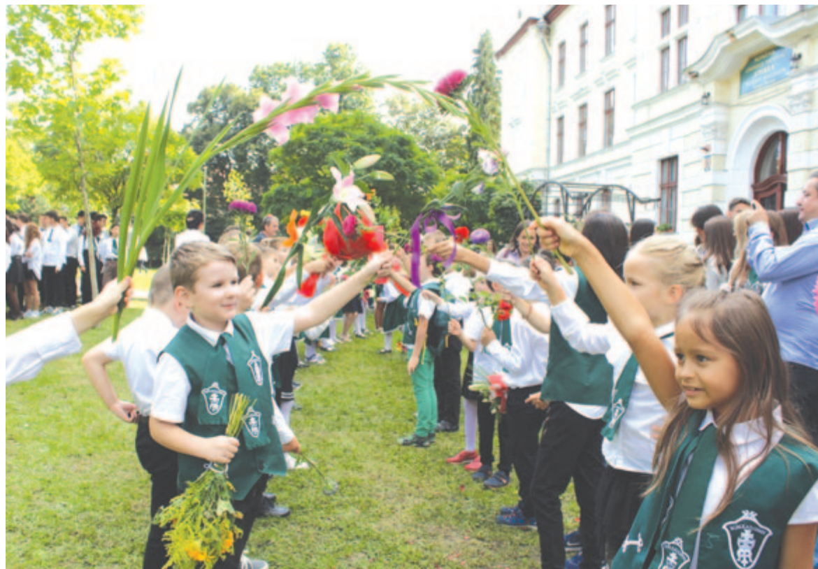
A 2022-es tanévnyitó a katolikus iskolában