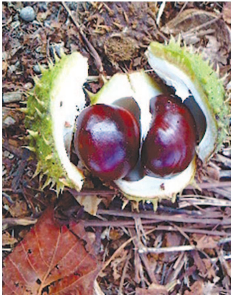
Néma robbanással hasadnak ezerfelé a töviskosztümű gesztenyék

Az áthallásos állattörténet erkölcsi mondandója – egyrészt az esszé még 1990 előtt íródott (a ketrecet formáló kézzé hasonlóan ketrecben tartott bohóccá degradálódása), másrészt aktualitását éppen a ma méregzöld aktivistáinak gyanús és rafinált állatimádata adja – emlék-