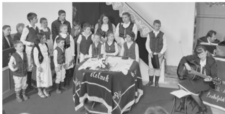
A gyülekezet kórusa és gyermekcsoportja is színesítette előadásával az ünnepi programot

Nt. Bíró István is köszönetet mondott a márkodiaknak, hogy együtt dicsérhetik az Úr nevét, illetve e szép hajlék látogatására buzdította a híveket. Az egyházkerület