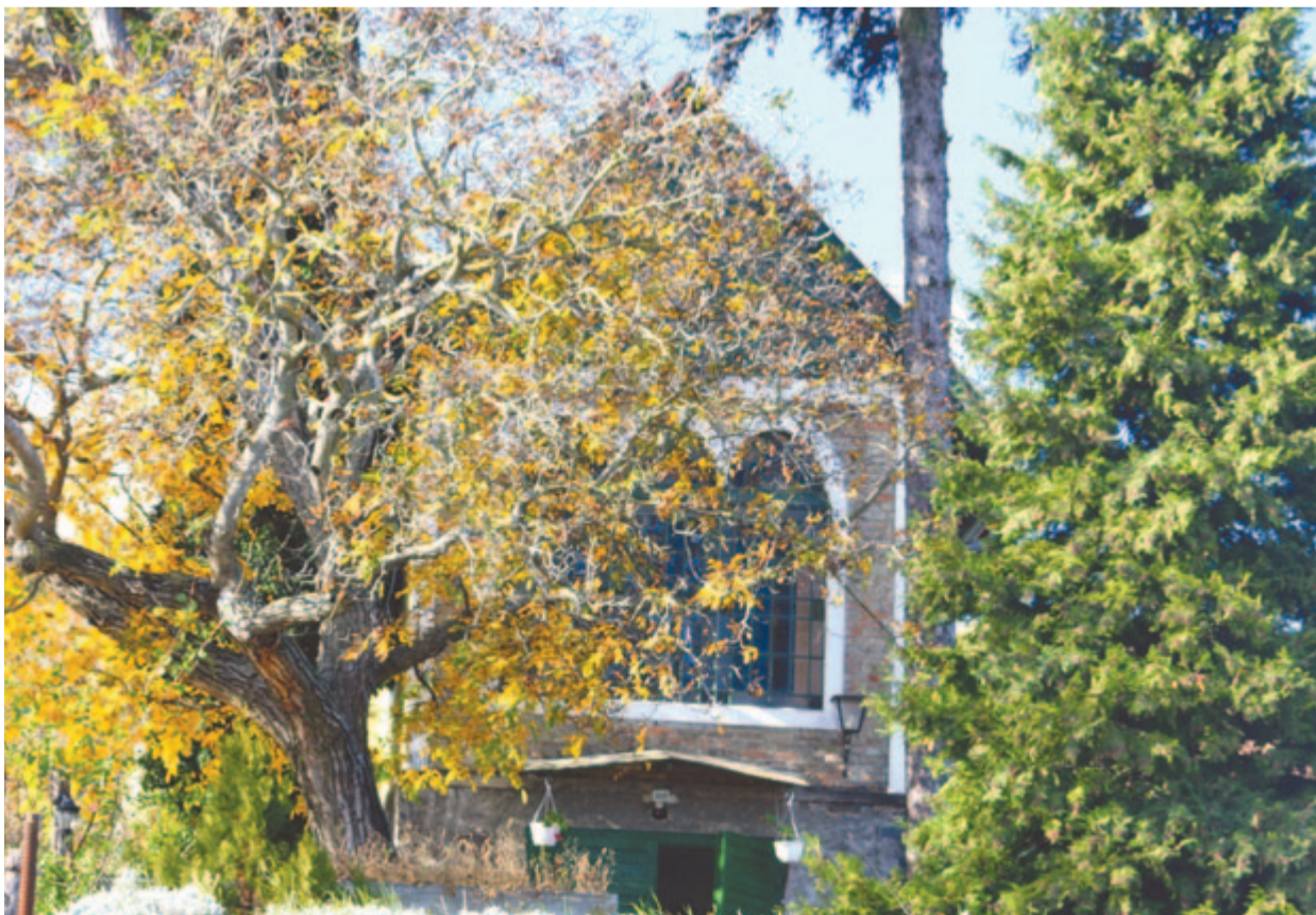
Az őszi kert már hetek óta csak felejt

Maradok kiváló tisztelettel. Kelt 2022-ben, Benedek Elek születése után 163 évvel