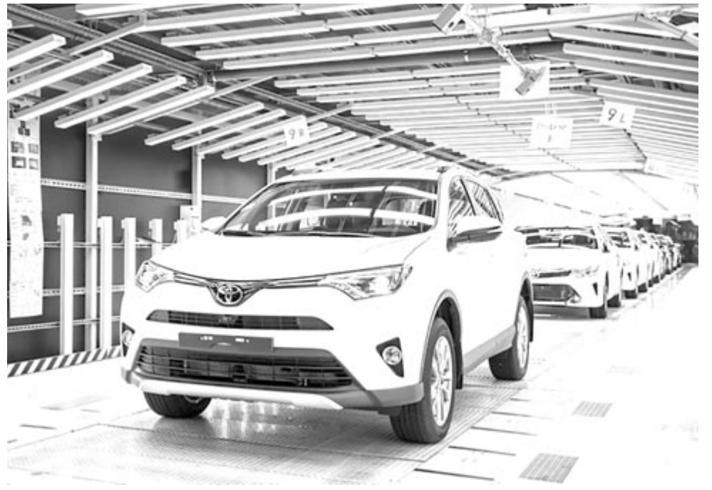
A Szentpéterváron készült Toyota RAV4 – egy darabig biztosan nem fog ilyen készülni Oroszországban

Ezen adatok fényében nem is csoda, hogy feltették a lakatot. Az viszont már egy másik kérdés, hogy mi történik akkor, ha nem sikerül eladni a gyárat, és lejár a háború, ezzel együtt pedig megszűnnek az ellátási láncban tapasztalható nehézségek. Ha ez bekövetkezik, akkor nem teljesen kizárt, hogy a japán óriásvállalat visszatér az országba. Arról egyelőre nincs hír, hogy addig is hol fognak készülni a Fehéroroszországba, Örményországba és Kazahsztánba szánt autók.