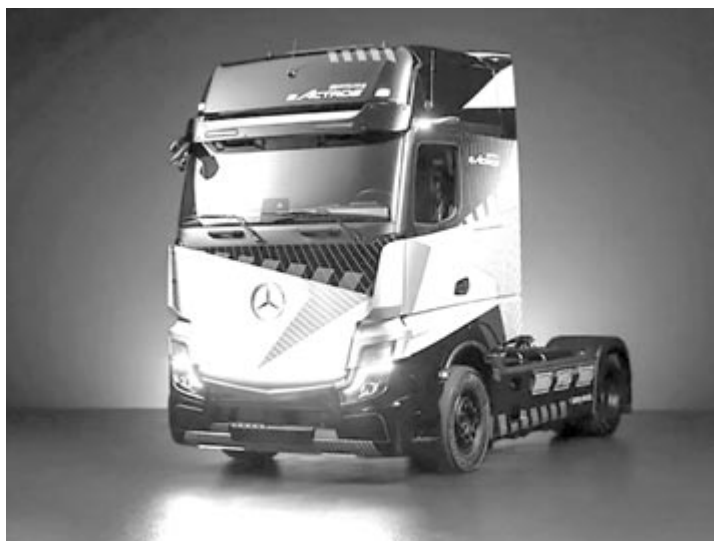
Mercedes eActros LongHaul, vontatórész