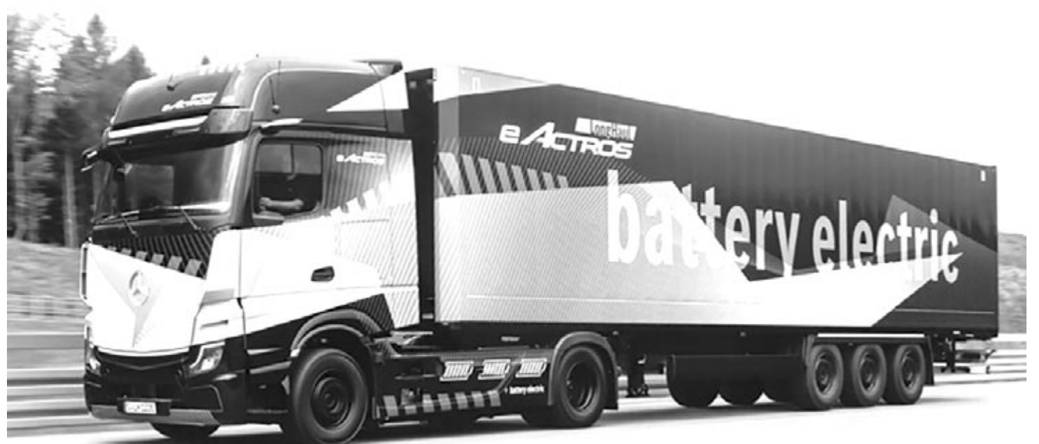
Mercedes eActros LongHaul

A tervek szerint a Mercedes-Benz eActros LongHaul a németországi Worthban készülne, ahol nemcsak a nagy, 500 kilométer megtételére elegendő akkumulátorral fogják felszerelni, hanem lesz egy olyan kivitelezésű is, ami csak 220 kilométert lesz képes megtenni egy töltéssel. Ebben egy 336 kWh-s akkumulátorcsomag fog helyet kapni. Értelemszerűen az ára is valamivel alacsonyabb lesz.