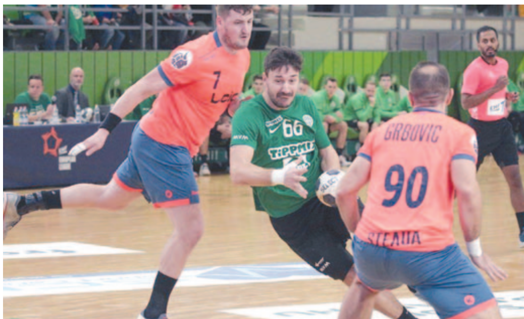
A Ferencváros nagyszerű hajrával ejtette ki a Bukaresti CSA Steaua együttesét

* női Európa-liga, selejtező, 1. forduló, első mérkőzés: MKS FunFloor Lublin (lengyel) – Siófok KC 18-27.