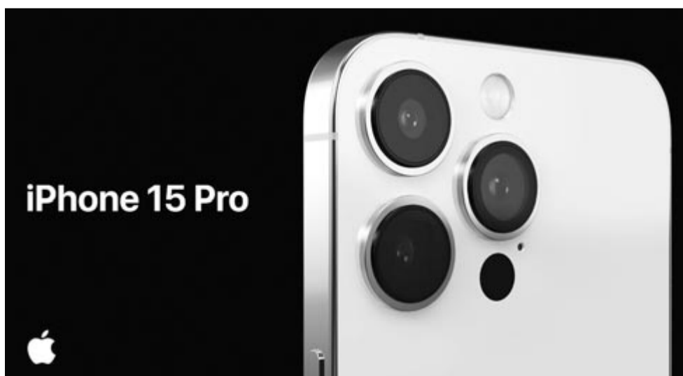
iPhone 15 Ultra koncepció

mutatták be, és Romániában például csak kevesen kapták kézhez a frissen és gyorsan előrendelt készüléket, sokan várják, hogy megérkezzen. Tehát ez a szóbeszéd még távolról sem biztos. Nyár elején szoktak megjelenni azok a híresztelések, amelyeket az idő aztán igazol szeptemberben. Persze ezzel együtt is szem előtt kell tartani, hogy az Apple évekre előre dolgozik, és a Nikkei Asia jelentése szerint a vállalat már most úgy döntött, hogy jövőben is követi az ideai stratégiát, azaz csak a Pro modellek kapják meg az új processzort. A jövőben várható sima iPhone 15 és iPhone 15 Plus az ideai A16-os csippel lesz szerelve.