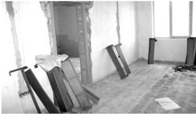
Az ígért épületben felbomlott a felújítás

– Tegnap majdnem depressziós voltam, ma már jobb a kedvem, amióta a polgármesteri hivatal tulajdonában lévő épület ötlete elhangzott. Ha átköltöztünk a főtanfelügyelő által felajánlott épületbe, a délelőtti oktatás kérdése is megoldódik. Amikor kiderült, hogy ki kell üríteni az iskolát, a közelben lévő tanintézményekre gondoltunk, de sehol sem volt annyi hely, hogy minden osztályunkat befogadják. Már az is megfordult a fejemben, hogy írok egy újságcikket arról, hogyan lehet felszámolni egy iskolát. De nem akarok senkinek