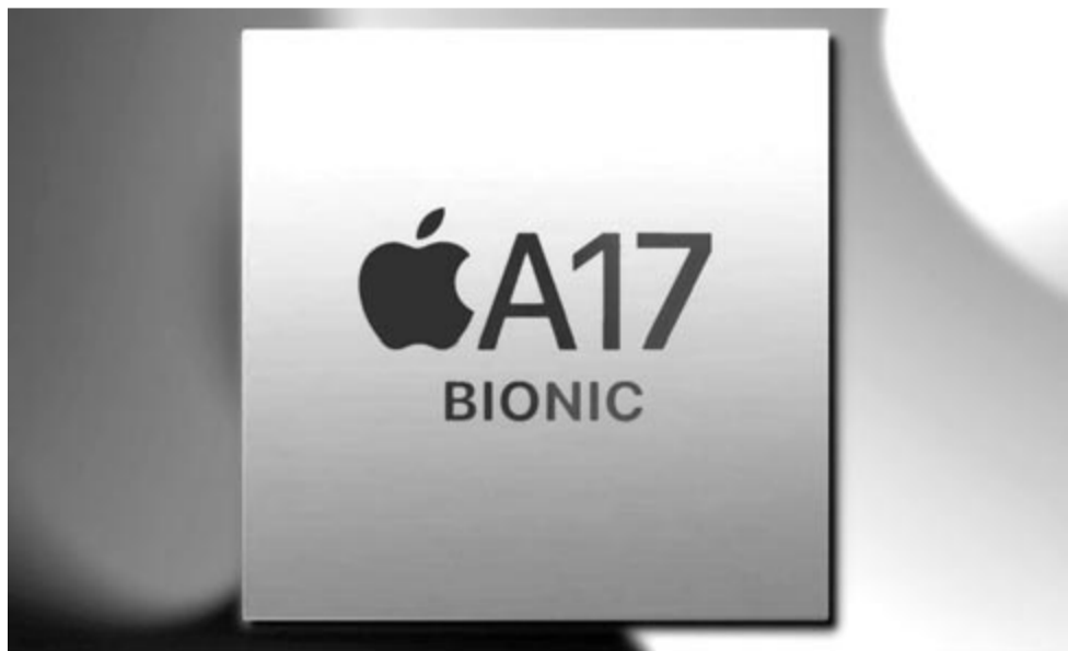
Az Apple jövőben várható A17-es processzora, illusztráció

Ezért szorgalmazta az Apple és a többi technológiai óriás, hogy jöjjön létre egy olyan alternatíva, amely biometrikus azonosítást használ, és végponttól végpontig tartó titkosítással bír. Természetesen az újdonság kapcsán rengeteg a szkeptikus, de a Passkey-nek van esélye arra, hogy elterjedjen, hiszen mostanra már szinte az összes okostelefon-felhasználó olyan készülékkel rendelkezik, amelybe be van építve vagy az ujjlenyomat-olvasó vagy az arcfelismerő.