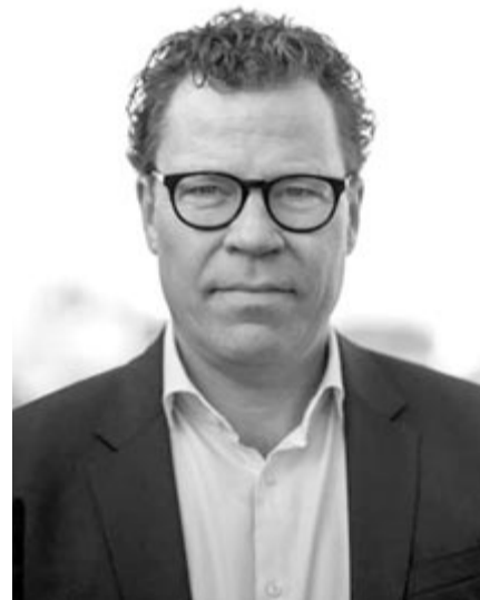
Morten Helveg Petersen

Véleménye szerint a tagállamoknak egységként, közösen kellene vásárolni, ahelyett, hogy egymást túllícitálva szereznek be a gázt, ez ugyanis csak „tovább növelné az árakat”.