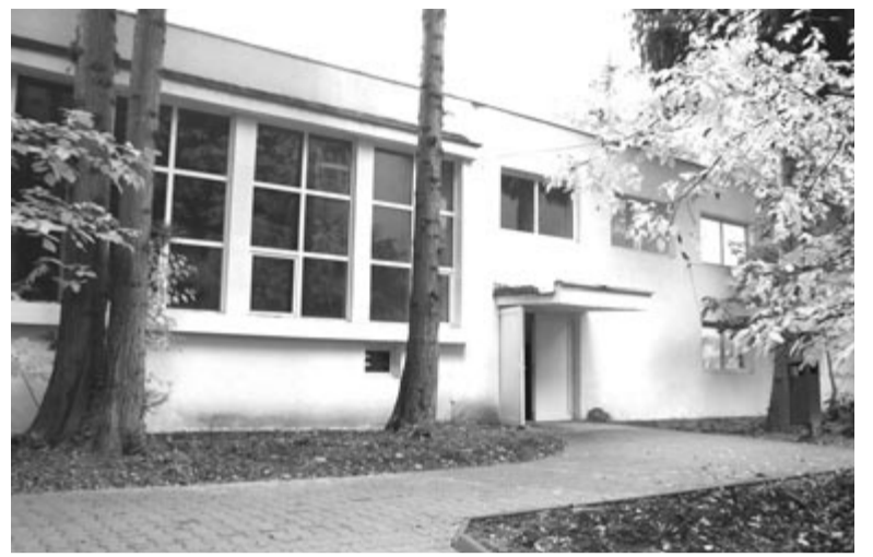
A műhelyekben is osztályokat rendeztek be

Marosvásárhely Polgármesteri Hivatalában Horațiu Lobonțot, az iskolákért felelős ügyosztály aligazgatóját kerestük először is arról, hogy mikor kezdik el a Șincai szak-