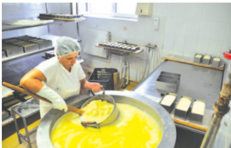
Készül a sajt a Lințuca tejfeldolgozó üzemben

Egyelőre termékeik mintegy 5%-át drágították, ugyanis tisztában vannak azzal, ha nem fizetnek többet a gazdáknak, akkor nem lesz nyersanyag. Az ármódosításról egyeztetnek a nagyáruházzal. Kevesebb gazda szolgáltatja be a tejet, és a válság miatt is kevesebb késztermék fogy, azonban igyekeznek segíteni a helyi gazdáknak, hogy átvészeljék ezt az időszakot, mert számukra is fontos, hogy termékük eljusson a vásárló asztalára.