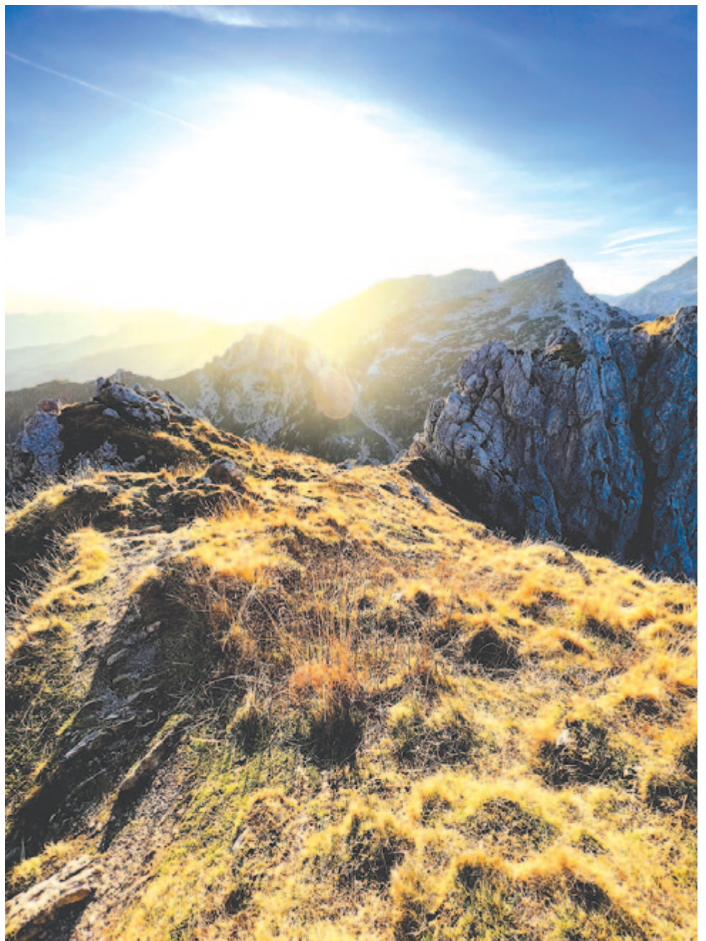
Novemberi dilemma – lehet-e másolni a lelket?

Ez azt jelentené, hogy amennyiben megvan előre határozva egy foton becsapódásának helye, akkor annak a meghatározottságnak legalább ennyi időre vissza kellene nyúlnia. Ez ténylegesen szinte az ősrobbanás óta fennálló korrelációkat jelentene, mintegy