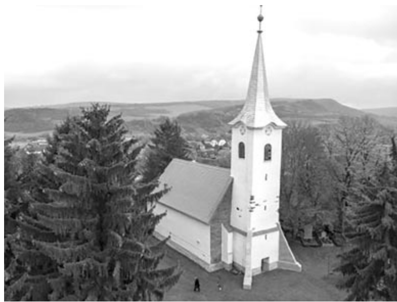
Székelyvaja reformátusai templomot újítottak, orgonát restauráltak és harangot öntöttek

Az ünnepségen ft. Kolombán Vilmos József püspökhelyettes figyelmeztette a híveket: nem várhatjuk el senkitől az Istennek tetsző életet, ha mi nem élünk úgy. Nem várhatjuk el az engedelmességet és az alázaatot, ha mi nem gyakoroljuk. Elöl kell járni a példamutatásban, a szolgálásban, és hátul kell maradni,