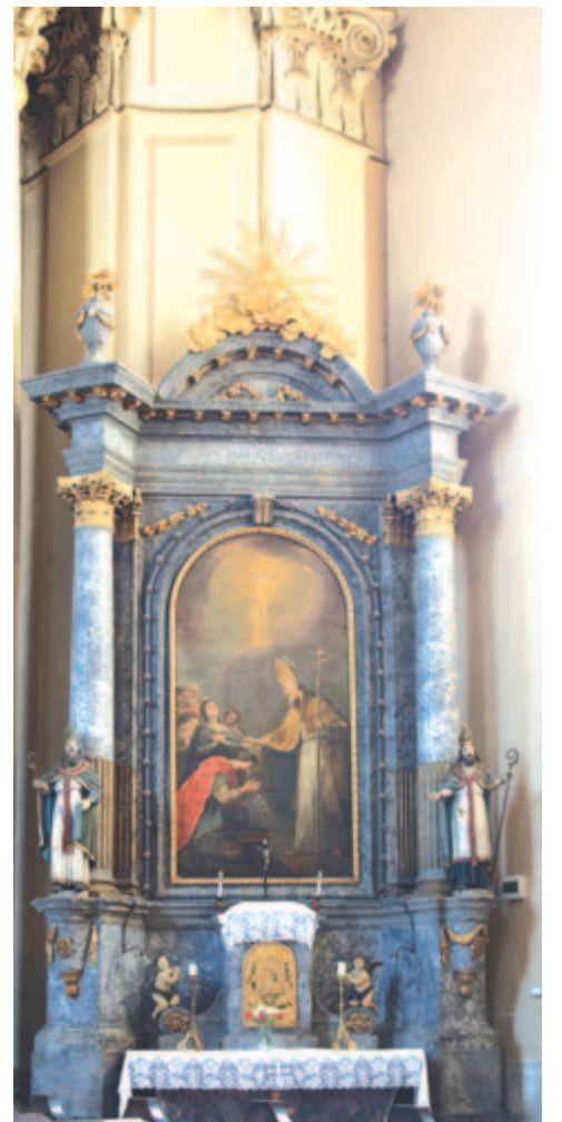
Szamosújvár, örménykatolikus templom

Todorán Endre könyvnyomdát is működtetett, ahol helyi sajtótermékeket és más örmény településről származó kéziratokat is nyomtattak.