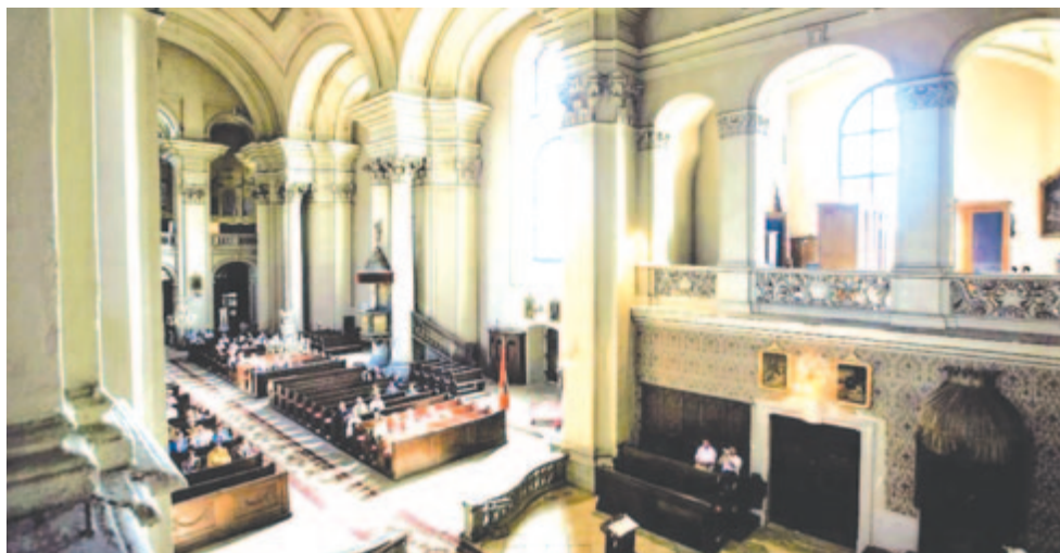
A szamosújvári örmény katolikus templom belseje

A munkálatok elvégzését ellenőrző tanácsot a Gondviselés mentette meg a biztos haláltól: hétfő lévén, Simay főbíró elaludt, és a megbeszélés kilenc óra helyett csak tíz órára érkezett. A torony tíz óra előtt néhány perccel dőlt össze. Egy évvel később azonban újra állt.