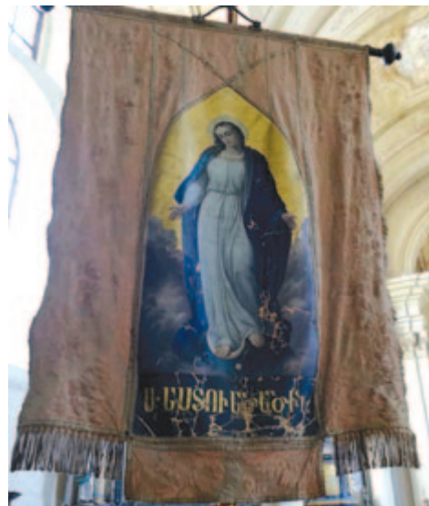
Szamosújvár, örmény feliratos zászló

Az örmény feleségek vezették kereskedő férjük távollétében a háztartást, hiszen a kereskedők csak novembertől februárig tartózkodtak otthon.