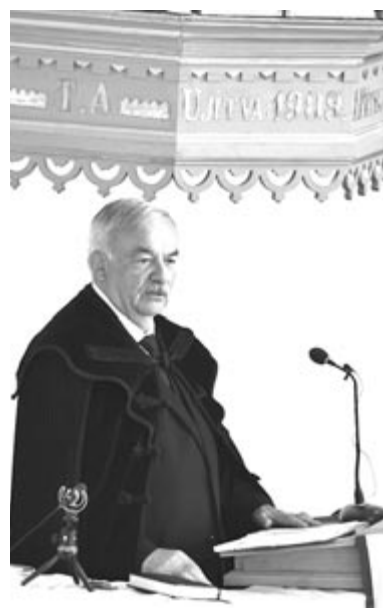
Az egyházkerület püspöke biztat: Isten csodálatos módon segít