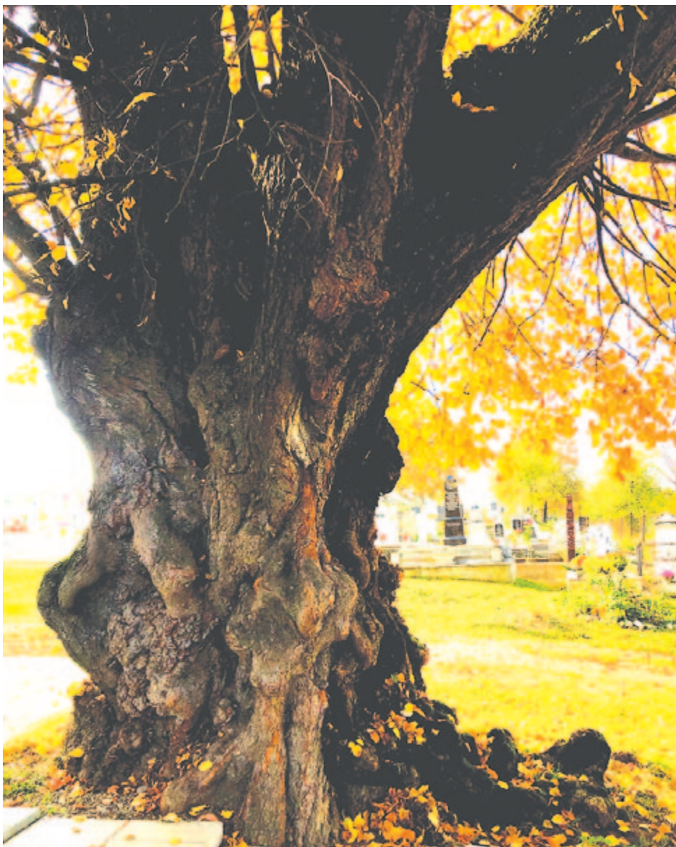
Vámosgálfavi vén hárs – testvérként nézek minden falevéltre

Már átittattad minden idegem, s mintha az őskori növényi létre emlékezni, úgy vacog a szívem, ha öldöklő szeled cibálni kezd s testvérként nézek minden falevéltre.