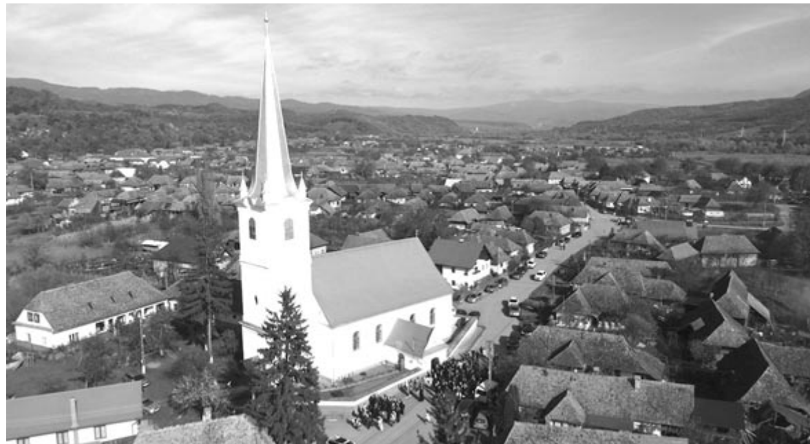
A 200 éves templom teljes pompáját ünnepelte a kibédi gyülekezet

A THEREZIA KFT. B kategóriájú jogosítvánnyal rendelkező GÉPKOCSIVEZETŐT alkalmaz. Önéletrajzát, kérjük, juttassa el a therezia@therezia.ro e-mail-címre. Érdeklődni a 0265/322-441, 0749-228-434-es telefonszámokon lehet. (sz.-1)