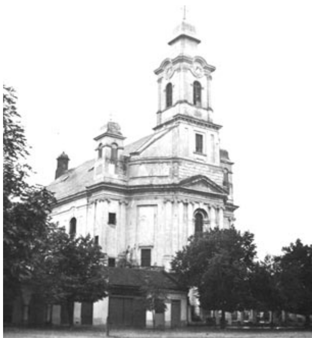
Kolozs megye, Szamosújvár, 1940, örmény katolikus templom

A mezőségi út védelmére épült 13. századi várhelyet először Szatmári Laczk Jakab erdélyi vajda erősítette meg. Nagyjából az 1540-1541-es években épült Martinuzzi Frá-