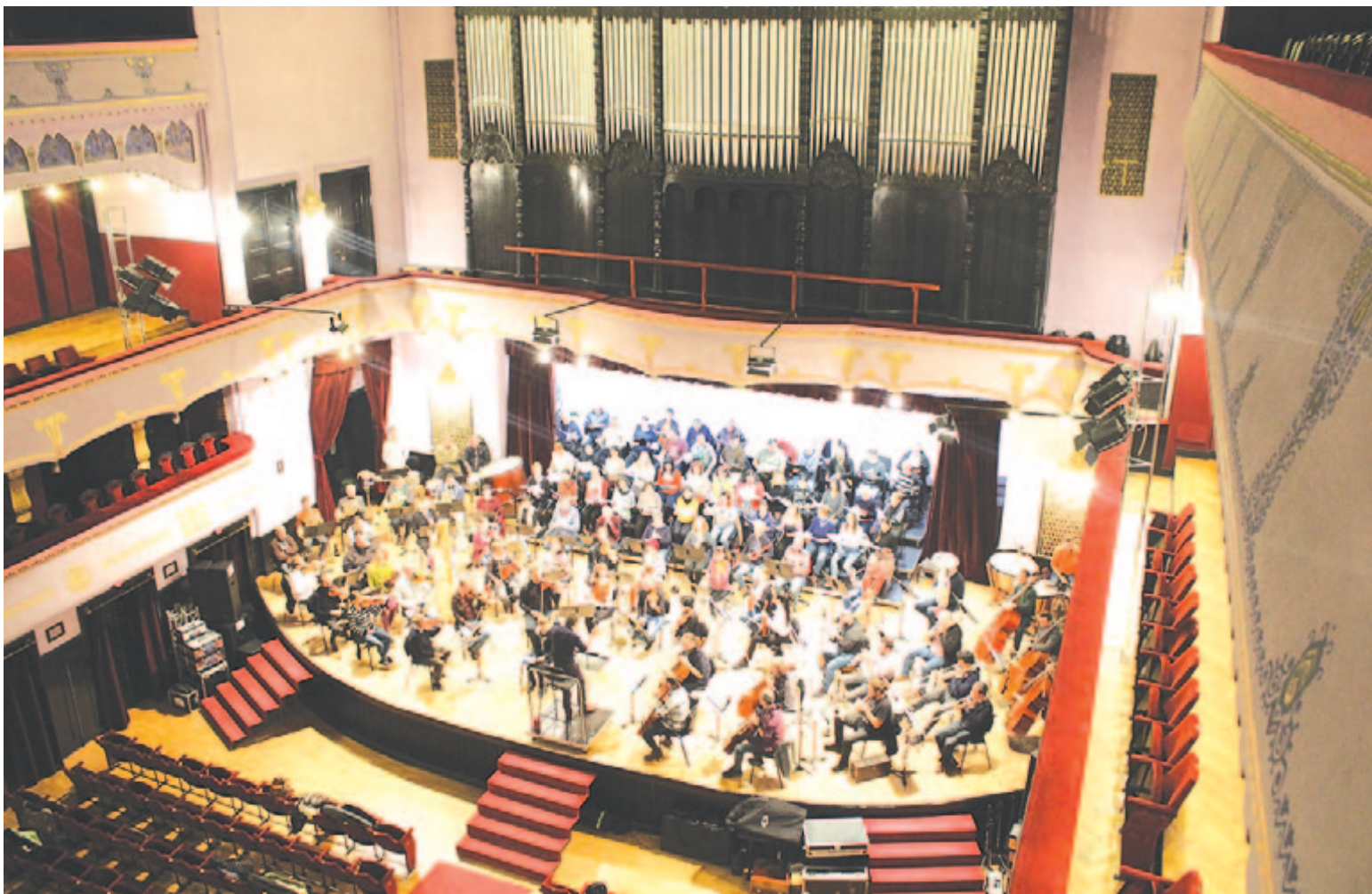
Zenekari próba a nagyteremben

Ne feledje idejében megújítani előfizetését! Ha előfizet, biztosan kézhez kapja, féláron!